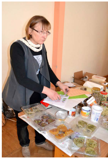
Meža labumu ciemā Žiguros tika gatavotas ziepes.