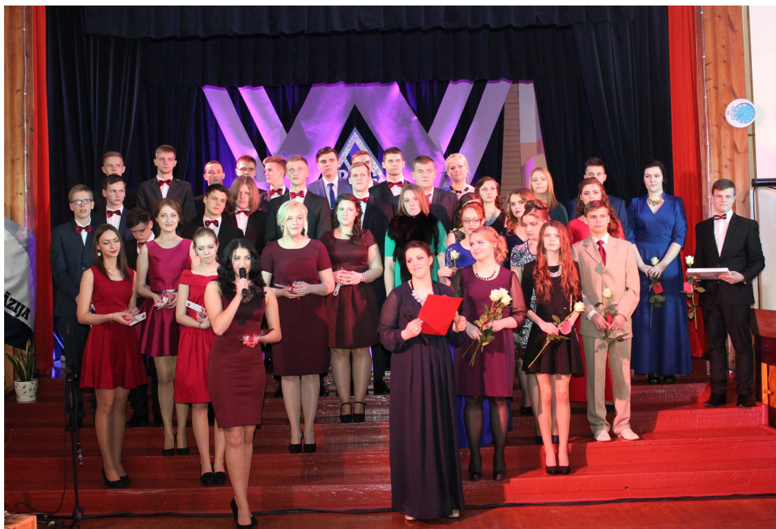
Balvu Valsts ģimnāzijas 12.klašu audzēkņi.

Pasākuma apmeklētājus pārsteidza žūrija, kura kopā ar audzēkņiem bija sagatavojusi pārsteiguma balvas – pašu gatavotus suvenīrus, ko paņēma līdzī vakara viesi. Šova uzvarētāja godu ieņēma 12.b klases un 3. kursa abiturienti, un savu uzstāšanos noslēdza ar melanholiskā valša deju un dziesmu „Tev vēl ir laiks”. Sajūta visam mūžam ir paņemta un sudraba zvaigznes ir plaukstās.