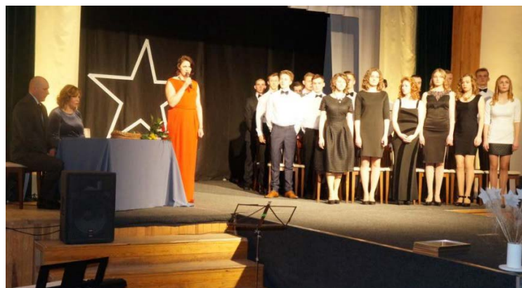
Balvu Profesionālās un vispārīzglītojošās vidusskolas abiturienti.