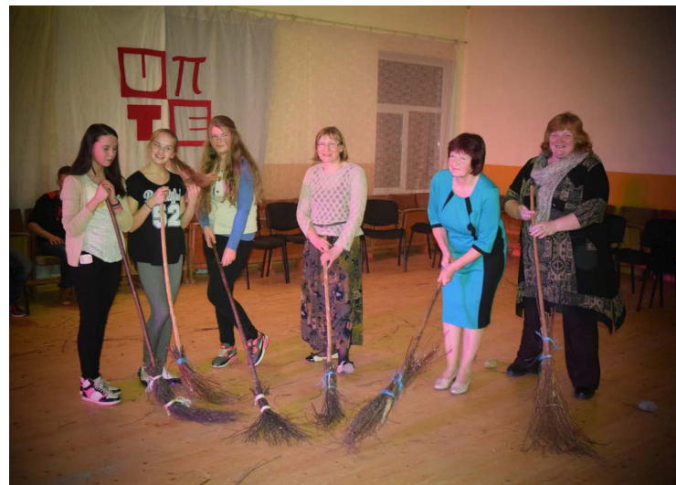
Upītes Tautas namā notika spēles un rotaļas. „Slotu hokeju” uzspēlēja Upītes jaunieši un Žiguru Meža labumu ciema dāmas.