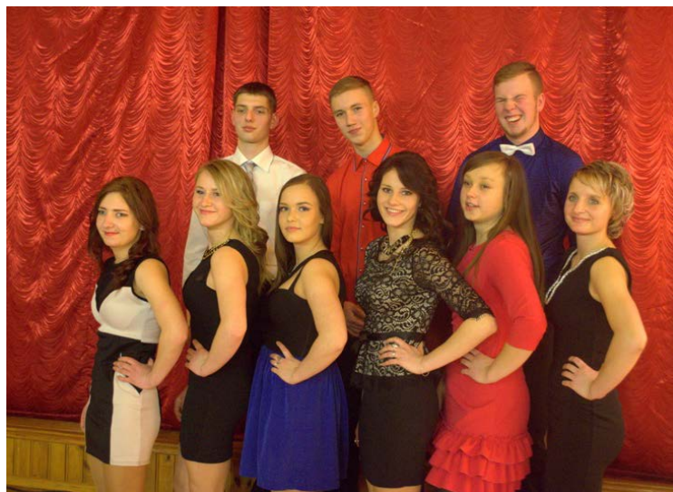
Tilžas vidusskolas 12.klases audzēkņi.

Paldies vārdus un mīlestības apliecinājumus abiturienti veltīja skolas direktorei, saviem vecākiem, audzinātājiem, skolotājiem un tehnikajiem darbiniekiem. Abiturientus sveikt bija ieradies arī Balvu novada