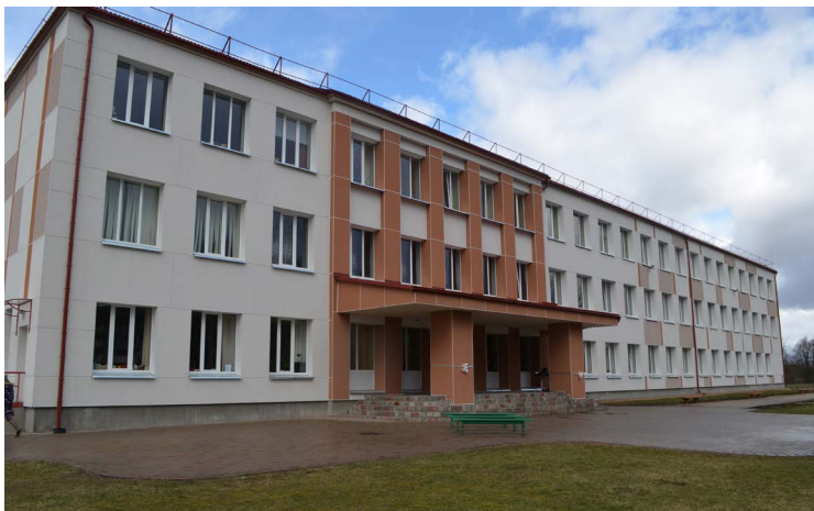
Tilžas internātpamatskolas renovācija noslēdzās 2015.gada aprīlī.

Skates „Gada labākā būve Latvijā 2015” fināls notiks šī gada 17. martā no plkst. 9.00 līdz plkst. 13.00 viesnīcā „Bellevue Park Hotel Riga”, un to bez maksas varēs apmeklēt jebkurš būvniecības interesents.