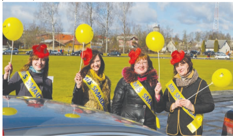
Sieviešu dienas rallijā piedalījās komandas no tuvākām un tālākām pilsētām, tai skaitā arī komanda „Ar smaidu uz priekšu!” no Rēzeknes.