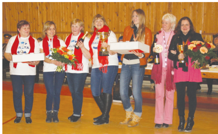
Otrās un trešās vietas ieguvējas – komandas „Baltīņas” un „Queens on Wheels”.