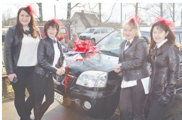
Pirmās starta vietu no Balvu pilsētas stadiona atstāja komanda „Viemnēr uz pareizā ceļa”.