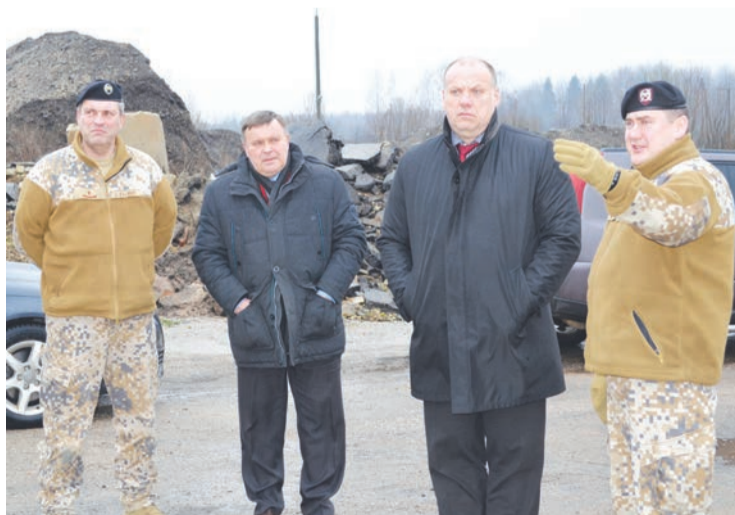
Aizsardzības ministrs R.Bergmanis uzsvēra, ka austrumu pierobežas iedzīvotājiem nav jābaidās, jo Latvijas militārie spēki tiek attīstīti, turklāt atbalstu sniedz arī sabiedrotie. Tā, piemēram, ASV šogad mūsu aizsardzības sistēmā ieguldīs 20 milj. dolāru.

iespēja atjaunot Zemessardzes rotas atbalsta punktu Balvos, jo, kā noskaidrojās, Zemessardzes 31.kājnieku bataljonā no 116 zemessargiem 80% nāk no bijušā Balvu rajona. Tikšanās laikā aizsardzības ministrs kopā ar Zemessardzes pārstāvjiem apskatīja Partizānu ielas teritoriju un ēkas, tomēr nekādas solījumus neveda: „Bataljona štābs ir dislocēts Alūksnē, bet rotas atbalsta punkts šeit ir. Protams, mēs vēlētos, lai tas būtu plašāks un lielāks, bet šobrīd mēģinām sistematizēt un saprast, kādus mēs vēlamies redzēt ideālos Zemessardzes bataljonus”.