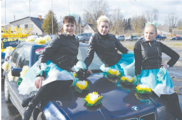
Komanda „Balvu ūdensrozēs” rallijā izcīnīja 5.vietu.