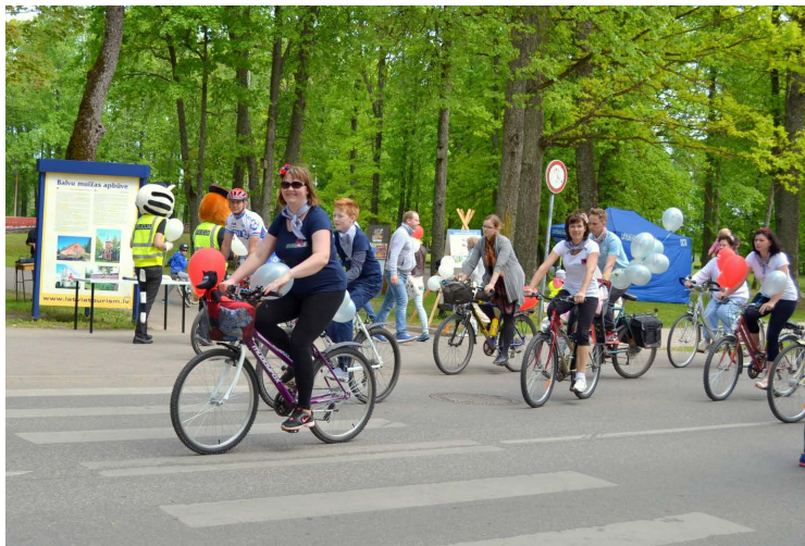
Parādes braucienā piedalījās aptuveni 70 dalībnieku.