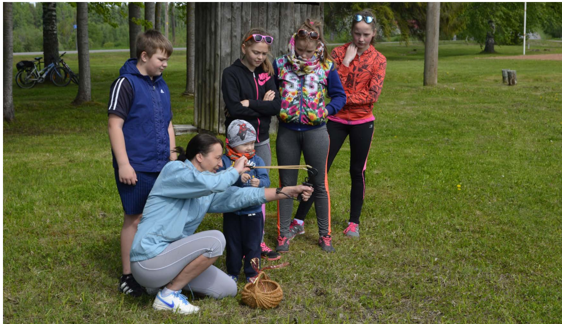
Izbrauciena finišā – atpūtas vietā Naudaskalnā, aktivitātes tika nodrošinātas gan lieliem, gan maziem.