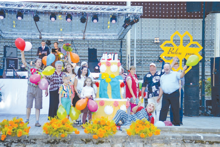
Un kur nu svētkos bez tortes!? To šoreiz sagādājuši prēcīgie Balvu pagasta ļaudis.