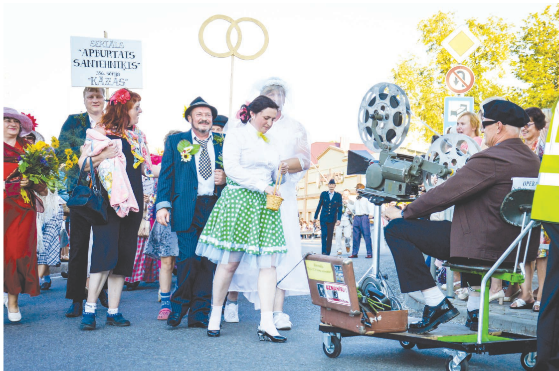
Kā katru gadu, arī šogad PA „San-tex” pārsteidza ar savu radošumu un izdomu, radot gājiena tērpus. Šoreiz kolektīvs atainoja seriāla „Apburtais santehniķis” tapšanu, par ko ieguva gājiena galveno balvu.