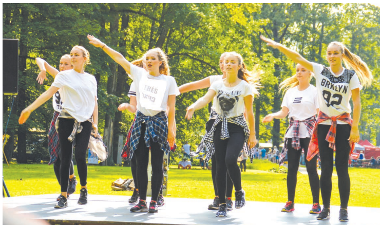
Moderno deju paraugdemonstrējumus rādīja „Di-dancers” meitenes, kuras ar interesi piedalījās arī pārējās deju meistarklasēs.