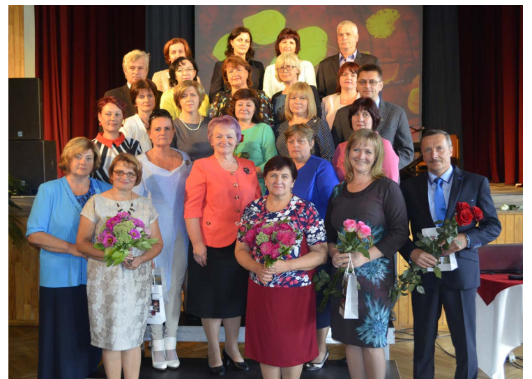
Izglītības iestāžu vadītāji kopbildē vienojās 1.septembra sveicienam.