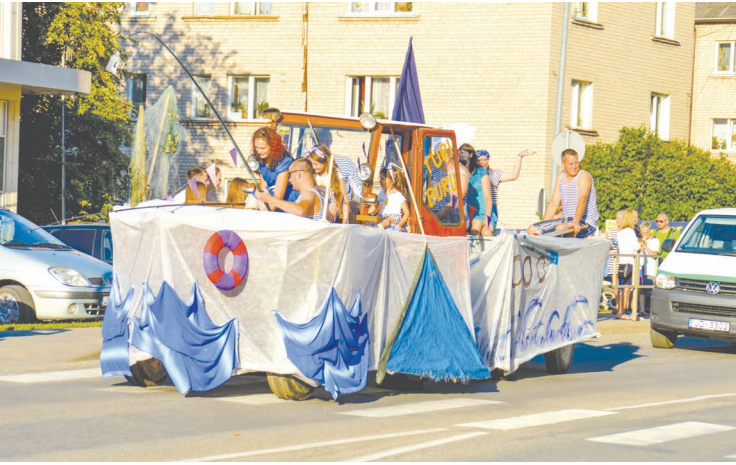
Vīksnas pagasta tautas deju kolektīvs „Piesitiens” ar savu jūrnieku ekipāžu parādes braucienā ieguva 3.vietu.