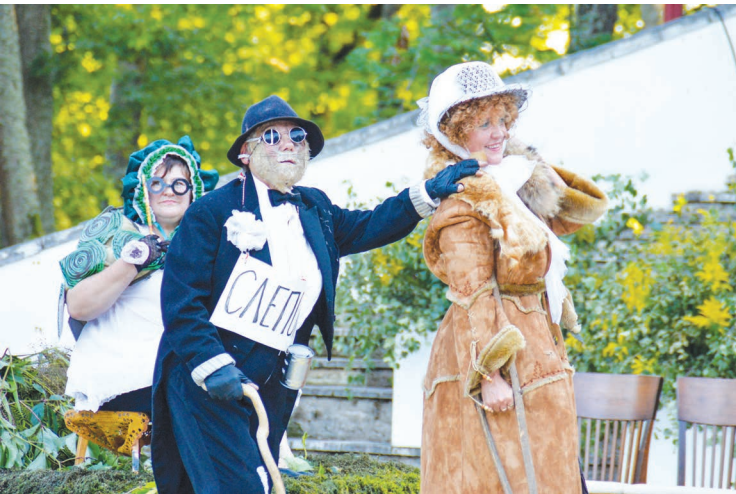
Humora un aktiermeistarības netrūka arī Bērzkalnes pagasta kolektīvam, kuri gājienā pārtapa par multfilmu „Buratino piedzīvojumi” varoņiem.