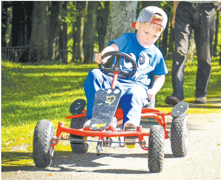
Jaunākajai paaudzei parkā bija iespēja gan izbraukt ar transportlīdzekļiem, ponijiem un zirgiem, gan arī piedalīties piepūšamajās atrakcijās.

tuvākām un tālākām vietām, kuri ar īpašu apbrīnu apskatīja pagastu darinātos ziedu standus, iegādājās labumus tirdziņā, fotografējās un līdzdarbojās piedāvātajās izklaidēs. Visas dienas garumā bija jūtama svētku atmosfēra, liksmība, cilvēku prieka un gandarījuma sajūta. Iespējams, to pastiprināja arī ilgi gaidītie saules stari, siltums un gaismas.