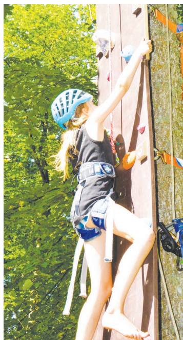
Desmit metrus augsto šķēršļu sienu centās pievarēt gan lieli, gan mazi.