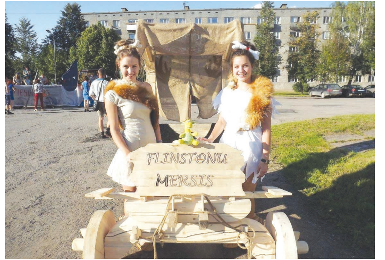
„Flinstonu mersis” no Briežuciema braucamrīku parādē tika atzīts par labāko, iegūstot pirmo vietu un vērtīgu naudas balvu.