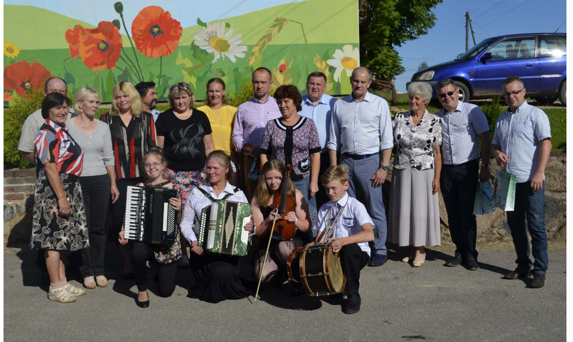
Žukovas vadība kopā ar domes priekšsēdētāju un atrakvīvajiem Briežuciema ļaudīm kultūras nama pagalmā.

Jāatzīmē, ka šajās dienās notika 17. Balvu Kamermūzikas festivāls. Uz diviem koncertiem devās arī Žukovas pārstāvji, kuri bija sajūsmā par koncertu apmeklētību un mūzikas priekšnesumu augsto kvalitāti.