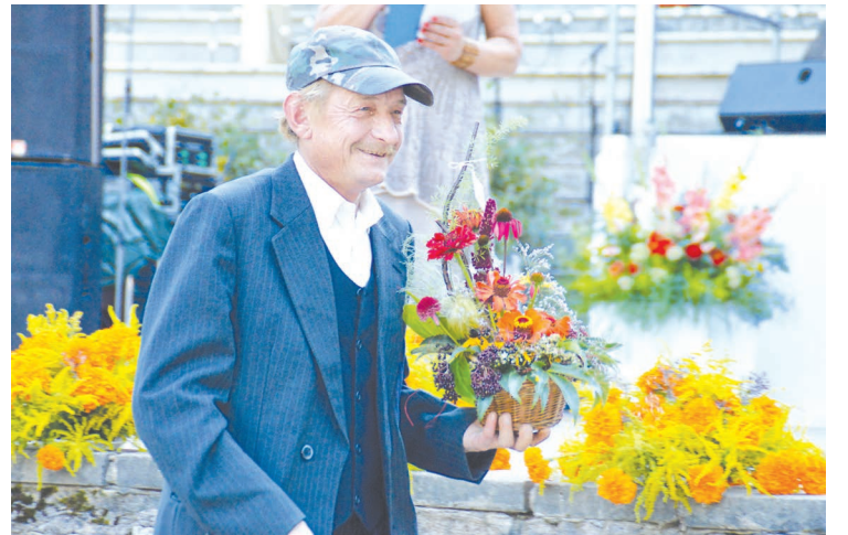
Ziedu kompozīciju izsolē tika iegādātas lielākas un mazākas kompozīcijas.