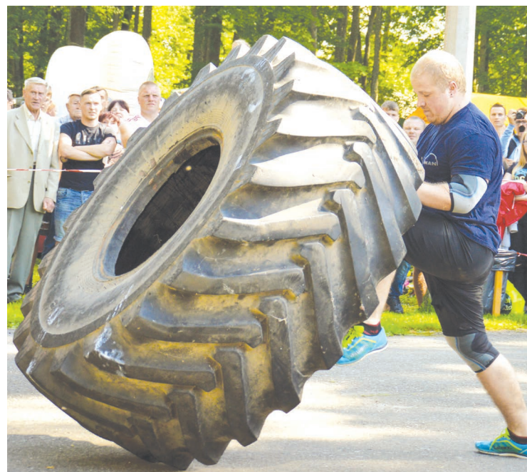
Spēkavīru paraugdemonstrējumi piesaistīja daudzus skatītājus, arī tādēļ, ka tajos piedalījās vietējie iedzīvotāji.