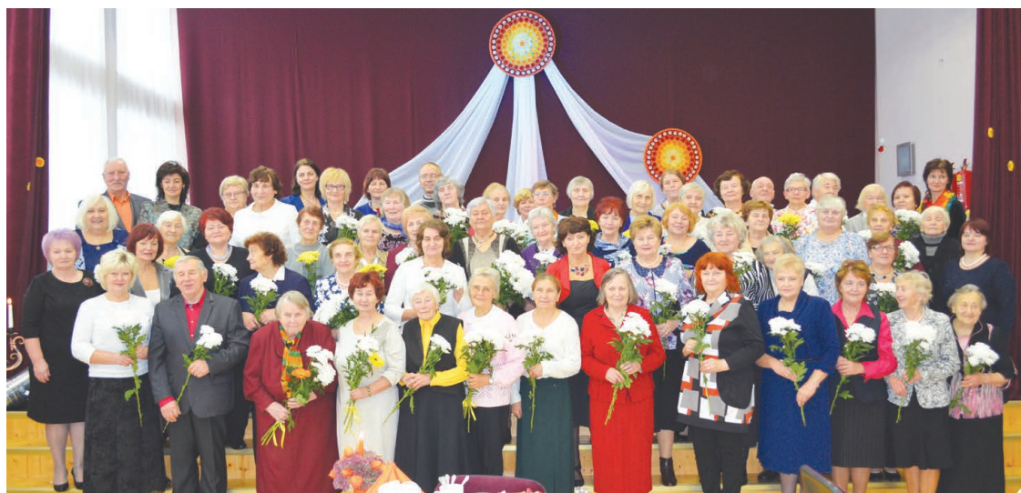
Balvu novada izglītības iestāžu pensionētie skolotāji.

gogus priecēja Balvu pamatskolas sarūpētie priekšnesumi – mūzika, dziesmas un dejas, kā arī skolu direktoru un kolēģu sarūpētie ziedi.