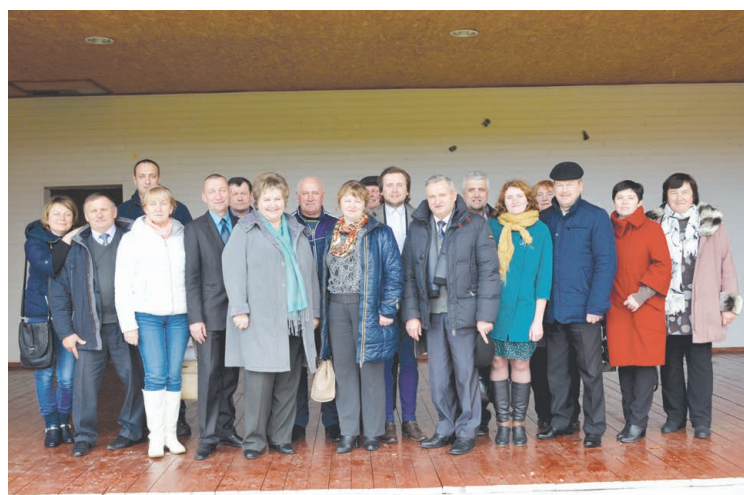
Dokšicas rajona delegācija kopā ar Balvu novada pašvaldības pārstāvjiem.

Svarīgākais tikšanās jautājums bija pārrobežu programmas Latvija - Lietuva - Baltkrievija iespējamā projekta idejas un realizācijas iespējas.