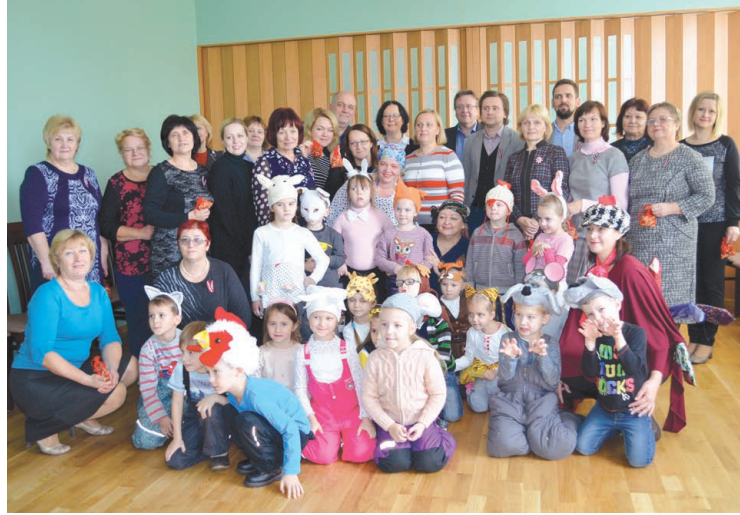
Balvu novada pašvaldības administrācijas darbinieki kopā ar PII „Pīlādzītis” bērniem.

tiek svinēta novembra vidū. Paldies mazajiem Mārtiņbērniem par patīkamo pārsteigumu un jautrajām izdarībām.