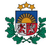
Lauku atbalsta dienests