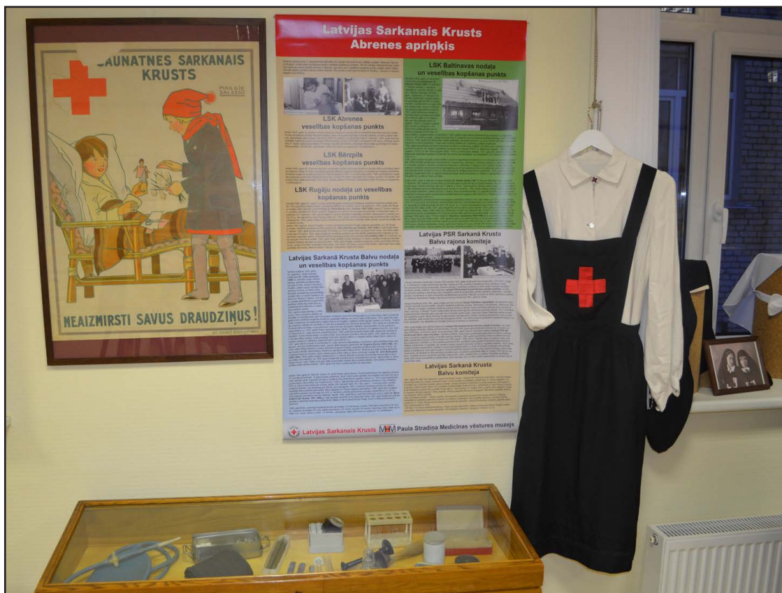
Izstādē apskatāmi gan dažādi medicīnas instrumenti, gan apģērbi, gan arī lasāma informācija par LSK darbību.

Savukārt LSK ģenerālsēkretārs Uldis Likops uzsvēra, ka šī ir pirmā reize 100 gados, kad Balvos notiek šāda izstāde, kā arī atklāja dažādus