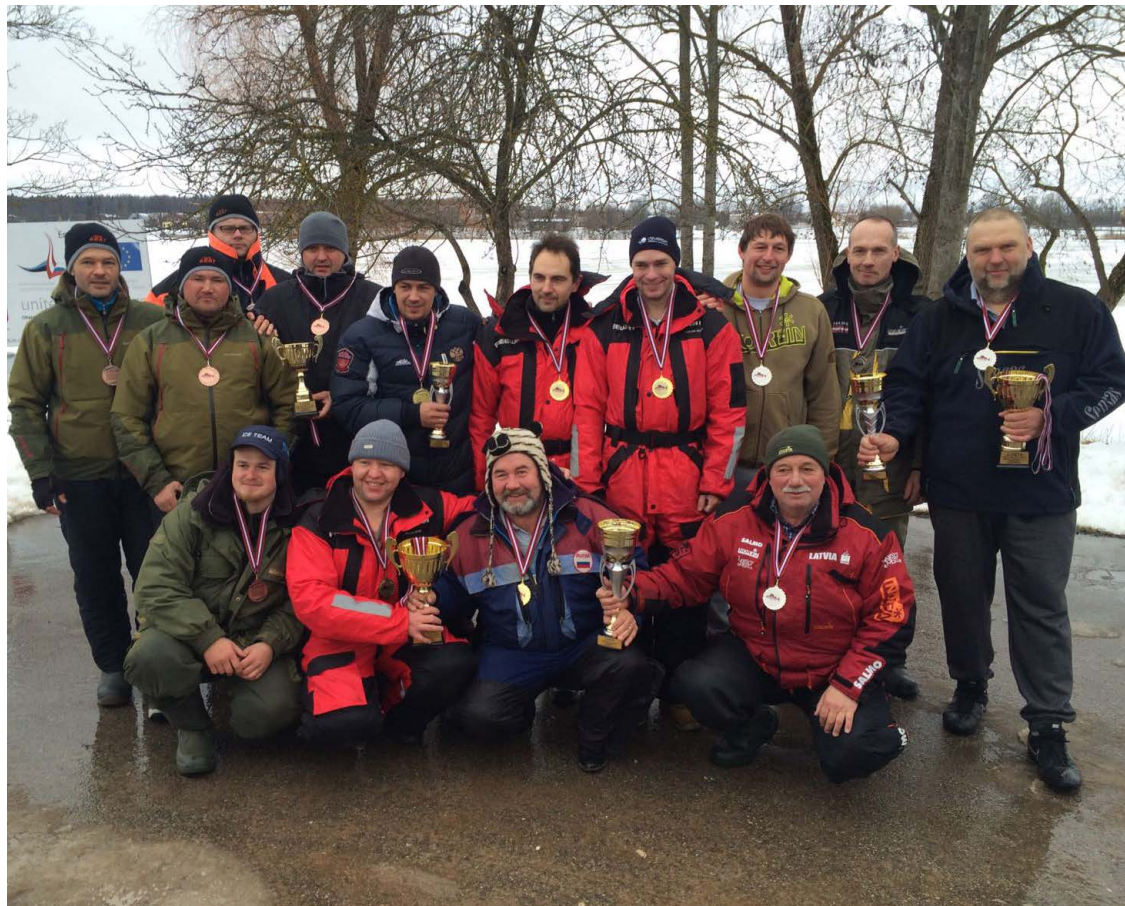
Latvijas čempionāta zemledus maksšķerēšanā 1.posma uzvarētāju komandas.

Čempionāts notiek trīs posmos. Paredzēts, ka nākošais posms norisināsies Limbažu Lielēzērā (11. un 12. februārī), bet pēdējais posms Ādažu novada Mazajā Baltezerā (11. un 12.martā).