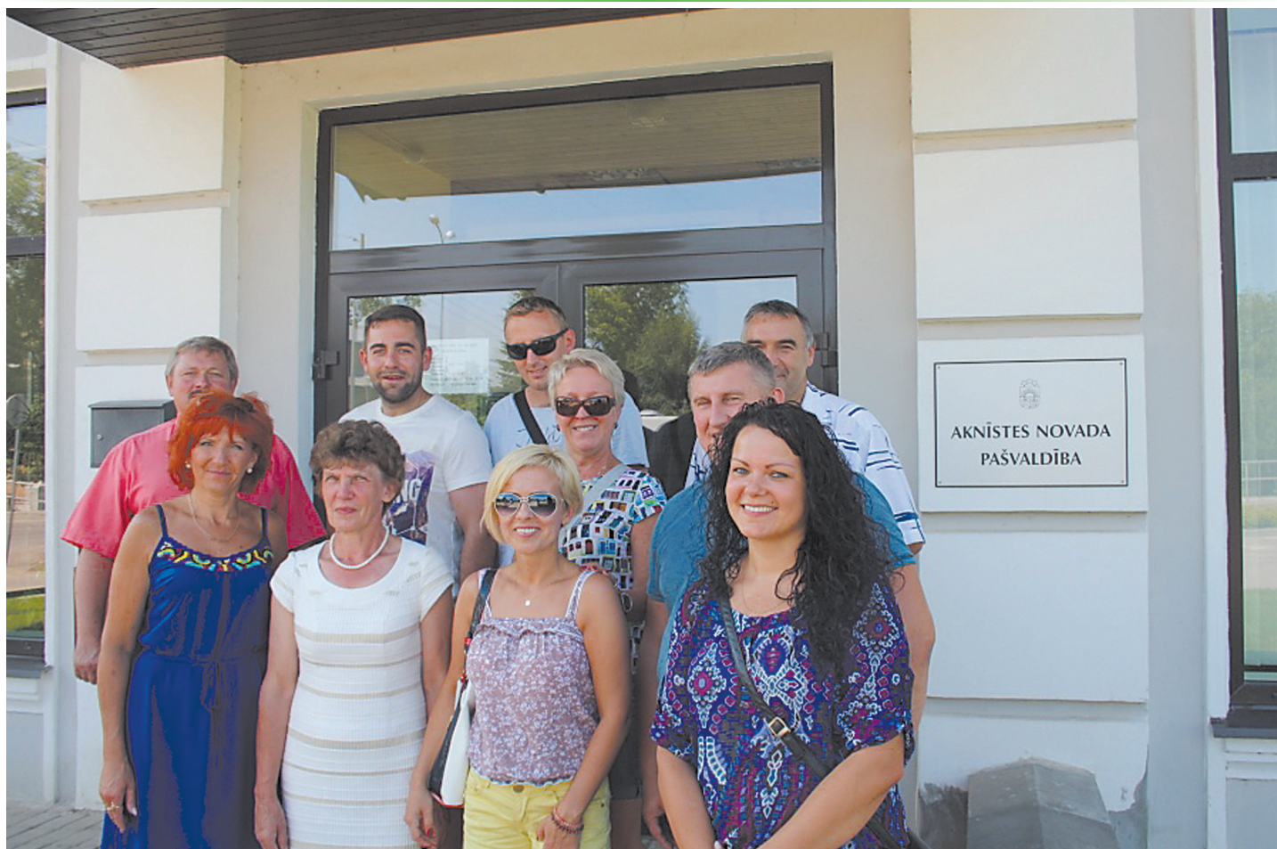
No 6. līdz 9. augustam Aknīstes novada pašvaldībā viesojās Bialogardas(Polija) deputāti un administrācijas pārstāvji, lai pārrunātu turpmākās sadarbības iespējas.