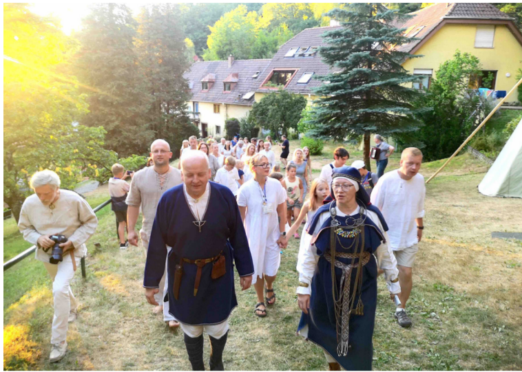
3x3 Bērzainē, Vācijā