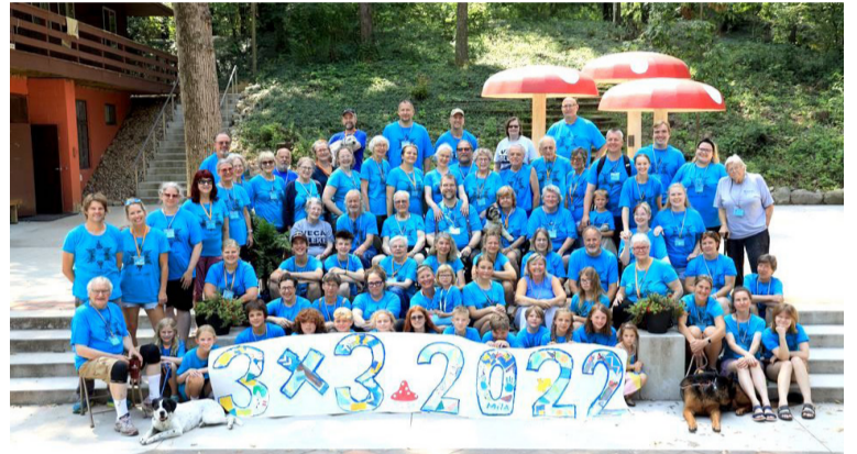
3x3 Gaņezērā