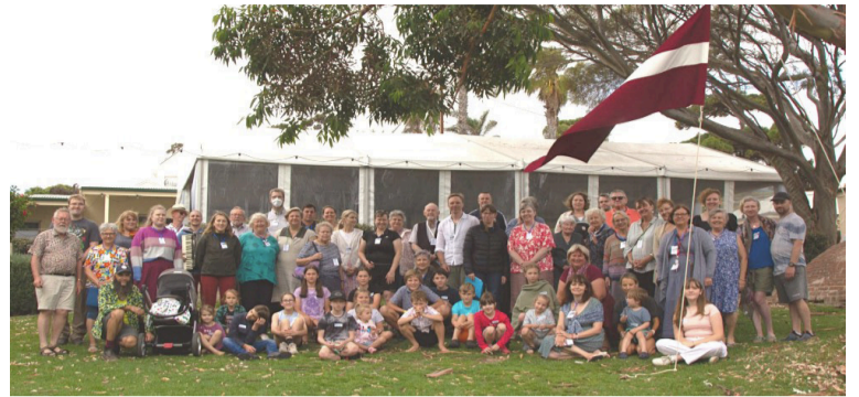
3x3 Austrālijā