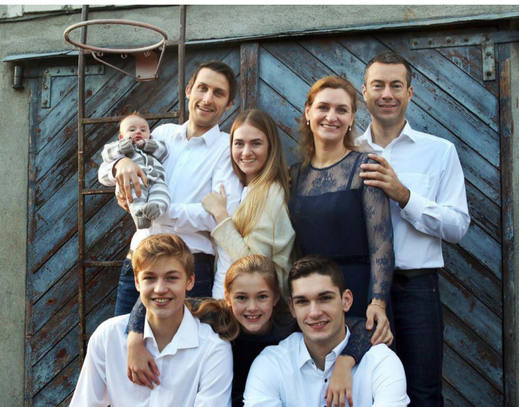
Preiļu saieta vadītāji: Cepļu ģimene