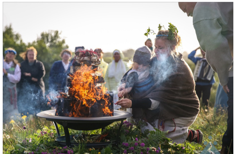
3x3 Īrijā