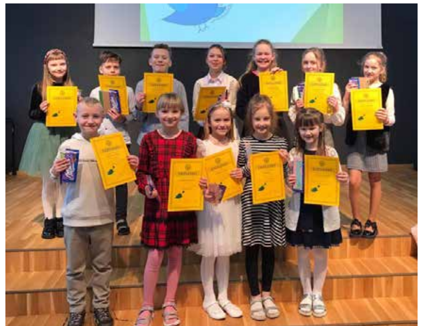
Skatuves runas konkursā Zvirbulis – dalībnieki no V.Plūdoņa Kuldīgas vidusskolas.