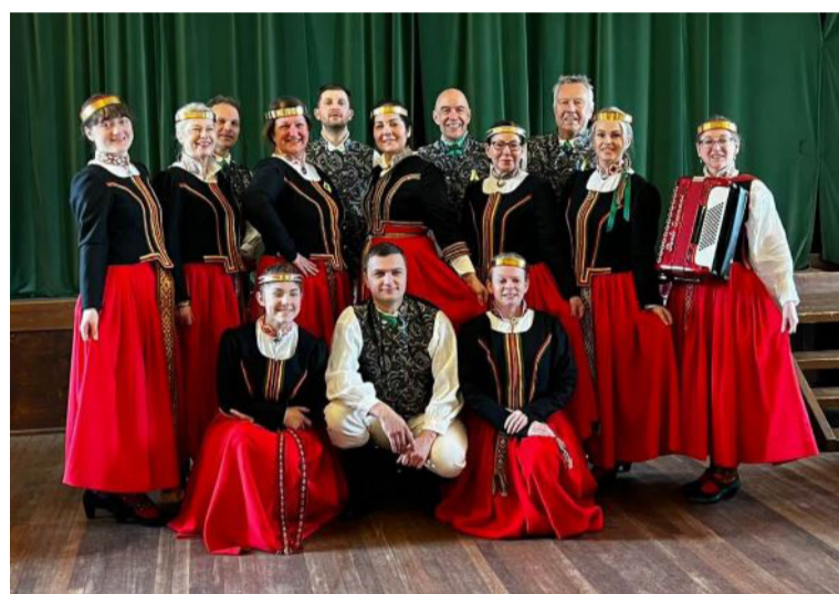
Deju kopa "Kamoliņš"

loras kopa "Dūdalnieki" saka paldies visiem, kas piedalās, iesaistās un atbalsta, tādējādi ve-