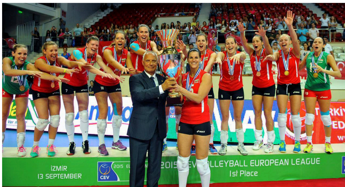
Uzvarētāju kausu pasniegšana viceprezidentam ir gandrīz vai ikdienas darbs. Šoreiz Eiropas līgas uzvarētājam – Ungārijas izlasei.