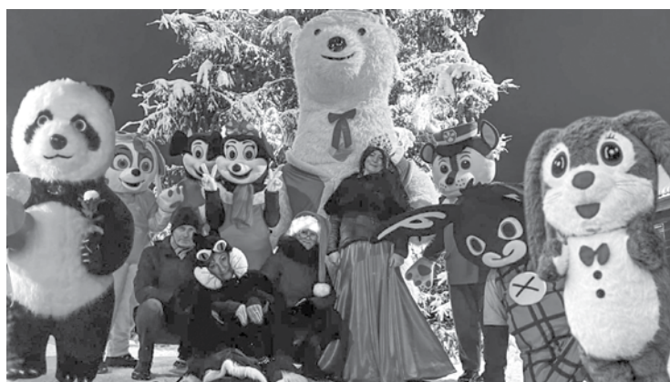
Šobrīd animatoru studijā ir 10 tērpi. Labdarības akcijā pie Kuldīgas Ziemassvētku egles pērn iesaistījušies arī vairāki cilvēki no malas.

Studija darbību sākus ar diviem tērpiem – klauna un raganas. Pārējie atrasti internetā: „Meklējam arī ārpus Latvijas robežām. Vienu brīdī lielāka izvēle bija tērpiem no Krievijas, tagad tos vairs pasūtīt nevaram. Bie-