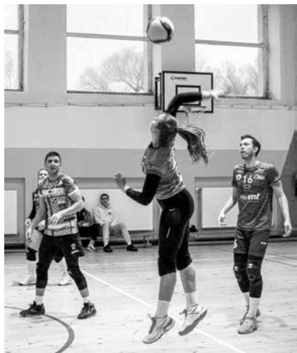
Mirkļis no spēlēm.