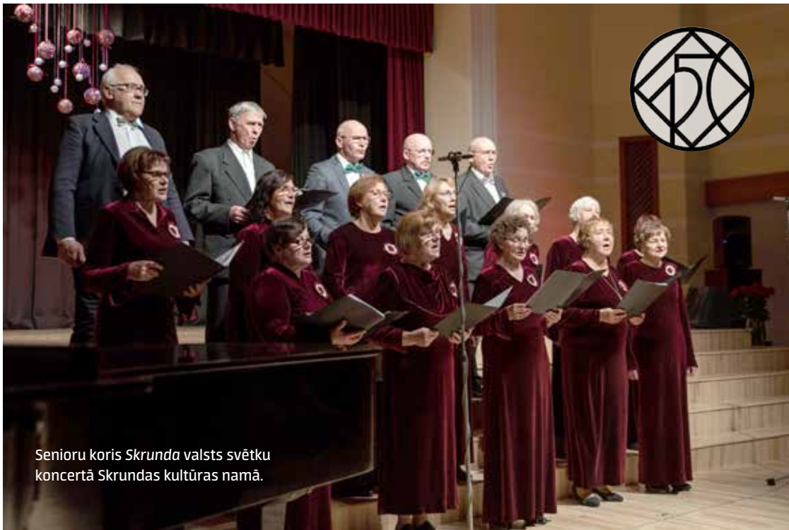
Senioru koris Skrunda valsts svētku koncertā Skrundas kultūras namā.