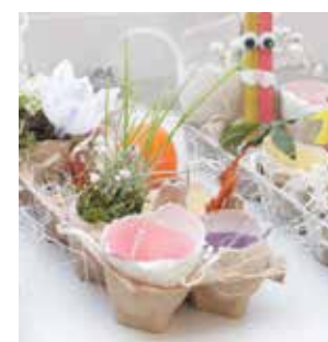
Bērnu izveidotās Lieldienu dekorācijas.

Amanda Gustovska Jēkaba Aleksandra Krūmiņa foto