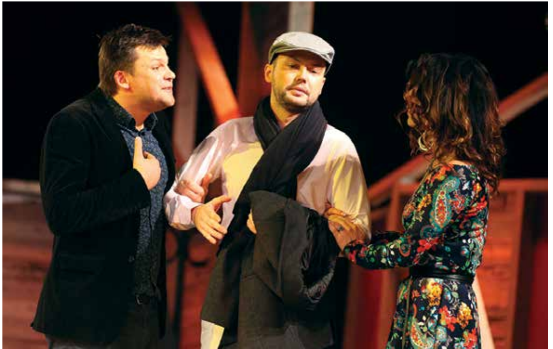
2. aprīlī pulksten 18 Jelgavas kultūras namā skatītāji aicināti uz Ādolfa Alunāna Jelgavas teātra izrādi «Pidžama sešiem».

Šajā nedēļā kultūras nama 1. stāva galerijā iekārtota Teātra dienas veļamā izstāde «Teātris Jelgavā šodien...», kurā var apskatīt dažādu iestudējumu rekvizītus un fotogrāfijās iemūžinātus mirklus no izrādēm.