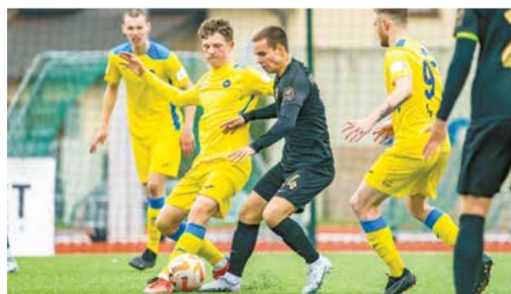
"Super Nova" tiekas ar "Valmieras FC".

8. maijā plkst. 17.30 spēle notiks Valmierā, tiekoties ar "Valmieras FC", bet 14. maijā plkst. 16.00 - Salaspils stadionā, tiekoties ar BFC "Daugavpils". 18. maijā plkst. 17.00 Salaspils stadionā mūsējiem spēle ar "FS Jelgava", bet 23. maijā plkst. 18.00 - ar FK "Metta" Rīgas Hanzas vidusskolas stadionā. 27. maijā plkst. 14.00 spēle Tukumā, tikoties ar "FK Tukums 2000/Telms", bet 31. maijā plkst. 20.00 - Rīgā, spēkiem mērojoties ar "Rīga FC".