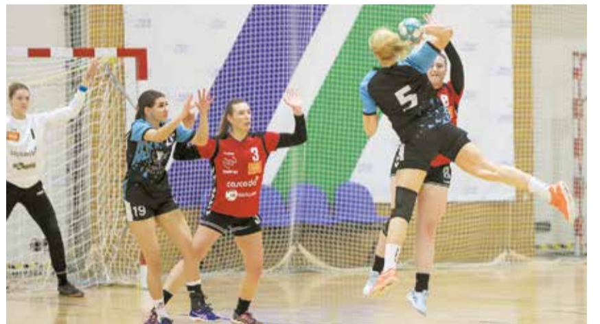
Salaspils sieviešu Virslīgas komanda spēlē pret "Stopiņu PHK".

viņām iespēju izdarīt pārāk daudz vieglu metienu. Kopumā aizvadījām sliktu spēli, līdz ar to arī rezultāts likumsakarīgs. Šis bija labs pārbaudījums, lai spētu saprast Latvijas un Lietuvas sieviešu komandu meistarības līmeņa atšķirību. Cerams, ka šī spēle mums dos pareizo mācību un mēs spēsim izdarīt attiecīgus secinājumus, lai turpinātu attīstīt sieviešu handbolu Salaspilī. Mums vēl priekšā daudz darba treniņos, kā arī aprīļa beigās paredzētas divas pārbaudes spēles ar Igaunijas komandu un tad jau