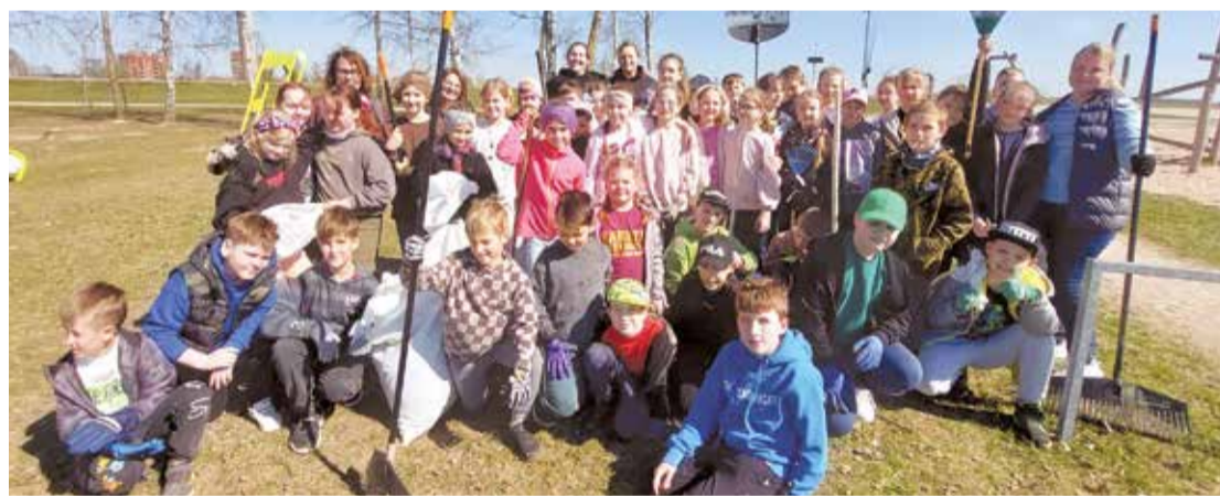
Salaspils 1. vidusskolas 3.a un 3.e klases skolēni talkoja pludmalē.

Īpašs prieks par Salaspils izglītības iestādēm, kuras rosināja pasākumā piedalīties arī bērnus. 20. aprīlī Salaspils pludmalē rosījās skolēni no Salaspils 1. vidusskolas 3.a un 3.e klases kopā ar savu skolotājām. Bērniem bija līdzīti savi grābekļi un čakli tika grābtas pērnā gada lapas, kā arī savākti zari.