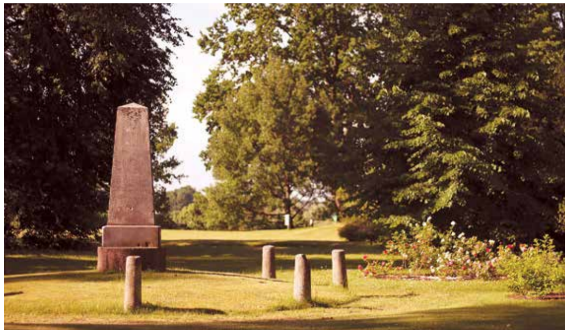
Doles parkā būs iespējams piedalīties dažādās aktivitātēs.