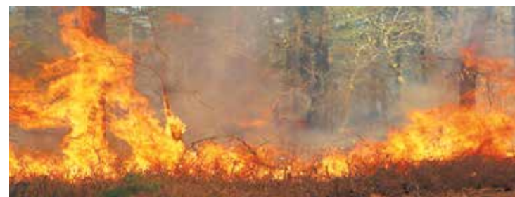
Vasaras periodā tiek izsludināts meža ugunsnedrošais laikposms.

Lai samazinātu meža ugunsgrēka izcelšanās iespējas, visiem iedzīvotājiem, uzturoties mežos un purvos ugunsnedrošajā laikposmā, aizliegts: nomest degošus vai gruzdošus sērkokļus, izsmēķus vai citus priekšmetus, kurināt ugunsiskus, izņemot īpaši ierīkotās vietas, kas nepieļauj uguns izplatīšanos ārpus šīs vietas. Aizliegts atstāt ugunsiskus bez uzraudzības, dedzināt atkritumus, braukt ar mehāniskajiem transportlīdzekļiem pa mežu un purvu ārpus ceļiem vai veikt jebkuru citu darbību, kas var izraisīt