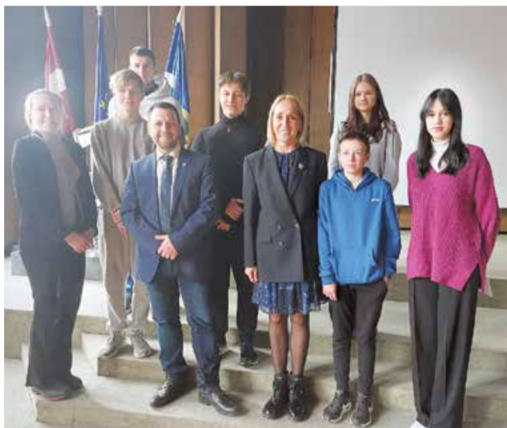
"Ēnu diena" Salaspils novada pašvaldībā.

Karjeras izglītības pasākums "Ēnu diena", kuru tradicionāli rīko "Junior Achievement Latvia", šogad norisinājās 5. aprīlī. Tā ir iespēja skolēniem tuvāk iepazīt iecerētās nākotnes profesijas ikdienu, ēnojot kādu profesijas pārstāvi. "Ēnu diena" norisinājās arī Salaspils novadā.