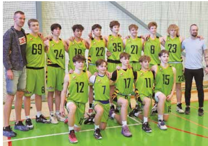
Salaspils U17 sporta skolas komanda pēc iekļūšanas LJBL Superlīgā.

3x3 basketbolā sezona vēl tikai sāk uzņemt apgrīzienus, šogad ir izveidota arī Salaspils 3x3 komanda,