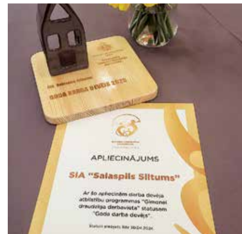
Statusa “Goda darba devējs” apliecinājums.

Šī gada konference “Veidosim ģimenei draudzīgu sabiedrību kopā!” bija veltīta ģimeņu labbūtības veicināšanai valstī. Konferencē pārrunāti temati par ģimenei draudzīgas sabiedrības un darba kultūras veidošanu, darba un ģimenes dzīves savienošanas izaicinājumiem un pašvaldības lomu ģimeniskās vides nodrošināšanā, kā arī par Somijas pieredzi ģimeņu atbalsta jomā. Programmu “Ģimenei