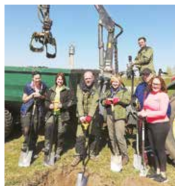
"Komunālā dienesta" darbinieki talkā.

Iedzīvotāji, sakopjot novada teritoriju, aktīvi rosījās arī Avotos, Cekulē, Mežezeros, Lakstīgalās, Mazdārziņos nr. 6 un 7, Salaspils Romas katoļu baznīcas apkārtnē, Vitolu, Līvzemes un Stacijas ielās, Salaspils Veselības centra apkārtnē, Doles salā, dzelzceļa stacijas "Saulkalne" apkārtnē un citur.