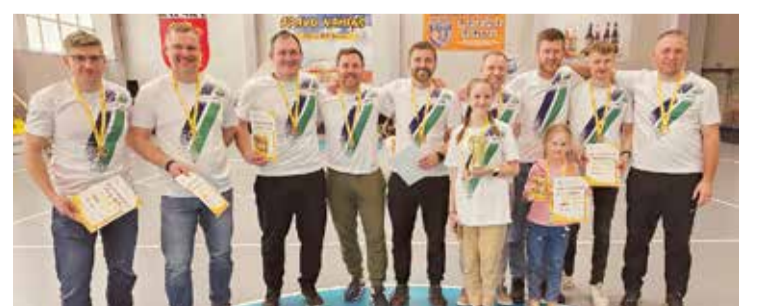
Salaspils novada florbolisti.

Ikviena interesents, kas vēlas piedalīties kādās no citām Latvijas