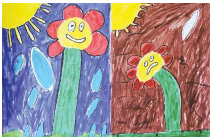
Zīmējuma autors: Salaspils pamatskolas 2.d klases skolnieks Romans, pedagoģe – I. Dūmiņa.

Godalgas šajā konkursā saņēma: Salaspils pamatskolas 2. d klases skolnieks Matvejs (pedagoģe I. Dūmiņa), Salaspils pamatskolas 2. d klases skolnieks Romans (pedagoģe I. Dūmiņa), Salaspils 1. vidusskolas 3. d klases skolniece Marta (pedagoģe I. Veinšteina) un Salaspils 1. vidusskolas 4. b klases skolnieks Ralfs (pedagoģes I. Čevēlova un A. Terehova). Aktīvākā klase, kura iesū-