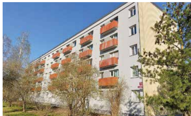
Renovētā ēka Rīgas ielā 12.

Pamatojoties uz Salaspils novada domes saistošajiem noteikumiem "Par Salaspils novada pašvaldības palīdzības piešķiršanas kārtību energoefektivitātes paaugstināšanas pasākumu veikšanai daudzdzīvokļu dzīvojamās mājās," kas paredz noteikta apmēra līdzfinansējuma piešķiršanu, pašvaldība veikusi SIA "Namu pārvaldīšana" iesniegtā pieteikuma atbilstības izvērtējumu līdzfinansējuma saņemšanai namam Rīgas ielā 12.