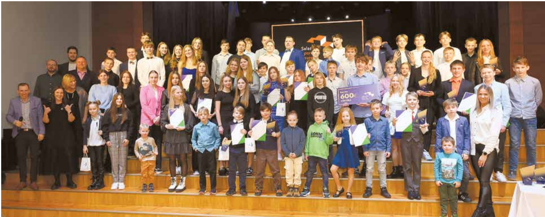
Salaspils novada jaunākie sportisti, kuri tika sveikti svinīgā ceremonijā.