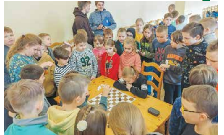
Dambretes turnīrs 1.- 4.klašu skolēniem.

Jaunie sacensību dalībnieki varēja redzēt, ka augstvērtīgi rezultāti ir