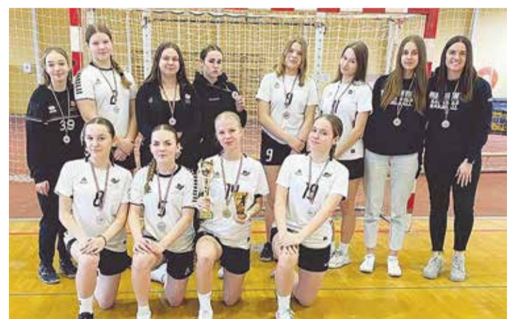
"Salaspils SS" U 16 handbolistes.