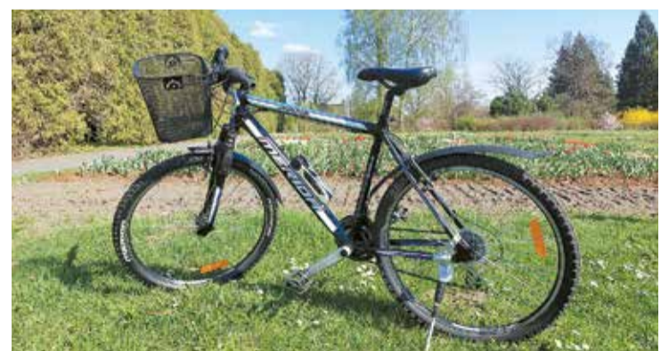
Braucot ar velosipēdu, iespējams aplūkot krāšņākās pilsētas vietas.

Kopā noma pieejama 7 velosipēdi: trīs vīriešu, divi sieviešu, kā arī divi bērnu velosipēdi. Braucēju ērtībām divi pieaugušo velosipēdi ir aprīkoti ar groziem, kuros ērti var novietot somas un personīgās mantas. Tāpat pieejams arī bērnu krēs-