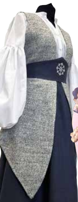
Daļa no tērpiem Brocēnu jauniešu korim Sonate .