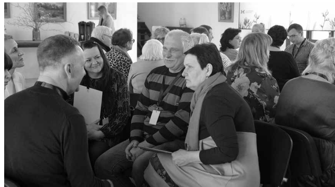
Forumā 5 malki svaiga gaisa piedalījās negaidīti daudz tūrisma speciālistu, uzņēmēju un entuziastu. Pēc nejaušības principa izveidotās grupās tika rosinātas idejas vienotam mārketinga plānam.

saimniecībām. Kulinārajā tūrismā ir jaunas ieceres – jau jūnijā sadarbībā ar vietējiem ēdinātājiem tiks atklāta vasaras kokteiļu maršrutu karte, kas iepazīstinās ar restorānu dzērienu klāstu.