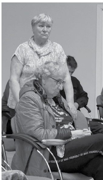
Valērija Vasečko jautā, kas notiks ar šī brīža bērnu dārza ēku.