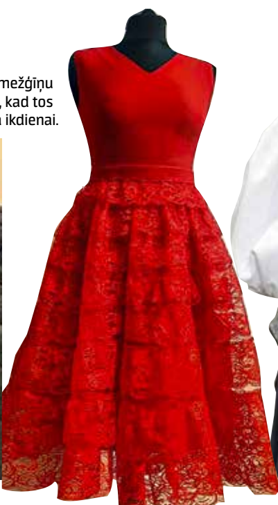
Sarkans komplekts: ar mežģīņu svārciņiem – svētkiem, bet, kad tos noņem, paliek koša kleita ikdienai.