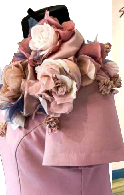
Dekoratīva ziedu piespraude vedējmātes tērpiem – tas meistarei bijis pārbaudījums.