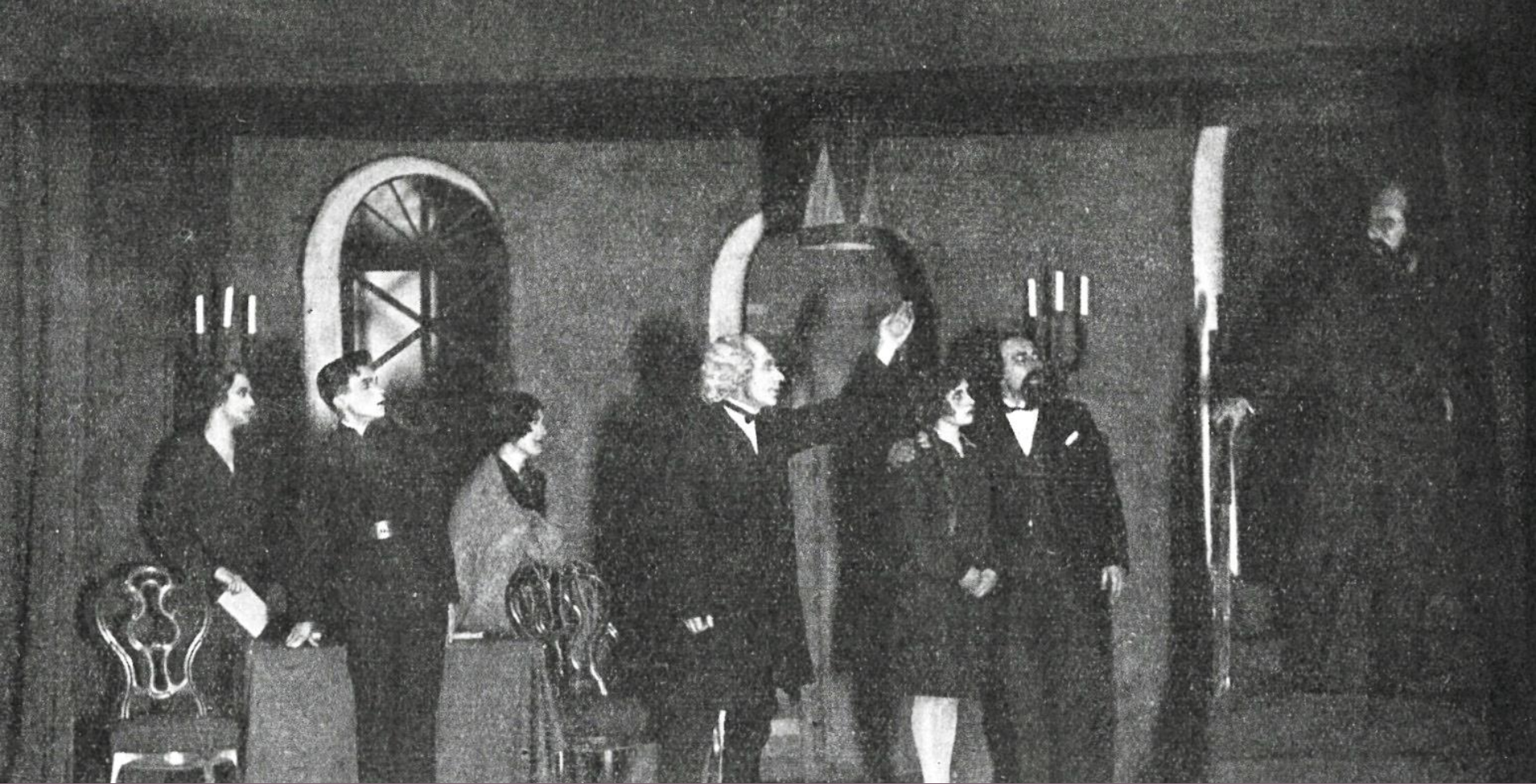
Limbažu teātris. R. Valtera «Torņi». Ilustrēts Žurnāls , Nr.12 (1928)