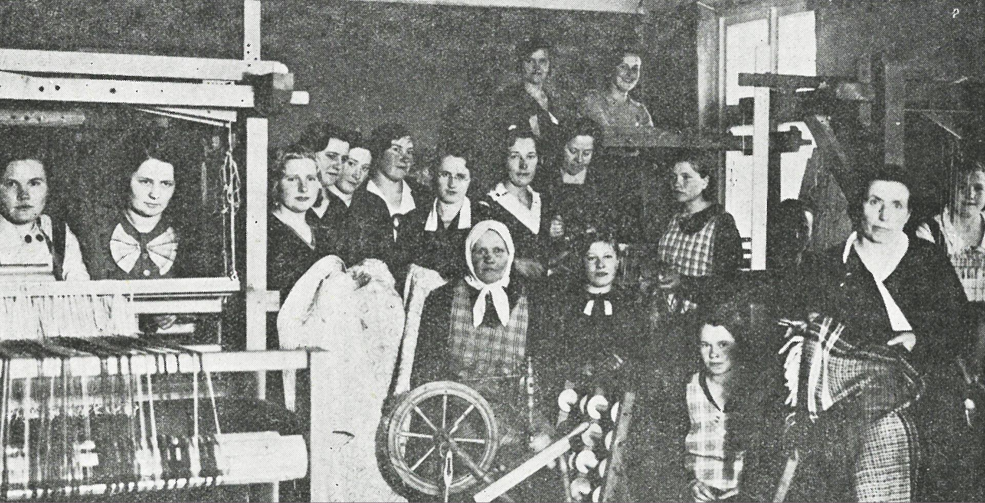
Limbažu papildu skolas aušanas nodaļas audzēknes. Zeltene , Nr.12 (1935)