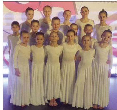
■ Līvānu deju studija “Diamond” starptautiskajā deju konkursā “Europestage”

Novēlam visai deju studijai “Diamond” veiksmi, izturību, pārsteigumu un panākumiem bagātu šo sezonu!