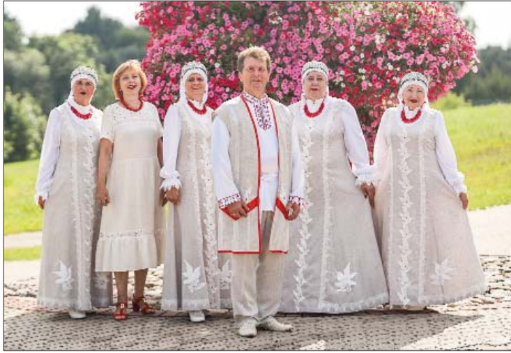
■ Līvānu novada Kultūras centra Slāvu kultūru vokālais ansamblis "Razdolje"

Sagatavoja: Ašots Mamikonjans, Līvānu novada Kultūras centra Slāvu kultūru vokālā ansamblja "Razdolje" pārstāvis