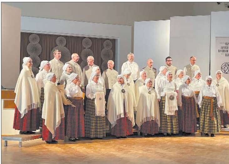
■ Jersikas tautas nama senioru jauktais koris "Jersika"

Paldies visiem koristiem par izturību repertuāra sagatavošanas procesā! Paldies dirigētēm un kormeistarēm par degsmi un koru skanīgu kopbalsi!