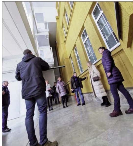
■ Līvānu novada pašvaldības Plānošanas un attīstības nodaļas darbinieki pieredzes apmaiņas braucienā

Paldies Smiltenes novada pašvaldībai par viesmīlīgo uzņemšanu, un dalīšanos pieredzē ar veiksmīgo Eiropas finansējuma piesaistes iespējām un viņu redzējumu veiksmīgam komandas darbam.