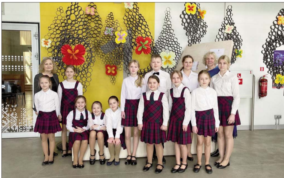
■ Līvānu Bērnu un jauniešu centra vokālā studija “Spurgaliņas”

Folkloras dienas bērnu un jauniešu koncertā “Liepa auga ar ozolu” pieteica sevi video skatē. Līvānu 1. vidusskolas un Līvānu BJC folkloras kopa “Ceiruleits” (jaunākā grupa) piedāvāja programmu “Ganu spēles”, balstītu uz lokālo materiālu, vietējo teicēju ganu stāstiem. Programmā vērojama folkloras žanru dažādība, vienojošs stāstījums, ko atzīnīgi novērtēja žūrija. Koncertā piedalīsies 15 bērnu un jauniešu folkloras kopas no visas Latvijas, un starp tām 30 Līvānu novada bērni no “Ceiruleiša”.