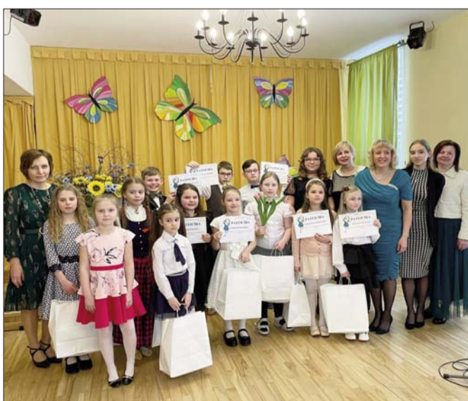
■ Konkursa “Jaunie solisti” dalībnieki kopā ar pedagogiem