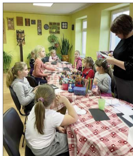
■ Mākslas terapijas nodarbība