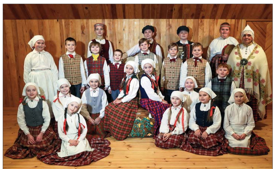
■ Bērnu un jauniešu centra un Līvānu 1. vidusskolas folkloras kopa “Ceiruleits”