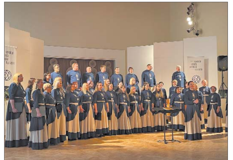
■ Līvānu novada Kultūras centra jauktais koris "Rubus"