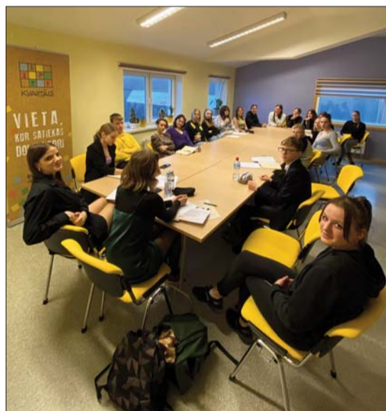
■ Līvānu novada Jauniešu domes atklātā sēde