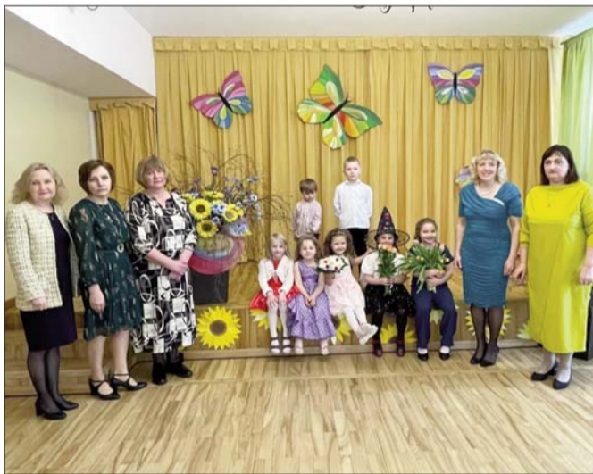
■ Konkursa “Mazputniņš” dalībnieki kopā ar pedagogiem

Paldies skolotājiem par ieguldīto darbu! Paldies jaunajiem un talantīgajiem solistiem par pavasara ieskandināšanu! Uz tikšanos nākošgad!