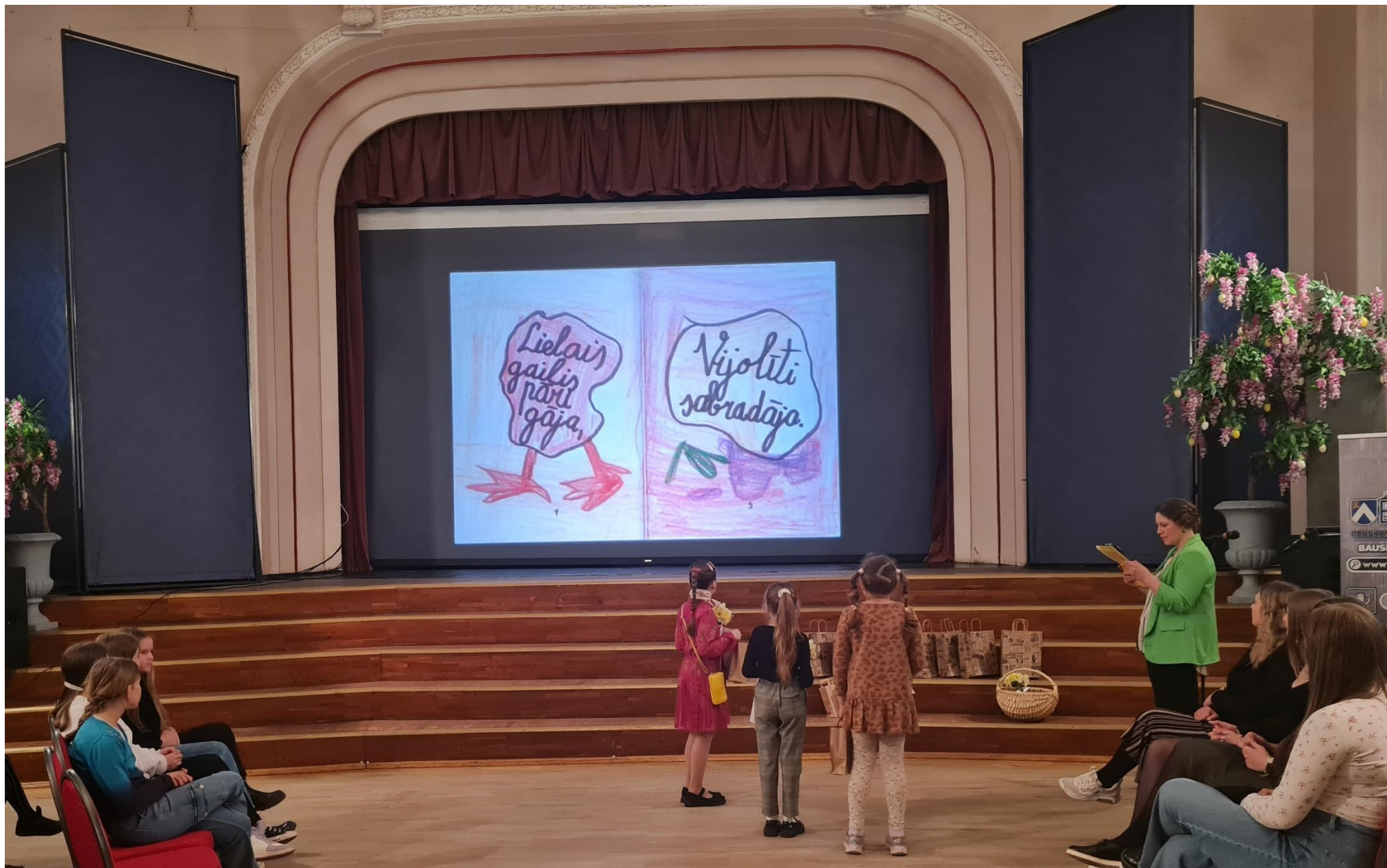
Īsgrāmatiņu konkurss bērniem un jauniešiem «Es kā Jesens»