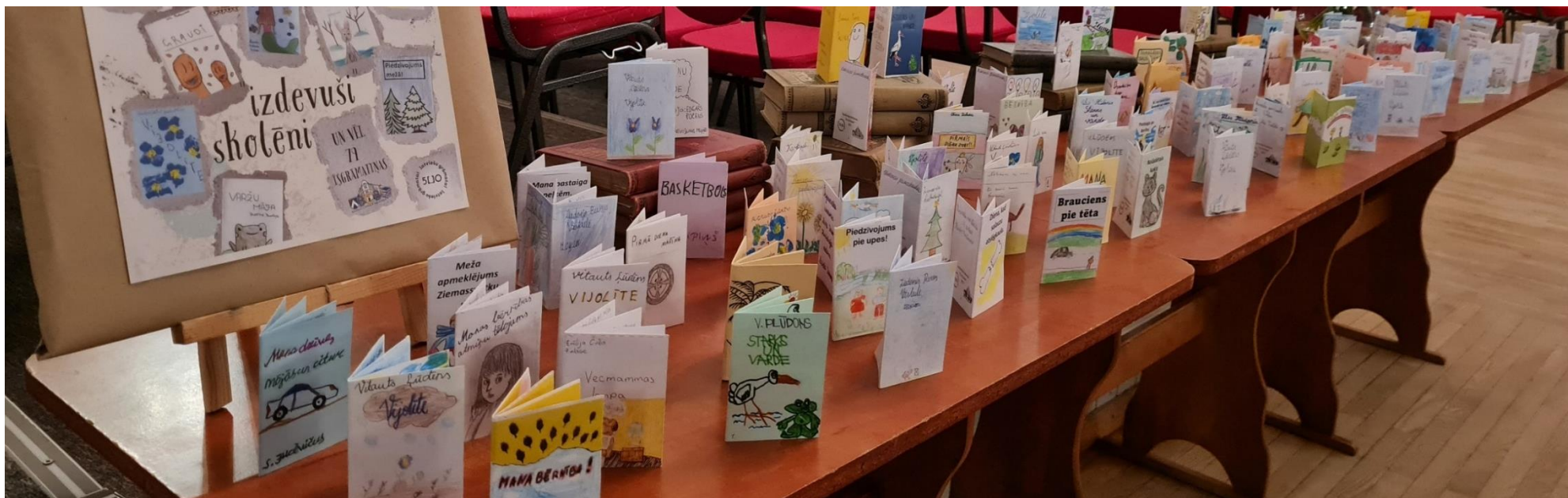
Īsgrāmatiņu konkurss bērniem un jauniešiem «Es kā Jesens»