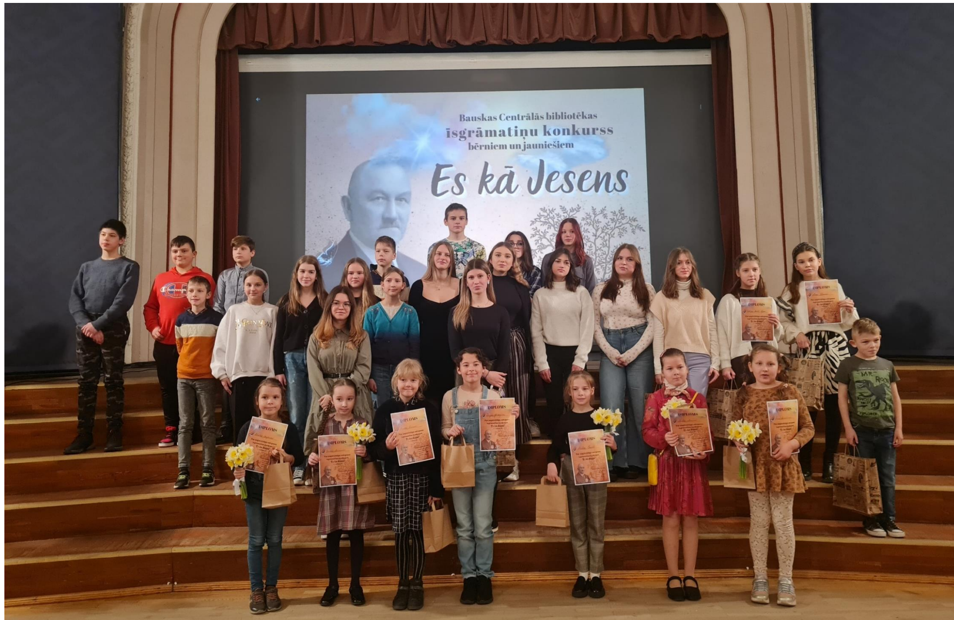
Īsgrāmatiņu konkurss bērniem un jauniešiem «Es kā Jesens»