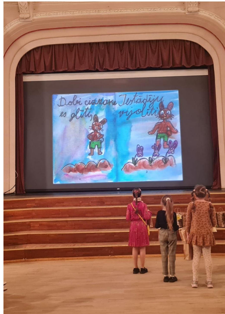
Īsgrāmatīņu konkurss bērniem un jauniešiem «Es kā Jesens»