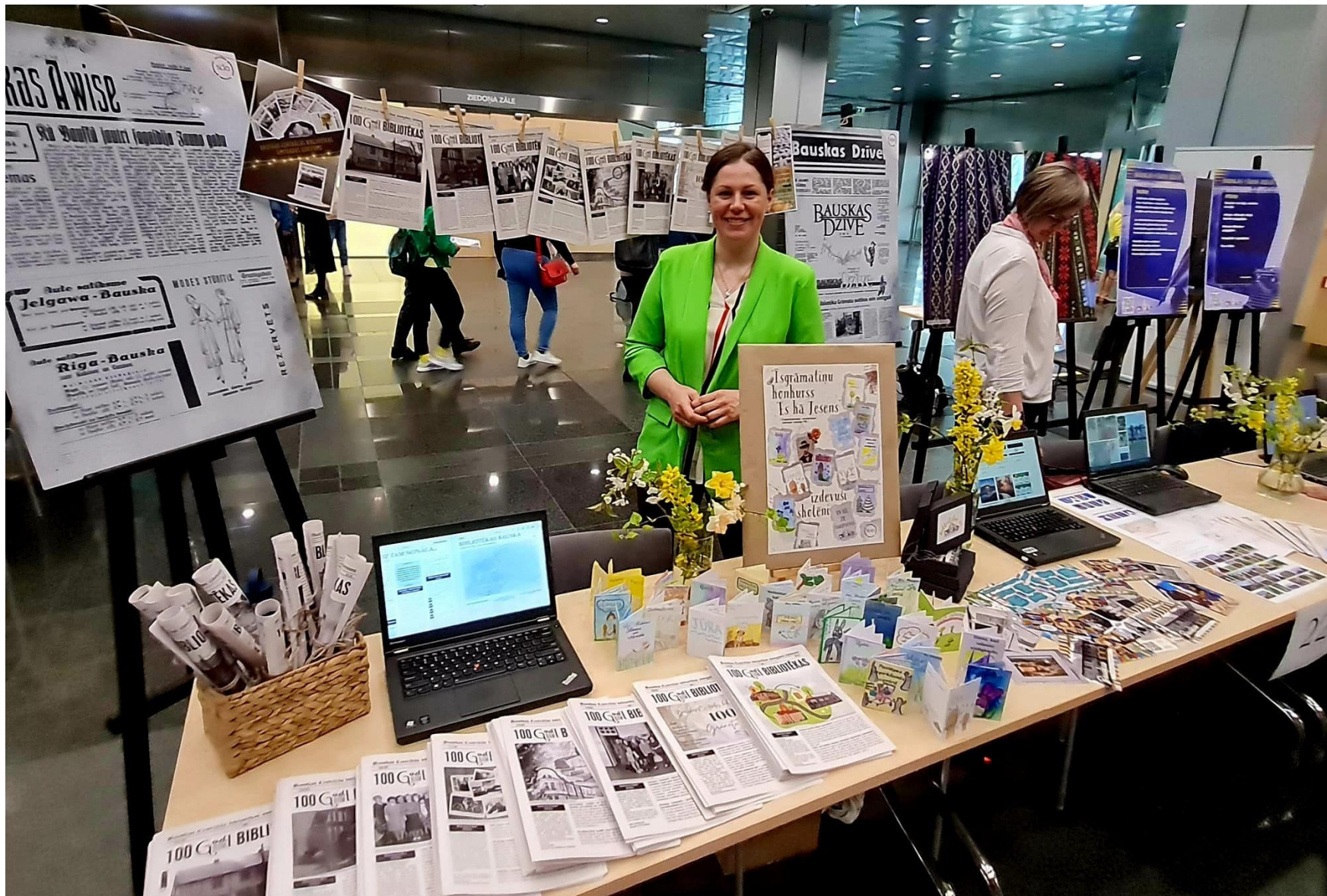
Īsgrāmatiņas un «100 gadi / gramī bibliotēkas» LBB Ideju tirgū. Fonā divas planšetes no izstādes «Laikraksti Bauskā» (2022. gada veikums «Latviešu Grāmatai» 500 ietvaros)