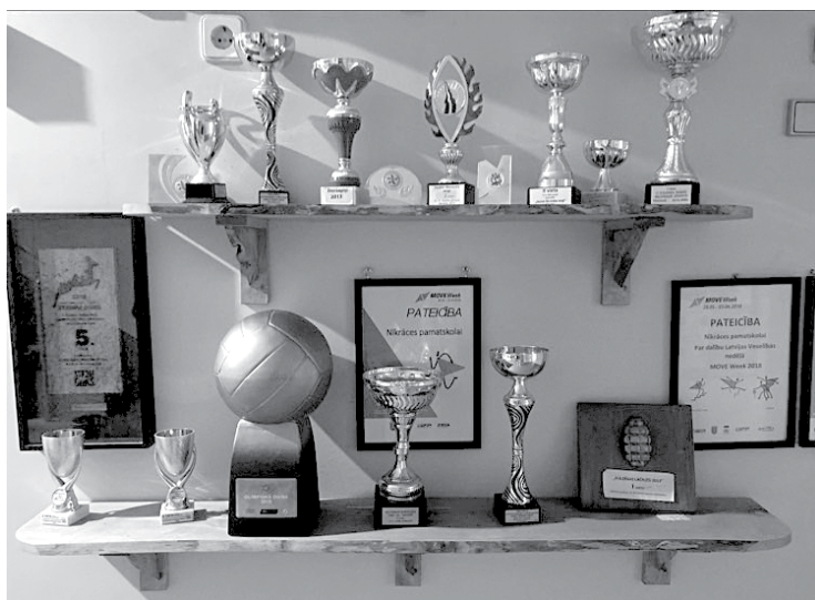
Skolas gaiteni var apskatīt dažādās sacensībās audzēkņu izcīnītos kausus.

nāt. Mājasdarbi jāpilda arī skolas kolektīvam.”