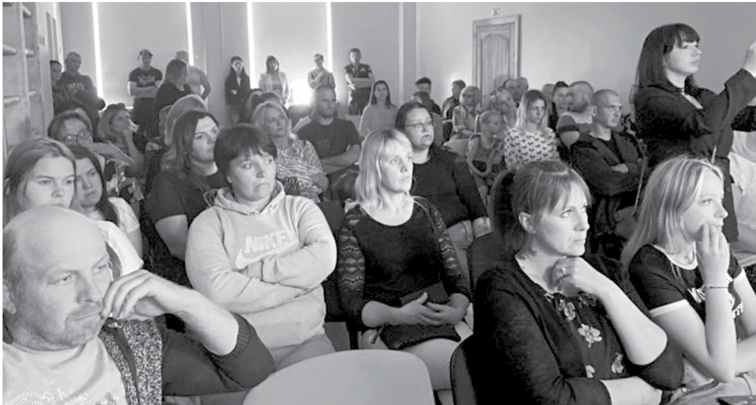
Nīkrāces pamatskolā sanākušie uztraucās, vai tiešām pašvaldība gatavojas mācību iestādi likvidēt.

Kā teica L.Mačtama: „Vienu dienu komisija pavadīja tiešsaistes sarunās ar direktori, skolotājiem, vecākiem, arī ar skolas dibinātāju (pašvaldību). Rezultāti ir gan pozitīvi, gan ne tik labi, un vairākās vietās procentuālais vērtējums rada satraukumu.” Vispirms komisija paskatījās, kas vērtēts iepriekš, un ieteikumi bijuši daudzi. „Ziņojumā redzam, ka skola tos nav izpildījusi vispār, ir paveikusi daļēji vai ne pēc būtības, respektīvi, kārtību izstrādā, bet neizmanto,” paskaidroja L.Mačtama. „Mēs gribam, lai bērni saņemtu labu izglītību, un kopā jāatrod veids, kā to nodroši-