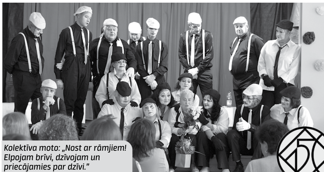
Kolektīva moto: „Nost ar rāmjiem! Elpojam brīvi, dzīvojam un priecājamies par dzīvi.”

Vai kāda izrāde sirdij ir tīkamāka par citām? „Man patika kā manējie spēlēja Aivas Birbeles