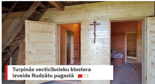
Turpinās vec ticībnieku klostera izveide Rudzātu pagastā 13