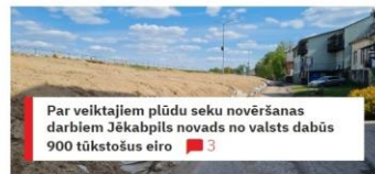
Par veiktajiem plūdu seku novēršanas darbiem Jēkabpils novads no valsts dabūs 900 tūkstošus eiro 3