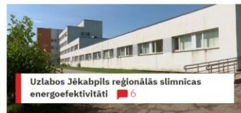
Uzlabos Jēkabpils reģionālās slimnīcas energoefektivitāti 6