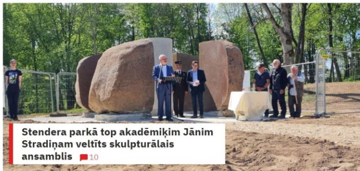
Stendera parkā top akadēmiķim Jānim Stradiņam veltīts skulpturālais ansamblis 10