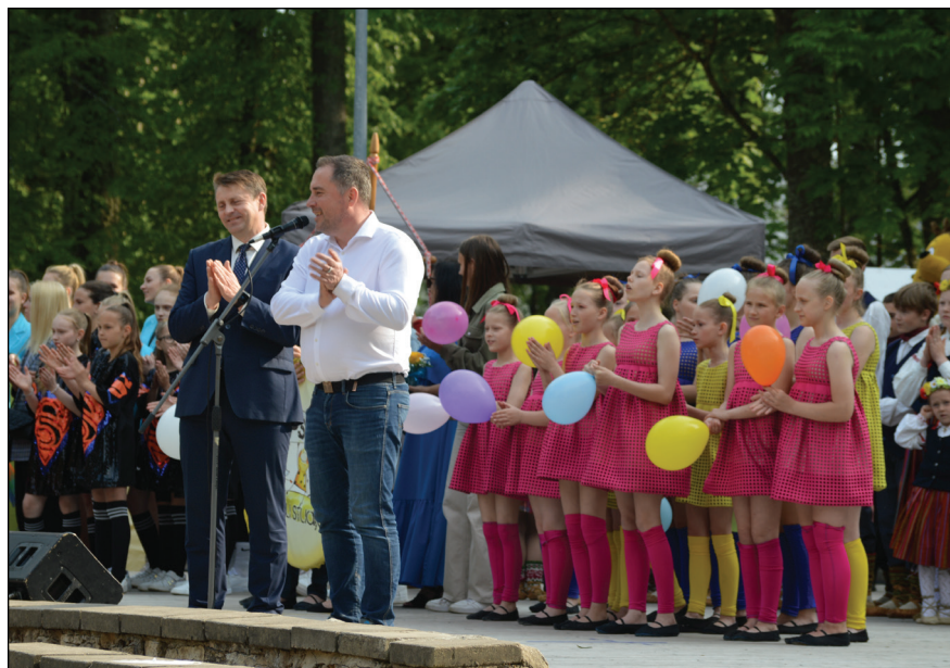
Radošā festivāla dalībniekus un koncerta apmeklētājus sveica arī Latvijas Republikas zemkopības ministrs Didzis Šmits.

Koncertā "Iekrāsojam vasaru!" tikās gandrīz 500 dalībnieki, piepildot Balvu estrādi ne tikai ar dziesmām un deju soļiem, bet arī ar prieku, sajūsmu un lepnumu. Sakām paldies visiem 23 kolektīvu dalībniekiem - četriem koriem un 11 vokālajiem ansambļiem, 13 tautas deju kolektīviem, divām mūsdienu deju studijām ar vairākām deju grupām, četrām folkloras kopām un, protams, brīnišķīgiem kolektīvu vadītājiem!