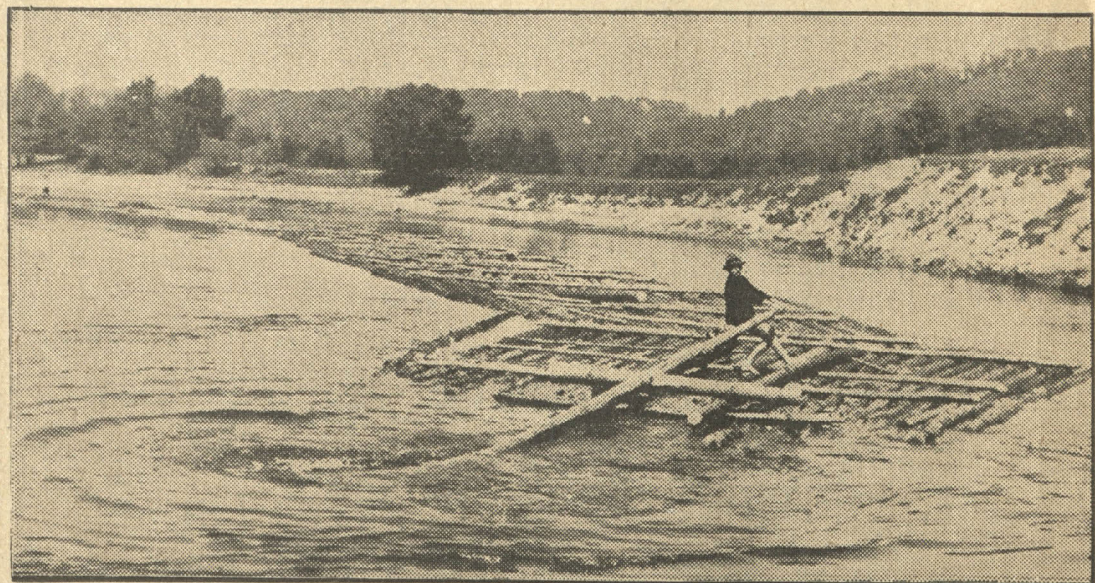
Ik gadus pa Latvijas upēm uz eksporta ostām noplūdina lielus daudzumus koku.