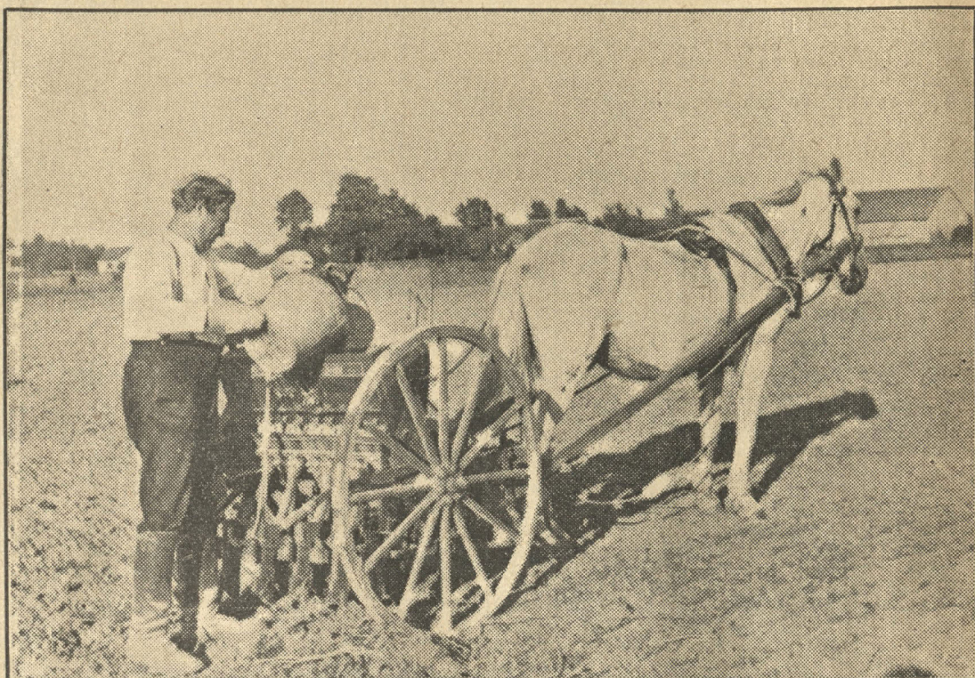
Pavasara sēja sākusies

Mašīnu skaits mūsu laukos stipri audzis. Rindu sējmašīna ir vērtīgs palīgs lauksaimniekam.