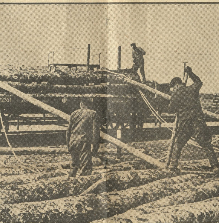
Apvidos, kur nav plostošanai noderīgu ūdens ceļu, meža materiālus transportē pa dzelzceļu.