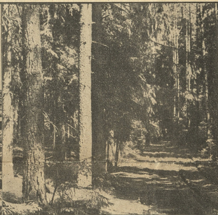
Mežu bagātība. Visā mūsu valstī meži aizņem vairāk par 1,5 milj. ha lielu platību.