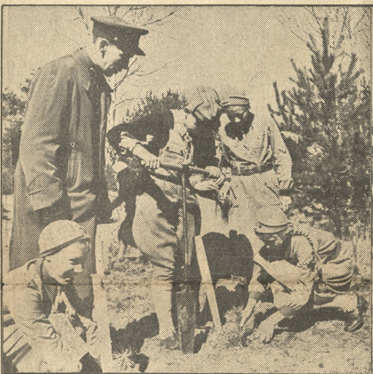
Mazpulku dalībnieki mežziņa vadībā stāda jaunos kociņus.