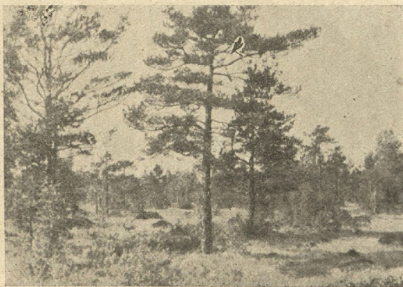
Ne mežs, ne pļava.

Bojātas jaunaudzes jācenšas izlabot. Slapjās meža audzes jānosusina. Mežs nav pļava.