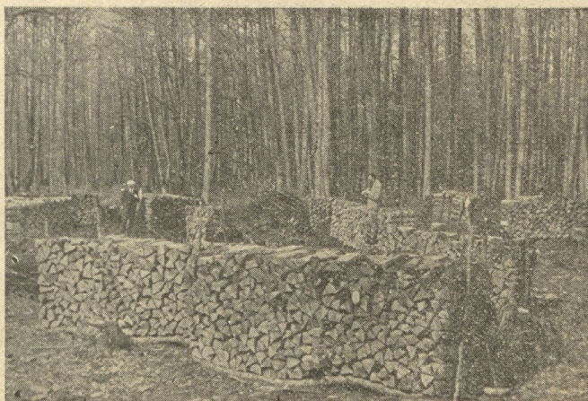
— bet lauksaimnieks tos sagatavo malkā.