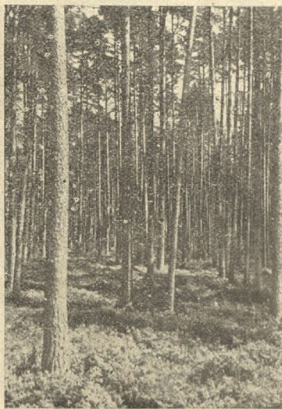
Kopīts mežs saimnieka lepnums.

Meža retināšana jāsāk agri, jāizdara mēreni un bieži jāatkārto.