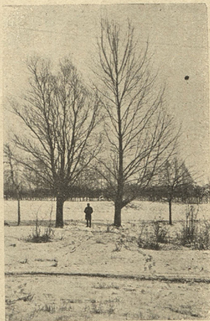
Bērzs, vītols, Kanadas aspe un vīksna 23 g. vecumā.