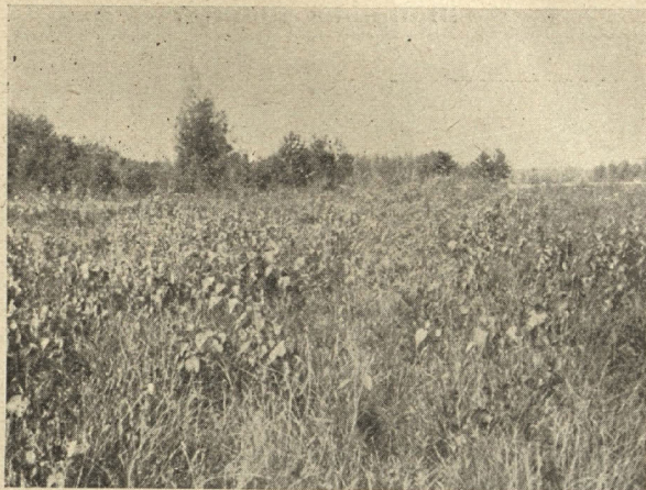
Trīs gadusīgaugi bērziņi.

Kur nevar ierīkot tīrumus, pļavas un ganības, tur jāaudzē mežs.