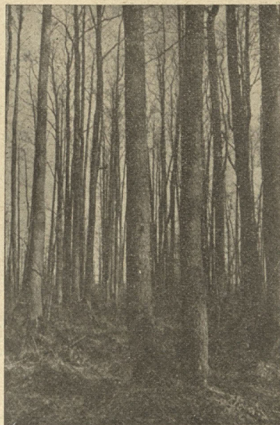
Skaista melnalkšņa finieru audze...