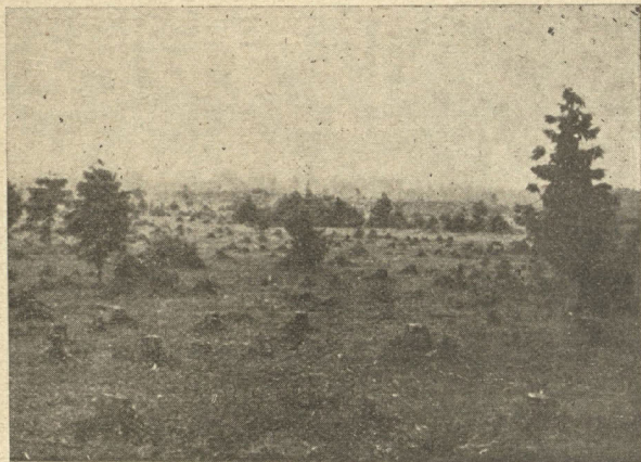
Ne mežs, ne ganiņas.

Jāsaudzē mežmalas. Nedrīkst mežu nocirst vēja pusē. Lopu ganišana mežā jāizbeidz.