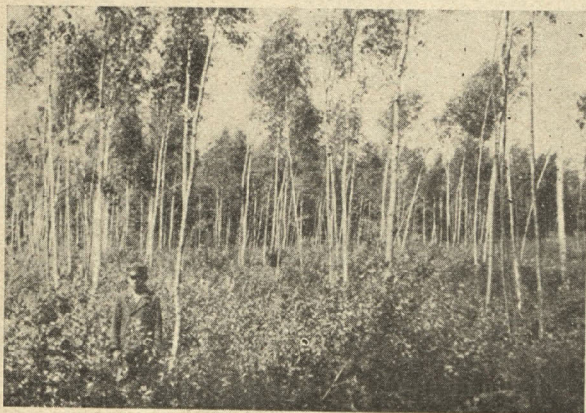
Ražīga baltalkšņu un prasto apšu mistrota audze. Kamēr apses sasmiedz cērtamo vecumu, baltalkšņus nocert vairākas reizes.

Maz mežainos apvidos jāpiegriež vērība ātraudzīgām lapu koku sugām: baltalkšņiem, apsēm, vītoliem.