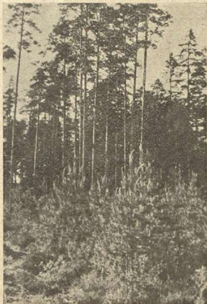
Aizsargātā izcirtumā, veca meža tuvumā rodas spēcīga jaunaudze.

14 Jāveicina dabiskā meža atjaunošanās pareizi cērtot, zemi apstrādājot un apmežojamo platību sargot no mājlopiem.