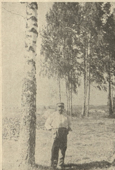
Paša stādīts bērzs.