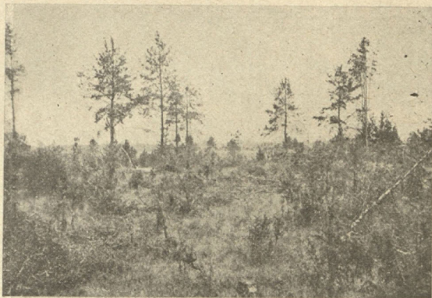
Šādā izcirtumā nevar rastos vērtīgu jaunaudze.

Kārtis, malka, žagari, meijas, zari jaunā mežā jāiegūst ļoti uzmanīgi. Izcirtumos zari un citi atkritumi jāsatīra, nederīgā paauga un kroplie koki jānovāc, skuju koku celmi jānomizo.