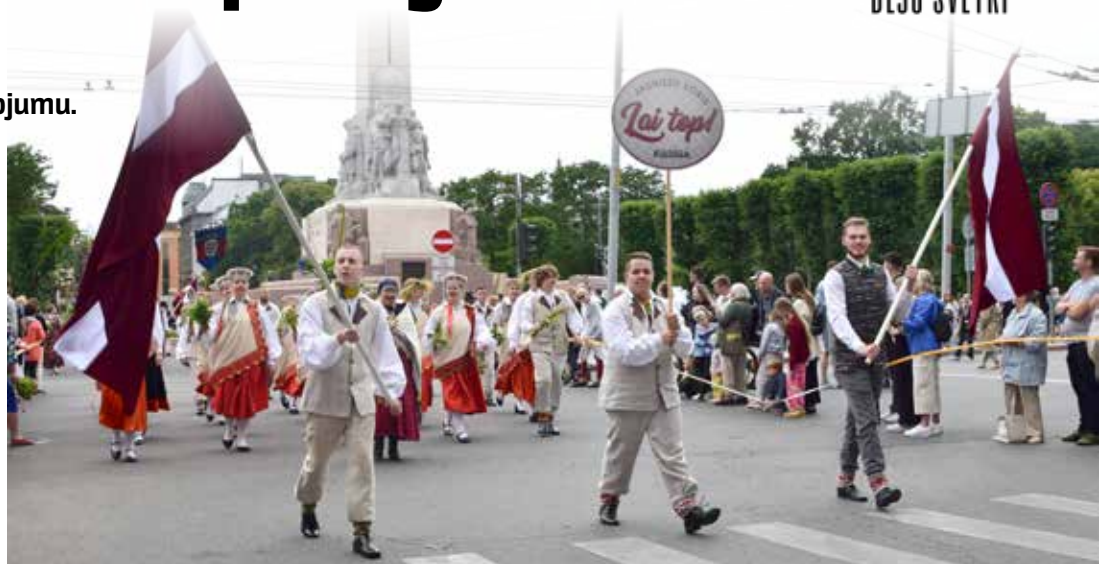
Vienotā solī, karogiem plīvojot, aizsoļo Kuldīgas jauniešu koris Lai top .