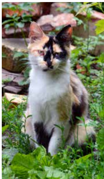
Trejkrāsu kaķēnīte. Ļoti bailīga, notvert neizdodas, dzemdējusi jau divas reizes. Nav sterilizēta, ir problēmas ar veselību.