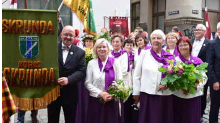
Skrundas seniori gatavi gājiēnā izdziedāt vai visas tiem zināmās dziesmas.

XXVII VISPĀRĒJIE LATVIEŠU DZIESMU UN XVII DEJU SVĒTKI