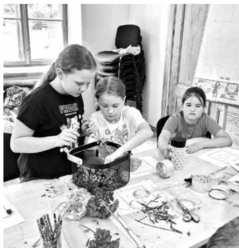
Radošajā dienā top darbi no ziediem un augiem.

Jūnijā 40 bērnu no septiņiem līdz desmit gadiem piedalījies Kuldīgas novada bērnu un jauniešu centra radošajā nedēļā Vasaras raibumiņi , pedagogu vadībā laiku pavadot aizraujoši un saturīgi.