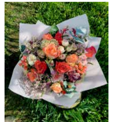
Kompozīcija top, ņemot vērā klienta vēlmes un floristes ieteikumus.

lai dāvina, un atbrauca parunāties. Ieteicu uzdāvināt ūdens krūku, ko pati nopirku un izdekorēju ar ziediem.”