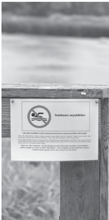
Kuldīgas Mārtiņsalā brīdinājuma zīmes aicina pašlaik Ventā nepeldēties.

Mārtiņsalā vairākas zīmes brīdina tur nepeldēties. Pilsētniekiem un viesiem ieteikts pašiem izvērtēt, kur peldēties, jo citas oficiālas vietas, kurā tiktu ņemtas ūdens analīzes, novadā nav.