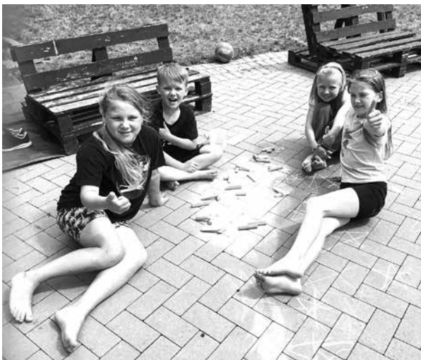
Viena no nometnes Vasaras raibumiņi nodarbēm – zīmēšana ar krītiņiem uz bruģa.