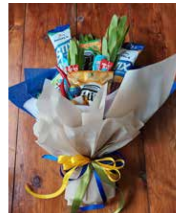
Visgrūtāk bijis izveidot desu pušķi.

Vēl veidoti bērnu pušķi, Jāņu vainagi, dekorēta ūdens krūka dāvanai, puisītim izveidota naudas kārbīņa. Dāvanas saņemas mazāk – vien draugiem un paziņām: „Dāvanu papīru esmu pirkusi veikalos, ja ieraugu tādu, kas patīk; ja ne, ņemu no bāzes. Man patīk neitrālas krāsas un raksti, dāvanu izceļot ar skaistu dekorējumu. Daži lūguši, lai dāvanu nopērku viņu vietā, pasakot ideju, kas jubiliāram garšotu, patiktu. Citi nevarēja izdomāt, ko