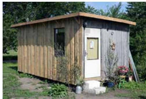
Ziedu namiņš Īvandes Dīklejās.

pievedums ir divreiz nedēļā. Zaļumus, dekorus pieliekot arī no sava dārza. Vairāk klientu bijis izlaidumu laikā – tad par pušķiem interesējušies gan vecāki, gan skolotāji, gan skolēni: „Tad gan darba netrūka! Katrs meklēja lētāko. Kādam arī iedevu atlaidi, par savu darbu nepaņēmot neko. Viena skolniece zvanīja, ka ļoti grib uzdāvināt skolotājam ziedu pušķīti, taču jāiekļaujas septiņos eiro. Nu neko – bija arī pušķīti par septiņiem eiro.”