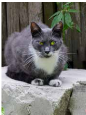
Viens no pelēkajiem. Ir mēģināts pieradināt, bet neizdevās – palika kolonijā.