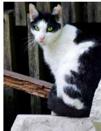
Apmēram gadu vecs kaķītis, šķiet, runčuks.