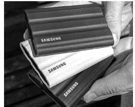
Samsung T7 Shield ārējais SSD disks.

Nākamā lieta, kam jāpievērš uzmanība, ir atmiņas ietilpība. Ārējiem cietajiem diskam tā svārstās no desmit gigabaitiem (GB) līdz pat vairākiem terabaitiem (TB). Ja meklējat disku dokumentu, attēlu vai citu failu pārsūtīšanai no vienas ierīces uz otru, optimāla ir dažu desmitu GB atmiņa. Tas ir pietiekami, lai uzglabātu tūkstošiem fotoattēlu vai vairākus simtus video, kas uzņemti ar viedtālruni. Bet, ja strādājat ar īpaši lielu datu apjomu, ja ilgus videofailus filmējat ar profesionālu tehniku, jāizvēlas disks ar vairāku TB ietilpību. Piemēram, jaunākie T7 Shield pārnēsājami cietie diski ir gan ar 1 TB, gan 2 TB atmiņu, un tie piemēroti pat tik apjomīgiem materiāliem kā vairāku stundu ilgiem 8K kvalitātes videofailiem un tūkstošiem