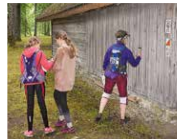
Rogainings notika arī Daugavas muzeja teritorijā.

Paldies visiem sacensību dalībniekiem par piedalīšanos un izturību, kā arī visiem čaklajiem radiem un draugiem par palīdzību un sniegto atbalstu desmitgades rogaininga sacensību organizēšanā!