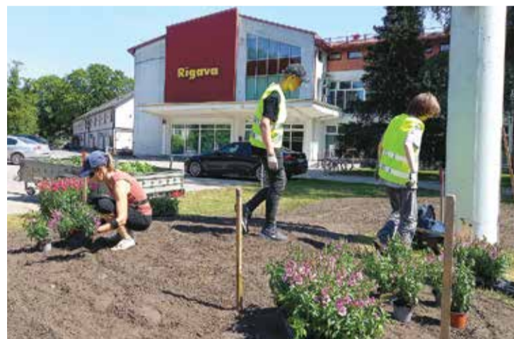
Skolēni palīdzēja sastādīt pilsētas puķu dobes.

Skolēniem bija iespēja iesaistīties tādos darbos, kas nav grūti, taču ir ļoti atbildīgi. Kā atzīst vairums pašvaldības iestāžu darbinieki, skolēni ikdienā ir ļoti palīgi. Piemēram, Salaspils novada bibliotēkā jūnija mēnesī paspēts izdarīt