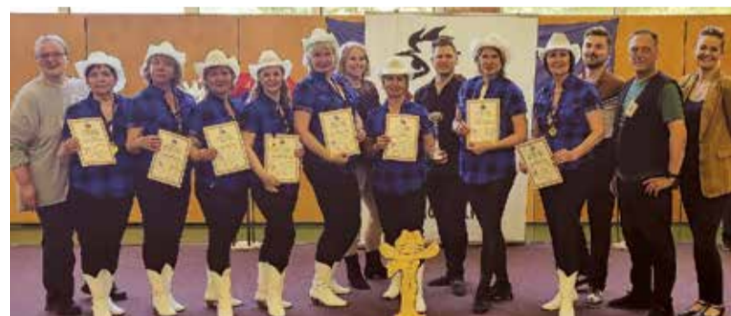
Salaspils līnijdejošu grupa “Lucia’s Linedancers”.