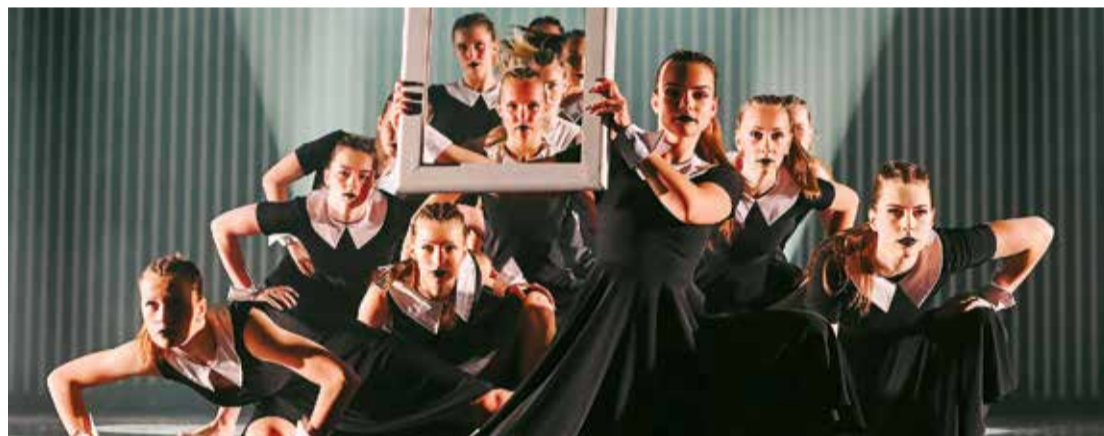
"Buras" jubilejas koncertā izdejoja daudzveidīgu un plašu programmu.

"Buru" sastāvs – vairāk nekā 200 dalībnieku vecumā no 8 līdz 35 gadiem, tostarp arī bijušie deju grupas dalībnieki. Pārsteidzoši, dzirksteļojoši, neparasti un aizraujoši – tieši tā "Buras" atzīmēja savu 25 gadu pastāvēšanas jubileju.