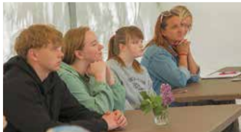
Dalībnieki uzzināja vairāk par brīvprātīgo darbu.

Lai veicinātu sabiedrības izpratni par bērnu nometņu un jauniešu pasākumu nozīmi bērnu fiziskās un psihoemocionālās veselības veicināšanai, realizētas 4 publiskas tiešraides platformā "Facebook", kuras ir pieejamas ikvienam interesentam. Projekta ietvaros ir veikti tiklošanās un pieredzes apmaiņas pasākumi nometņu organizatoriem