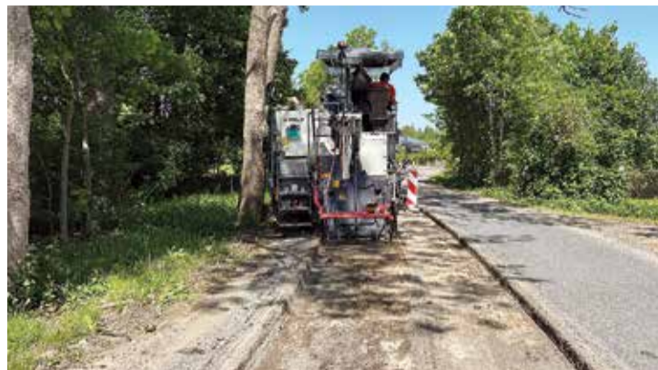
Ceļa seguma uzlabošanas darbu laikā satiksme tiek virzīta pa vienu braukšanas joslu.

projekti" par Meža ielas, Migļu ielas un Saulrieta ielas rotācijas apla un apvienotā gājēju un velosipēdistu celiņa posmā no Meža ielas līdz Rūķu ielai būvprojekta izstrādi. Būvprojekts jāizstrādā 7 mēnešu laikā un tā ietvaros jāparedz esošā Meža ielas un Migļu ielas krustojuma pārprojektēšana par rotācijas apli, kā arī apgaismota apvienotā gājēju un veloceliņa projektēšana posmā no Meža ielas līdz Rūķu ielai. Būvprojektu plānots realizēt 2024. gadā.