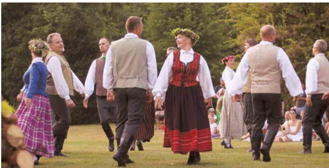
Deju kopa "Ūsa" Saulgriežos Daugavas muzejā.