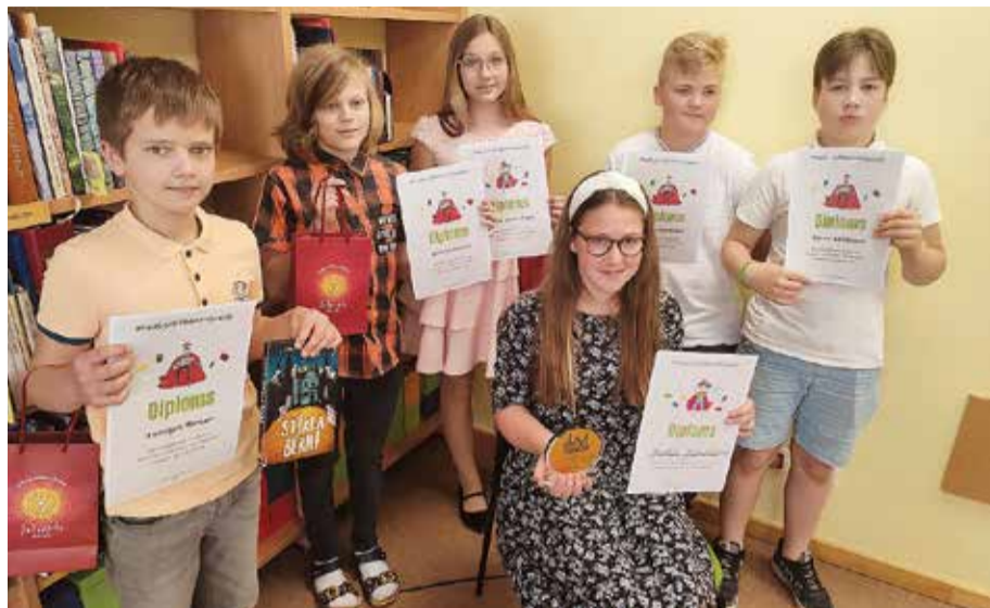
Skaļās lasīšanas čempionāta dalībnieki bija cītīgi gatavojušies konkursam.

Evita Gleizde, Salaspils novada bibliotēka