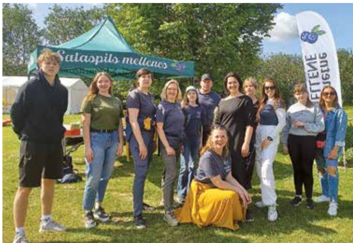
Projekta gaitā tika rīkoti dažādi pasākumi un apmācības.

un jauniešu pasākumu organizatoriem, daloties pieredzē par pasākumu rīkošanu Latvijā un Eiropā. Ir izveidota un publicēta rokasgrāmata nometņu audzinātājiem, iekļaujot labās prakses piemērus, biedrības vērtības, personāla pamatfunkcijas, aktivitāšu piemērus, rīcību dažādos gadījumos un citas nometņu organizēšanai nepieciešamās zināšanas. Projekta gaitā tika rīkotas divas apmācības