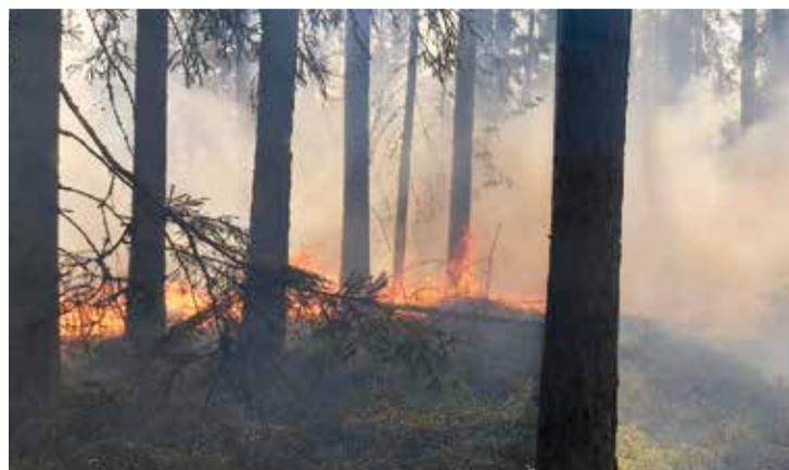
Vasaras periodā, atrodoties mežā, ir jāievēro noteikti aizliegumi un ierobežojumi.

1. maijā stājās spēkā Valsts meža dienesta noteiktais meža ugunsnedrošais laikposms visā valsts teritorijā, kura laikā iedzīvotājiem, atrodoties mežā, ir jāievēro noteikti aizliegumi un ierobežojumi. To paredz MK noteikumi