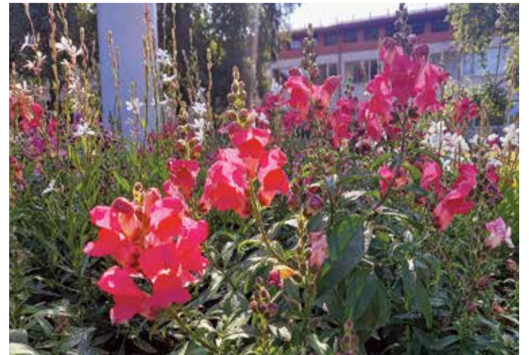
Ikvienu puķu dobes kompozīcija veidota pēc īpaša tehniskā zīmējuma.

"Šajā sezonā īpašu vērtību un darbu esam veltījuši Pulksteņa skvēram – pilnībā renovēta "Sauls dobe". Tajā ar laiku mūs priecēs rozes, hortenzijas un miskantes. Šīs "Sauls dobes" īpašā "odziņa" ir vasaras ziedu "gredzentiņš". Rekonstruēts arī Ceru un Zinību ielas rotācijas aplis. Šī kompozīcija mūs pārsteigs ar krāšņumu un vērienību. Aplūkojot krāsainās dobes, protams, nedrīkst aizmirst Rīgas dobi, kurā iestādīta krāšņa un sarežģīta vasaras augu kompozīcija. Šo dobi veido lauvmutītišu, gauru, stiepjuļiģu un citu "vasaras skaistuļu" salikums. Jaunums ir Rīgas un Lauku ielas krustojuma dobe – to savukārt rotā klājeniskās rozes, ģerānijas un miskantes. Kā katru gadu, arī pilsētas laternas rotā skaistas, krāšņas laternu podu kompozīcijas Rīgas ielā, Miera ielā un Maskavas ielā. Jaunums – Maskavas ielas rotu papildina arī 10 betona podu kompozīcijas. Ievērojams ciņģa noteikti ir arī Nometņu ielas bērzu birzs dobe, kuru rotā ziemcietes, kas sevi "parādīs" jūlija mēnesī," stāsta "Komunālā dienesta"