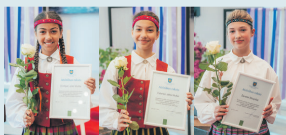
Apbalvo labākos skolēnus