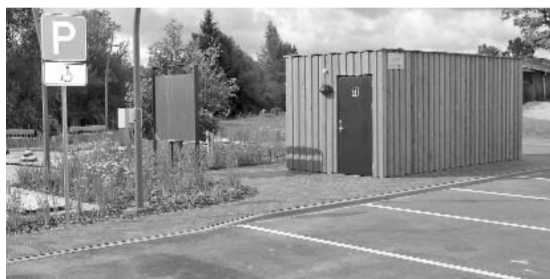
No 1. augusta pilsētas iedzīvotājiem un viesiem būs pieejamas publiskās labierīcības