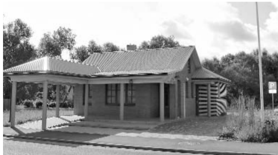
Valkas novada Tūrisma un informācijas biroja jaunā atrašanās vieta Semināra ielā 1.