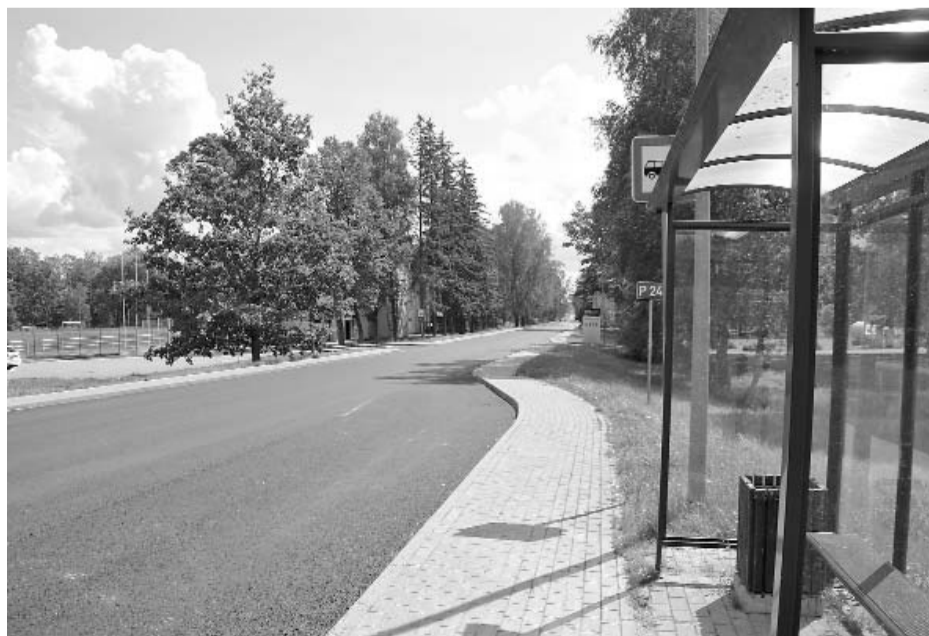
Atjaunotais Vienības gatves ielas braucamās daļas asfalta segums