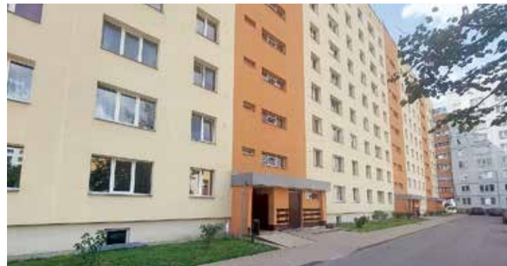
Līdzfinansējums piešķirts dzīvojamās mājas teritorijas labiekārtošanai.

transportlīdzekļa novietošanai cilvēkiem ar invaliditāti. Tāpat plānots izbūvēt autostāvvietu lietus ūdens kanalizāciju, kā arī veikt autostāvvietas apgaismojuma izbūvi. Paredzēta velosipēdu turētāja uzstādīšana. Projekta ietvaros tiks izbūvēts arī atkritumu konteineru laukums un pagalmā atjaunota apstādījumu zona.