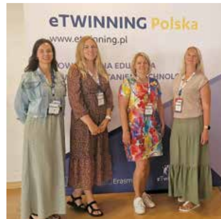
Skolotājas seminārā Polijā.

PII "Salaspils 1. pirmsskola" bērnudārzā "Jāņtārpiņš" ir realizēti divi nacionālie projekti – "Koki rudenī