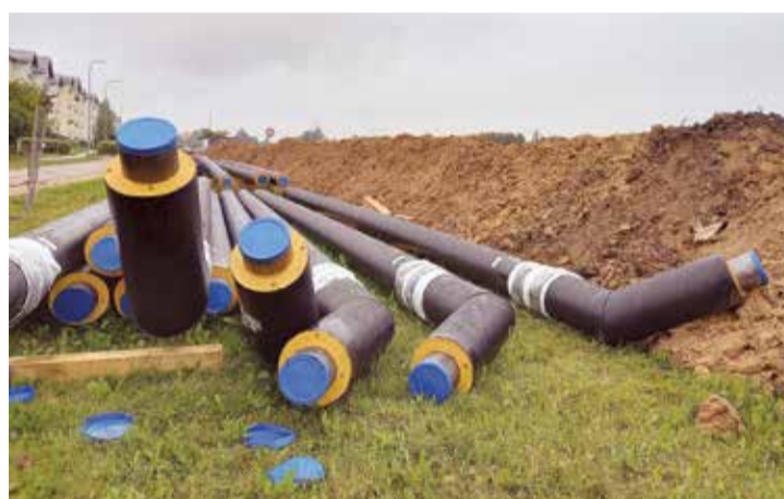
Aktīvi siltumtrases izbūves darbi norisinās Nometņu ielā.

Siltumtrases projekta ietvaros tiks izmantotas rūpnieciski izolētas caurules, kas tiks ieguldītas zemē. Rūpnieciski izolēto cauruļu galvenās priekšrocības ir minimāli siltuma zudumi un ilgs kalpošanas laiks. Pārejot no dabasgāzes apkures uz centralizēto siltumapgādi,