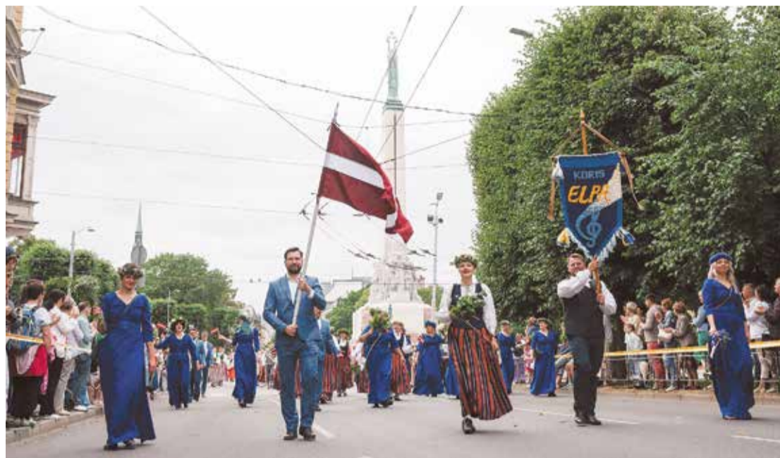
Koris "Elpa" XXVII Vispārējo latviešu Dziesmu un XVII Deju svētku dalībnieku gājienā "Novadu dižošanās".