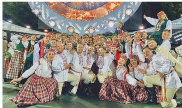
JDK "Ūsiņš" pēc "Mūžīgais dzinējs" koncerta.

Augšup" Mežaparka Lielajā estrādē. Vizītes laikā delegācija viesojās arī Salaspilī un apmeklēja "Salaspils Siltumu", devās ekskursijā uz Septīto pirmsskolas izglītības iestādi, kā arī ielūkojās Nacionālā botāniskā dārza vasaras ziedošajā krāšņumā.