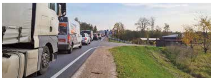
Autoceļa A4 Rīgas apvedceļš.

Plānots esošo divjoslu Rīgas apvedceļu (autoceļš A4) pārbūvēt par ātrgaitas autoceļu ar divām