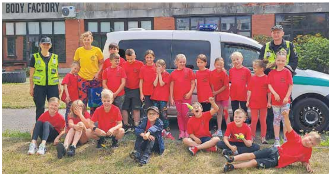
Nodarbības laikā bērni uzdeva daudz jautājumus un saņēma uz tiem atbildes.

Nodarbības noslēgumā bērni tika iedrošināti atkārtoti izrunāt ar saviem vecākiem tematus par drošību uz ceļa, ūdenī un ūdens tilpņu tuvumā, jo drošība ir pirmajā vietā.