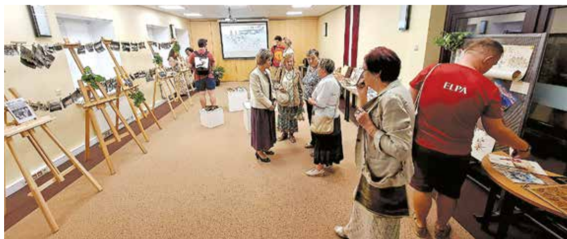
Izstāde "Dziesmas ceļš Salaspilī" Salaspils novada bibliotēkā.