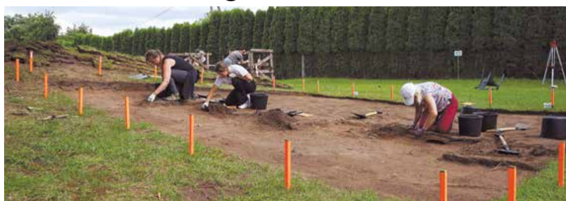
Doles muižas parkā notiekošajiem arheoloģiskās izpētes darbiem varēja pieteikties ikviens interesents. Darbos palīdz arī skolēni, kas vasarā strādā Daugavas muzejā.

niņā tika konstatētas centriskas konstrukcijas stabu pamatnes. Viens no šo pamatņu skaidrojumiem varētu būt teātra skatuves koka karkasa stabu pamati. Pirmo sezonu izrakumos tika konstatētas arī divas apstādījumu stadijas. Augšējās slāņos tika konstatētas paliekas no apstādījumiem, kas attēloti 19. gs. beigās veidotā Doles muižas plānā. Izrakumos atsegta paliekas liecina, ka plānā attēlotais muižas dārza plānojums nav precīzs. Savukārt apakšējās slāņos tika konstatētas paralēlu stādījumu dobes, kuras var ticami skaidrot, kā minētā brīvdabas teātra kulises, kas veido-