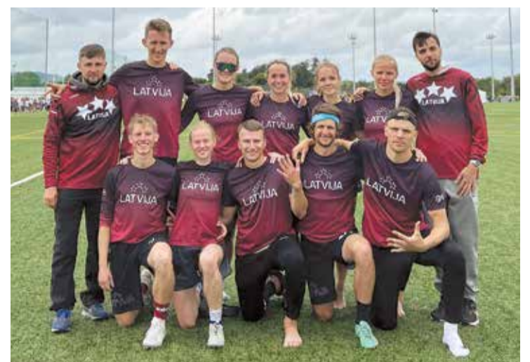
Salaspils novadnieki Eiropas frisbija čempionātā Limerikā. Publicitātes foto