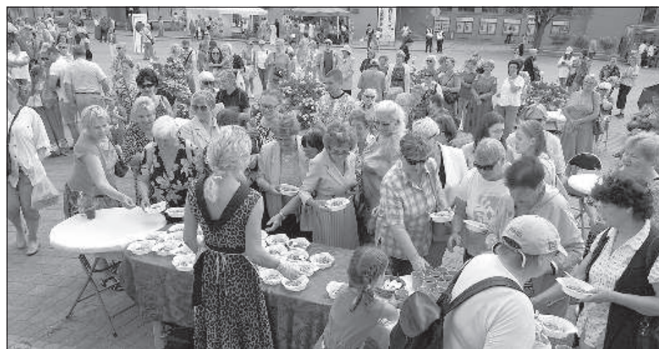
Дегустация традиционных блюд.

со шпеком и угостили присутствующих серым горохом со шпеком, жареными булочками с корицей, пирогами со шпеком и компотом из красной смородины.