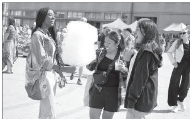
Не столь близкие гости.