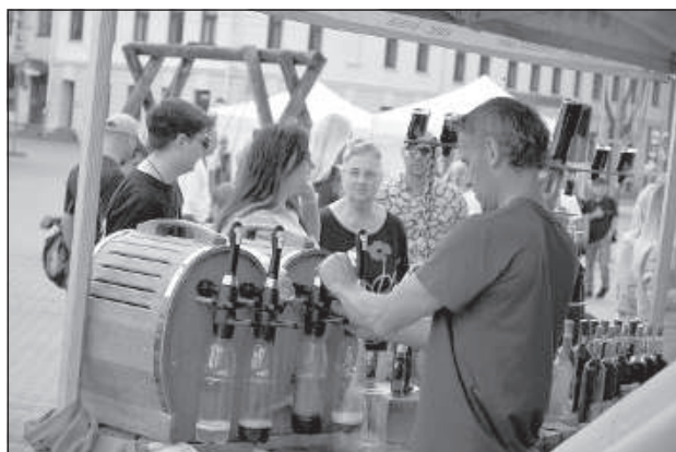
Возможность продегустировать и приобрести продукцию местных виноделов.