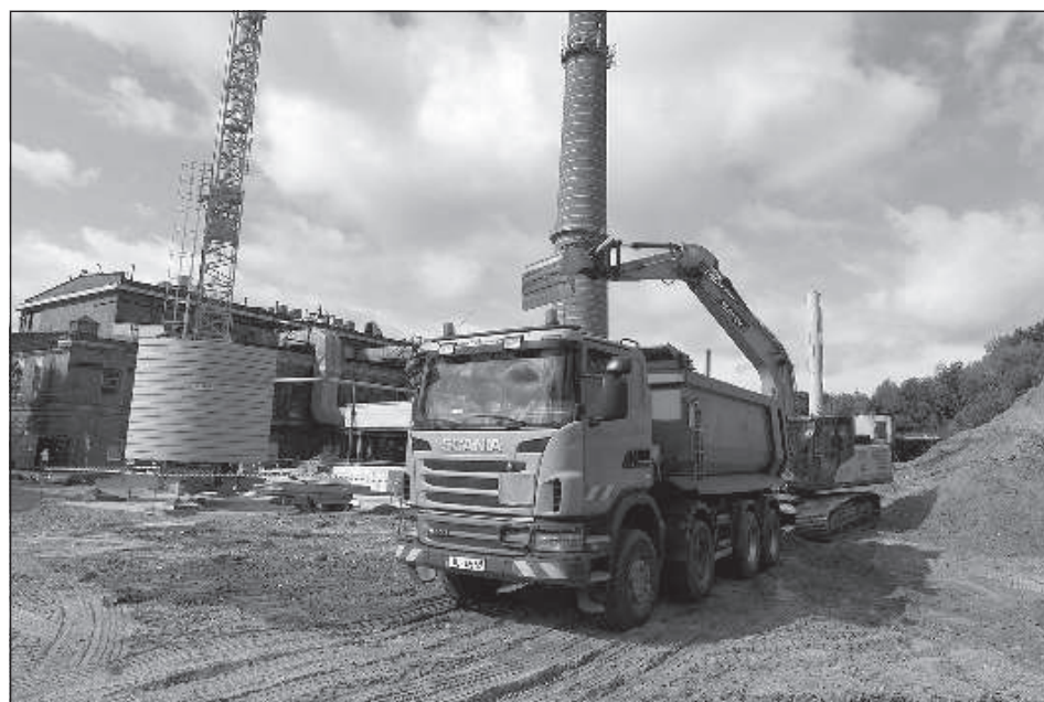
Строительные работы на площадке ТЭЦ-2.