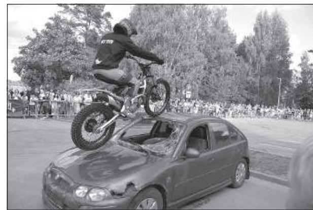
Когда машина — не препятствие.