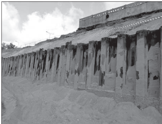
Металлическая стенка для предотвращения просадки песка.

«Котельная будет работать на древесной щепе, которая сейчас по-прежнему остается более экономически выгодным видом топлива по сравнению с природным газом и даже сжиженным нефтяным газом, которым топили ТЭЦ-2 этой зимой. Однако, от газовых котлов на ТЭЦ-2 не планируем отказываться, так как их можно будет использовать в случае, если топиться газом станет выгоднее, чем щепой, а также для обеспечения пиковых нагрузок в особенно холодные дни. Все это приведет к тому, что PAS «Daugavpils siltumtīkli» сможет диверсифицировать виды топли-