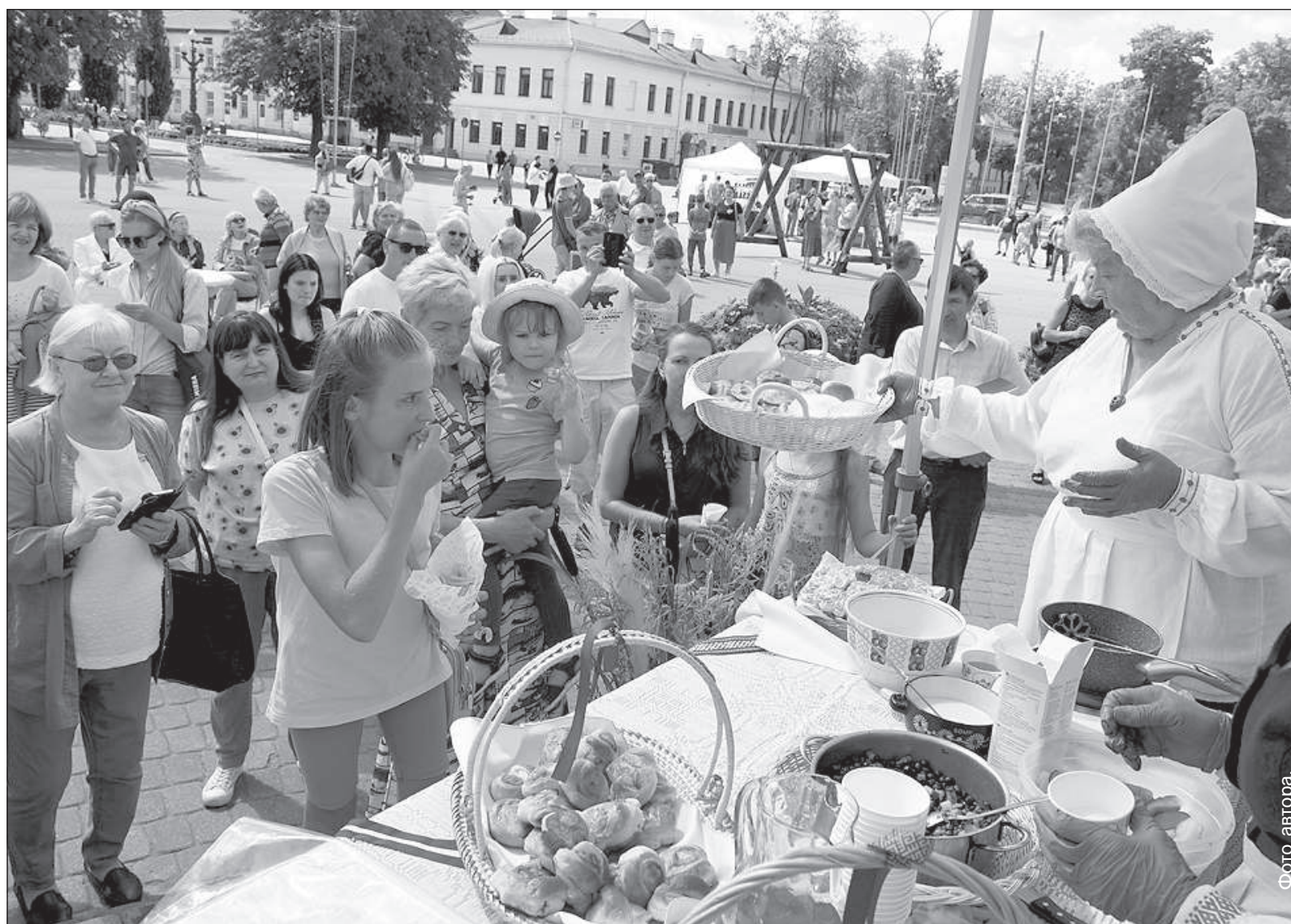
Хозяюшки Латвийского национального общества угощают присутствующих.