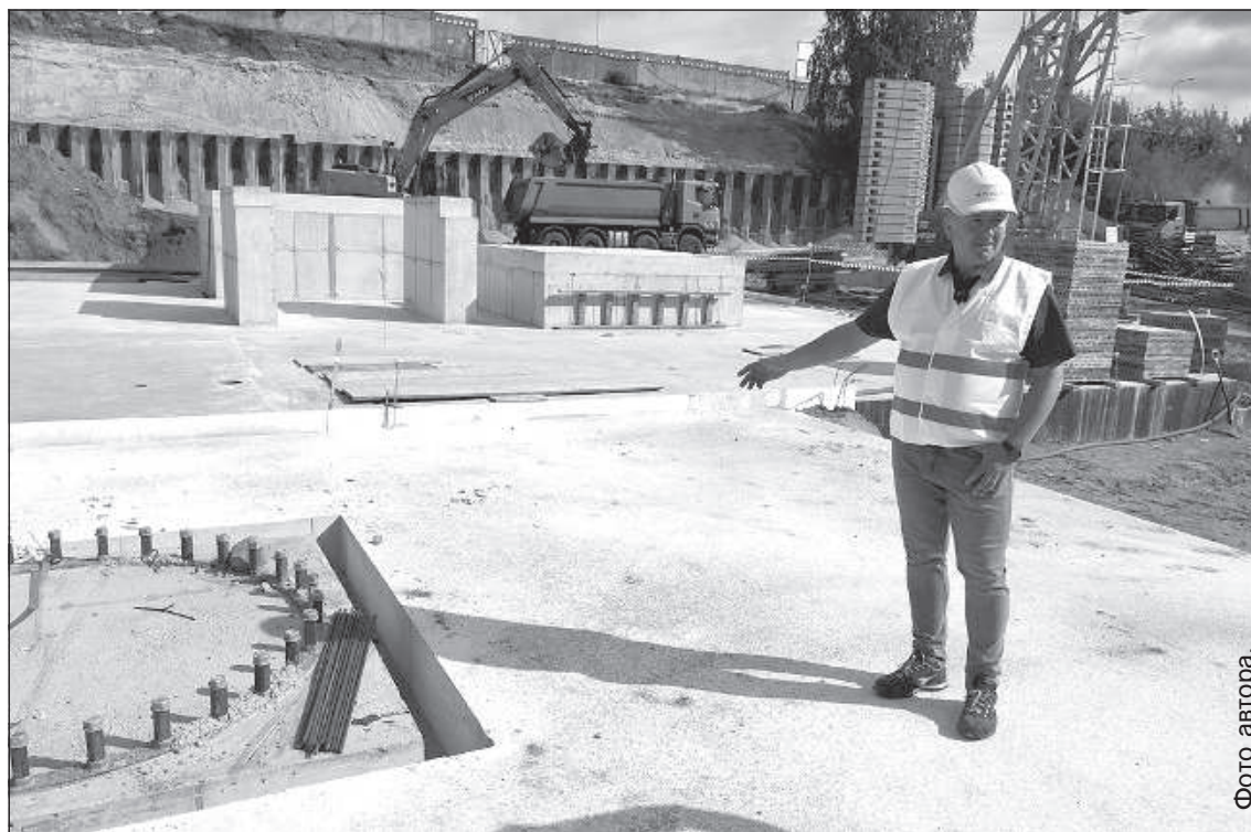
Бетонные основы под установку котла.