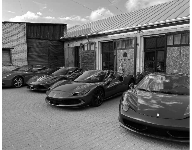
Kuldīgā varēja apskatīt 11 luksusa sporta auto Ferrari modeļus.

Cilvēki, kas ar šīm mašīnām brauc, dzīvē ir kaut ko sasnieguši un pārsvarā ir jau gados. Viņus interesē kultūra, skaistākās vietas, vēsture, viņi uzdod daudz jautājumu. Mums jāpaspēj Latviju izrādīt. Iedzīvotājus interesē autoparāde, bet autoīpašnieki vēlas apmainīties ar pieredzi un uzzināt kaut ko jaunu. Mums jānodrošina balanss: ko iegūst autoīpašnieki