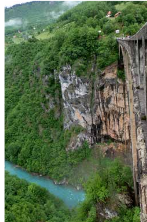
Viena no Melnkalnes vizītkartēm – Taras kanjons.

fjords precīzi atbilst šim līcim, proti, šaurs, dziļš, bieži vairākus desmitus kilometru garš, izlocīts jūras līcis ar atzarojumiem un stāviem, augstiem krastiem.