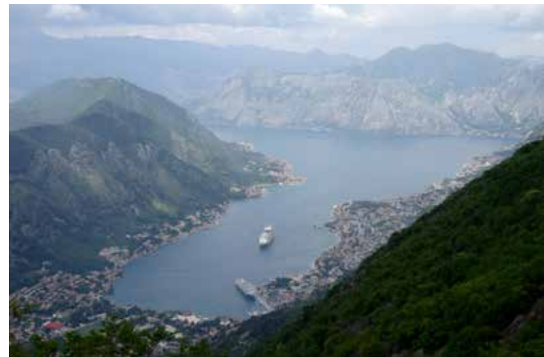
Kotoras līcis no serpentīna augstākā punkta – 25. pagrieziens.