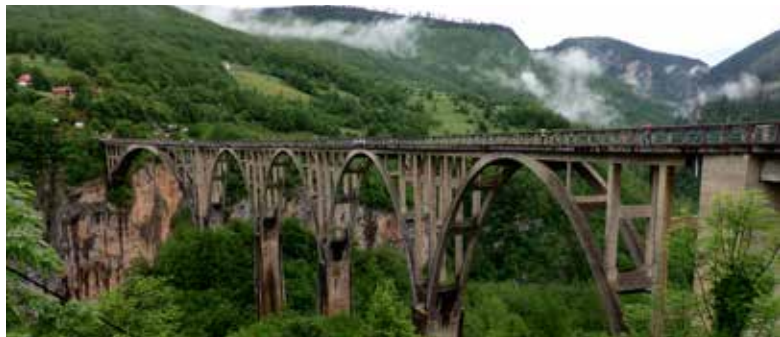
Džurdževića tilts virs Taras upes slejas 172 metru augstumā.