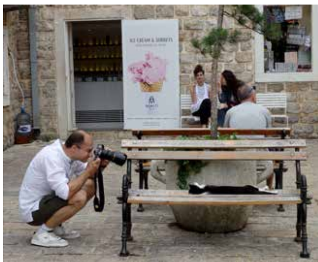
Laiskie kaķi valdzina ne tikai bērnus vien.