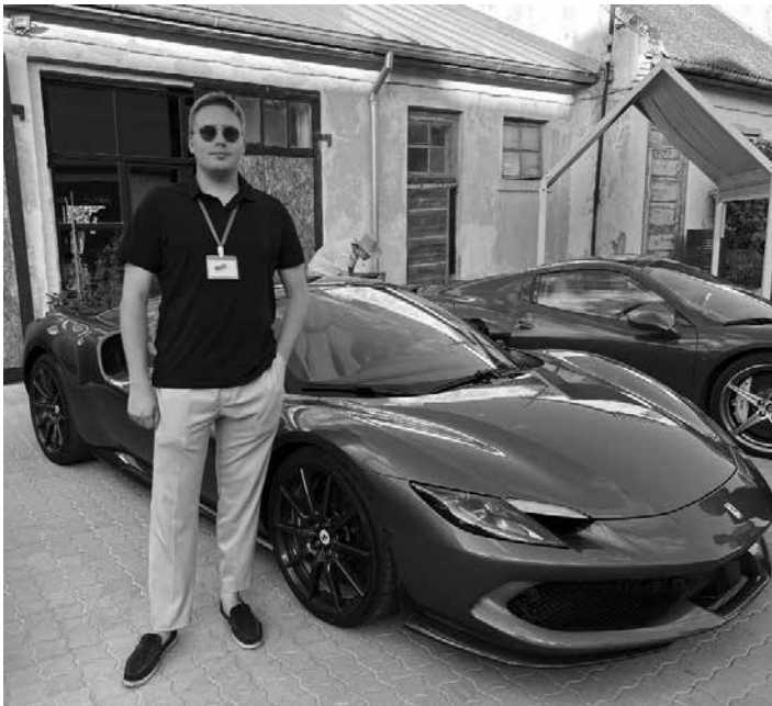
Soms Ate Kūtsa no savas darbavietas Igaunijā, kur automašīnas tirgo, atbraucis ar zilu šīgada Ferrari 296 GTS .

Šo plānojam jau sen – kopš 2019. gada, jo viss aizkavējās kovida dēļ. Lai tādu sarīkotu, jāiegūst ļoti liela spēkratu īpašnieku uzticība, un tas nav lēti. Mašīnas jāatved no durvīm līdz durvīm, līdz ir mehāniķis kur treileri: ja kādai mašīnai kaut kas atgādās, mehāniķis uzreiz var to uzlikt uz treilera. Tas viss, protams, maksā ļoti dārgi. Savācot sākotnēju sponsoru atbalstu un ieliekot savus līdzekļus, tas tomēr ir iz-