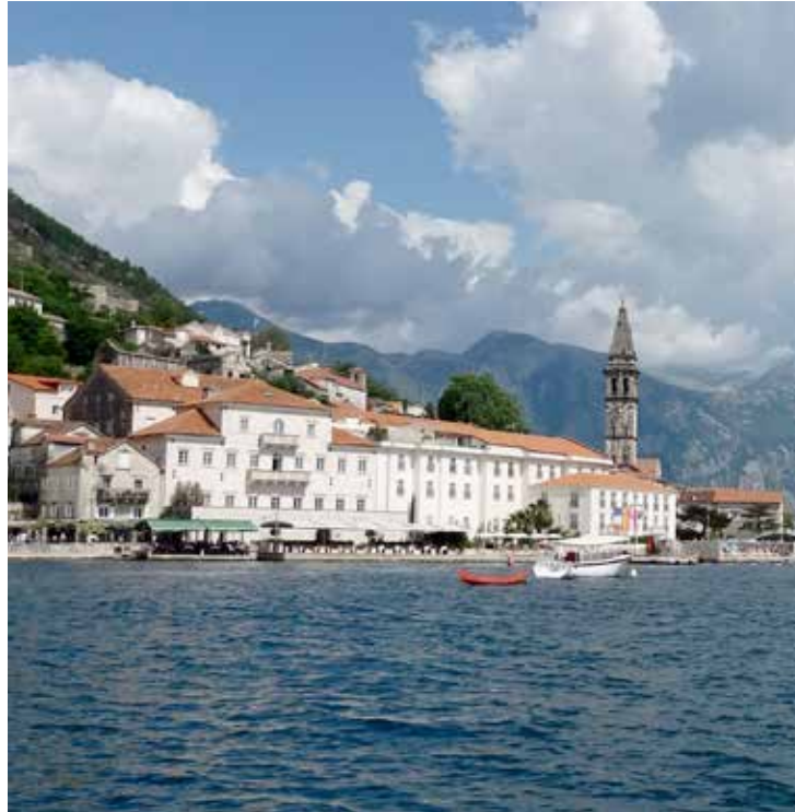
Pilsētu Perastu salīdzina ar Venēciju, kas piestājusi Kotoras līči.