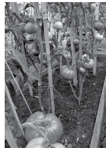
Siltumnīcā paša izaudzētie tomāti.