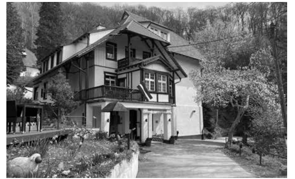
Organizācijas Daugavas vanagi Vācijā īpašums Bērzaine atrodas Freiburgā. Tas darbojas kā viesu nams un kultūras centrs, kurā īpaši gaidīti vienmēr ir latvieši.