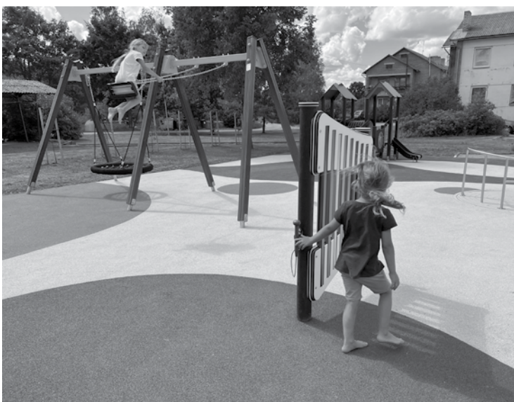
Rotaļu laukums Skrundā, Dārza ielā, ir spilgtās krāsās, un tajā ieklāts segums, kas mazina triecienu, lai krītot mazie nesasītos.