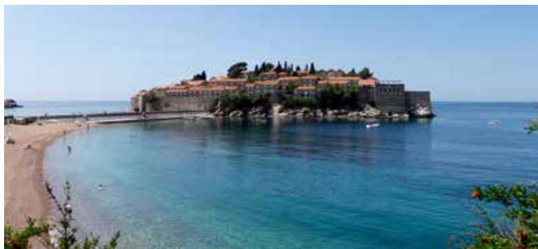
Sv. Stefana sala nevienai neatstāj vienaldzīgu.