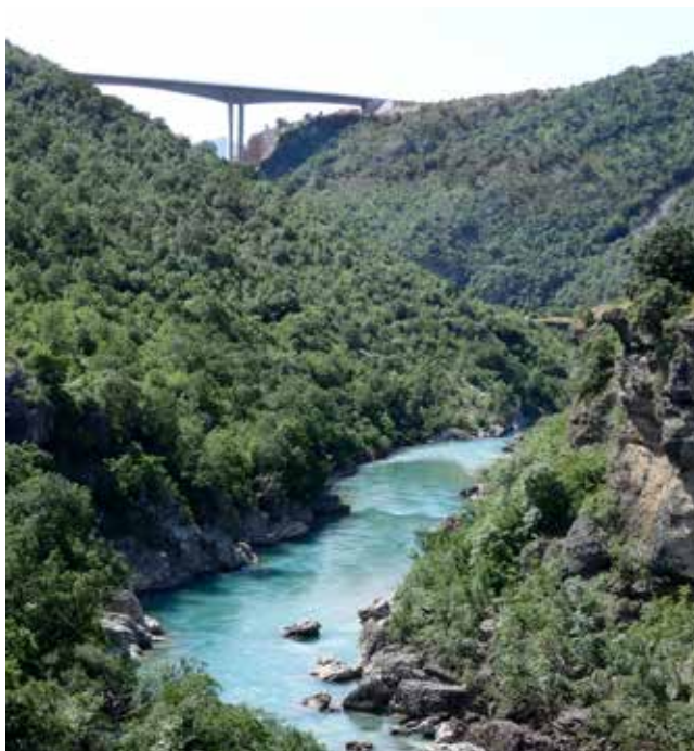
Morčaš kanjons pārsteidz ar neticami dziļu ūdeni. Tālumā redzams valstī augstākais tilts, pār kuru uzbūvēta maksas autostrāde.