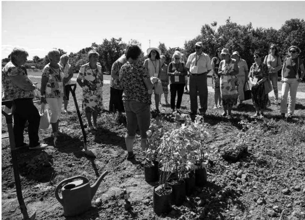
Latvijas Dārzkopības institūtā par dārzenu un augļu koku audzēšanu biedrību pārstāvjiem stāstīja zinātnieki un selekcionāri.

Zinātnieku un selekcionāru vadībā 30 atbalstīto organizāciju pārstāvji iepazīna dārzenkopību un augļu koku audzēšanu. Mūsu novadu pārstāvēja Kuldīgas senioru skola, bet Kuldīgas novads šoreiz pārstāvēts viskuplāk gan biedrību, gan ģimeņu skaita ziņā. Pa deviņiem projektiem norit Kurzemē un Vidzemē, seši Latgalē, pieci Zemgalē, un vienu visā valstī rīko fonds Ziedot.lv . Kopumā iesaistījušās 903 ģimenes jeb gandrīz 3500 cilvēku.