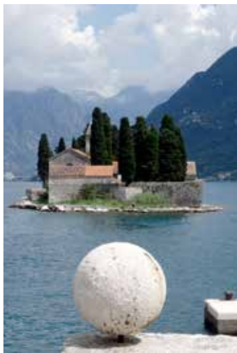
Sv. Georga sala Kotoras līcī.

Vieta, kuras dēļ vērts doties uz Melnkalni, ir 32 km garais Kotoras līcis, kas atzīts par vienu no 15 skaistākajiem līčiem pasaulē. To sauc arī par Balkānu fjordu, taču ģeologi nepiekrīt, jo Norvēģijas fjordu un Kotoras līča izcelsme esot atšķirīga. Tomēr no valodniecības viedokļa jēdziens