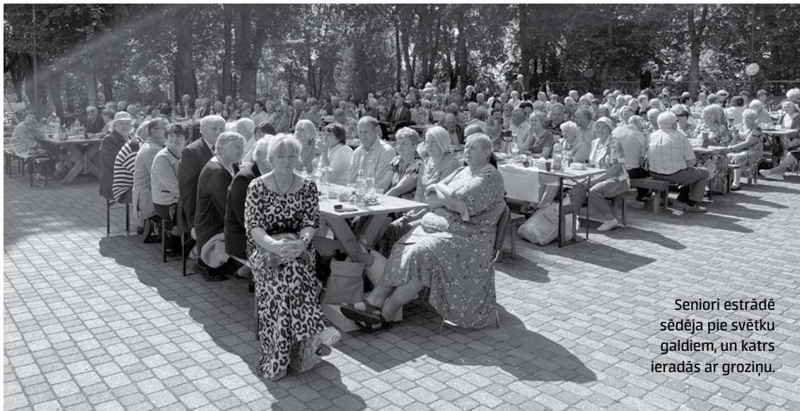
Seniori estrādē sēdēja pie svētku galdiem, un katrs ieradās ar groziņu.

K uldīgas novada senioru srietā ar devīzi Pie Ventas ziedu laikā Skrundas estrādes parkā bija sapulcējušies ap 470 dalībnieku, un šoreiz pasākumu caurvija romantiskā ziedu tēma.