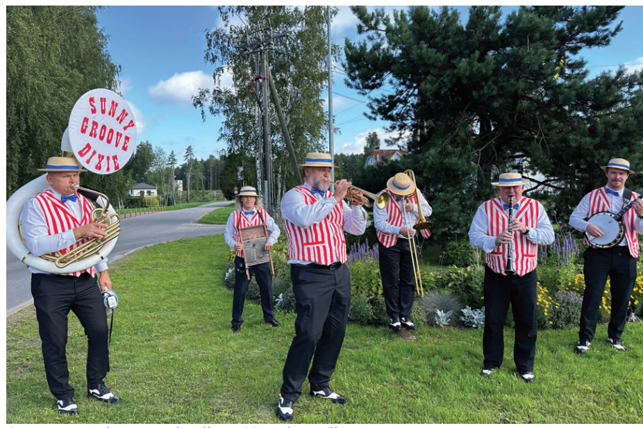
5. augusts. Galvenā svētku diena. Novada modināšana.