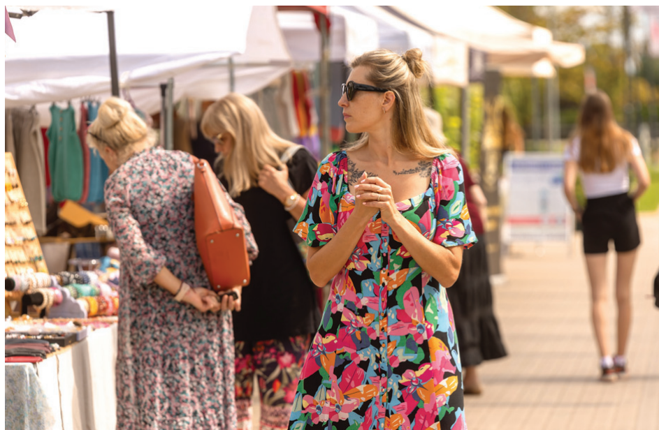
5. augusts. Galvenā svētku diena.