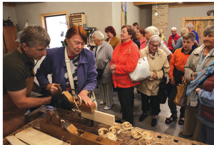
3. augusts. Senioru un Bērnu diena.