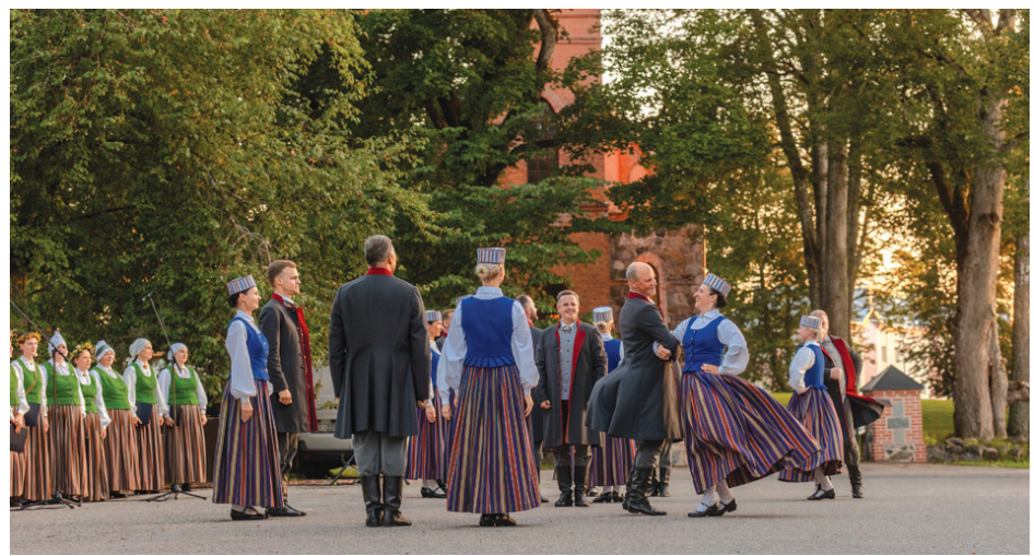
2. augusts. Amatiermākslas kolektīvu diena.