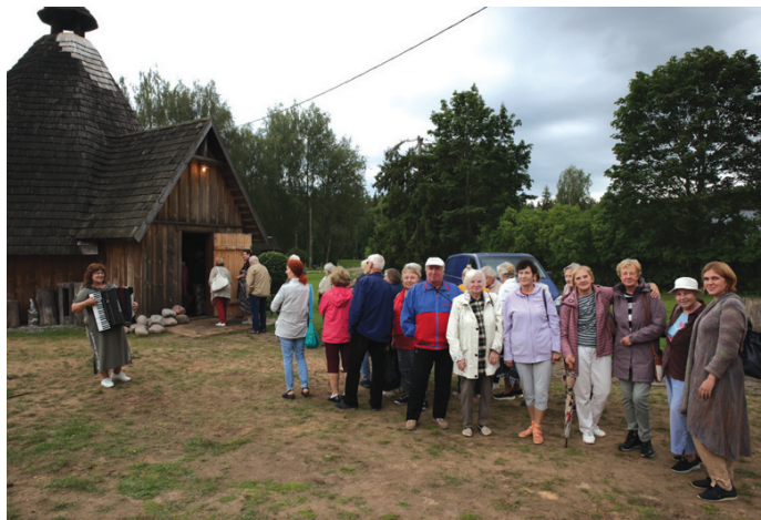
3. augusts. Senioru un Bērnu diena.