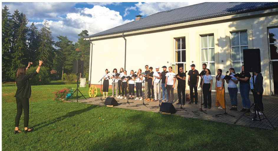
2. augusts. Amatiermākslas kolektīvu diena.