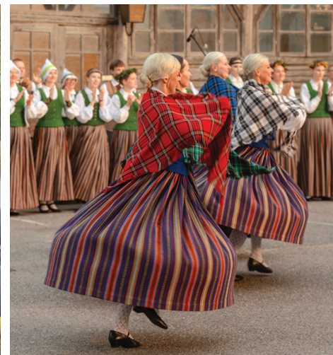
2. augusts. Amatiermākslas kolektīvu diena.