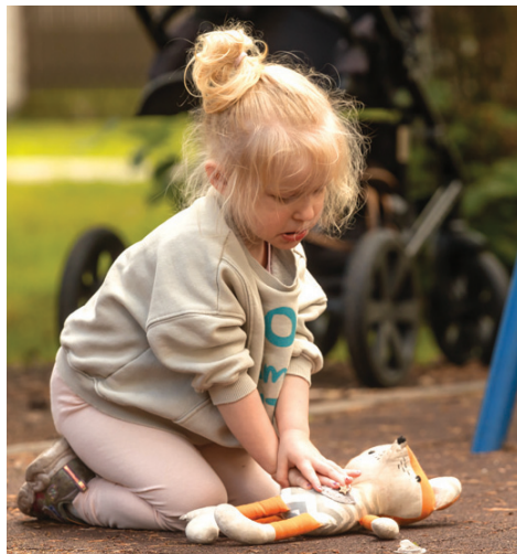
31. jūlijs. Veselības diena.