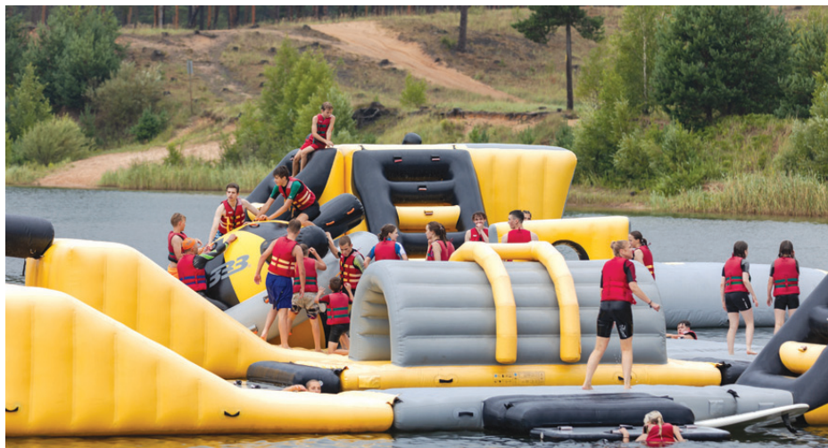
1. augusts. Jauniešu diena Sporta kompleksā 333.