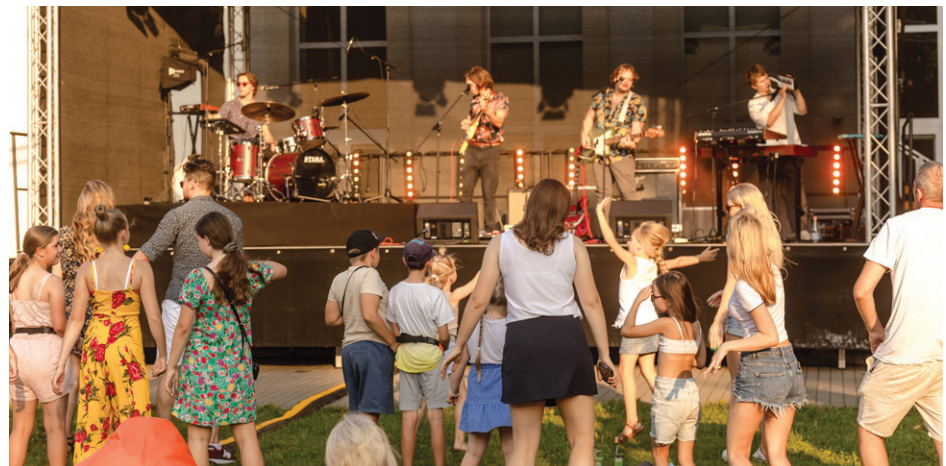
6. augusts. Svētku noslēguma diena.