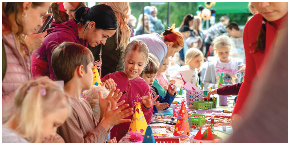
3. augusts. Senioru un Bērnu diena.