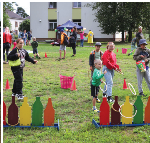
3. augusts. Senioru un Bērnu diena.