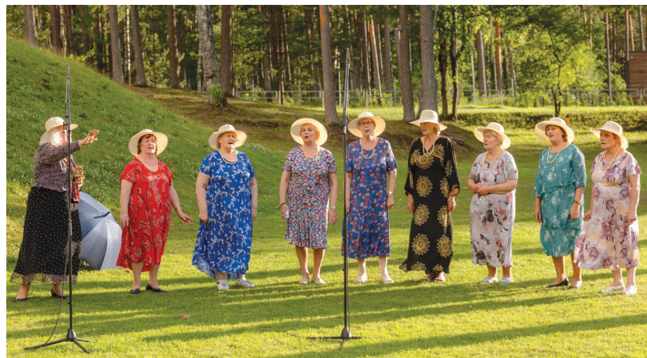
2. augusts. Amatiermākslas kolektīvu diena.