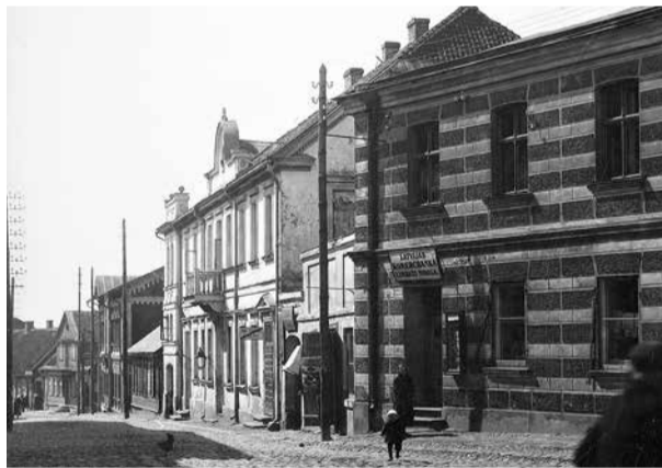
Skats uz ēku no Turgus laukuma. Ēka attēla centrā. 20. gadsimta 30. gadu foto. Limbažu muzeja krājums.

Nams totāli pārbūvēts 20. gadsimta 70. gados, izveidojot trešo stāvu un aizberot pagrabtelpas.