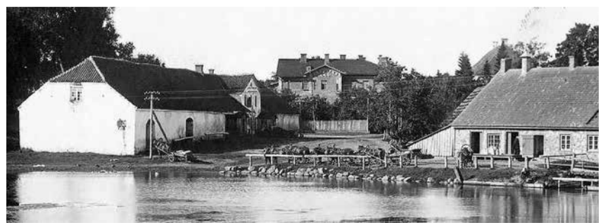
Skats pāri dzirnavu ezeram. Ēka attēla kreisajā malā, vidū Kalio nams. 20. gadsimta 20. gadu foto.

Lejaskrogs nojaukts un samalts šķembās 20. gadsimta 20. gados. Pēc ēkas demontāžas Rēveles (tag. Burtņieku) iela zaudēja loģisku noslēgumu.