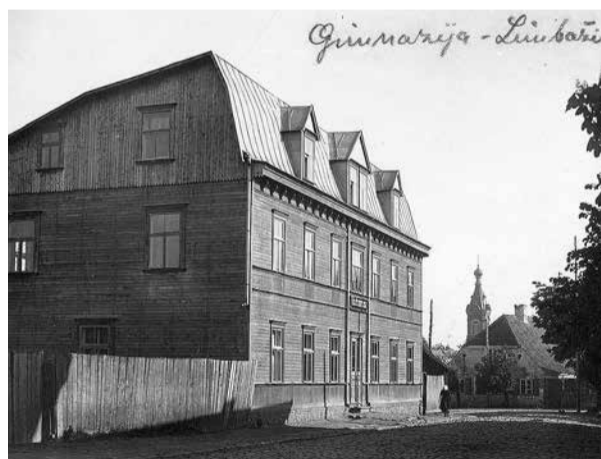
Skats uz ēkas rietumu gala un galveno fasādi. 20. gadsimta 30. gadu foto.

Ēka nojaukta 2021. gada decembrī pēc SIA "Lēdurgas Miesnieks" iniciatīvas.