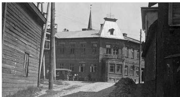
Skats uz ēku no Pils ielas. 20. gadsimta 30. gadu foto.

Ēka sagrauta 1944. gadā aviācijas uzlidojumā.