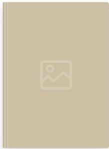
Es visu mūžu mīlējusi esmu Brīdaka, Lija