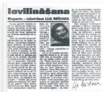
Ievilināšana Brīdaka, Lija