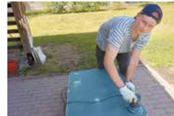
PII "Salaspils 1. pirmsskola" skolēni slīpēja bērnu galdiņus.

Arī šogad Salaspils jaunieši izrādījuši interesi izzināt Salaspils sporta nama darbību un vienu mēnesi būt daļai no sporta nama kolektīva. Jūnijā sporta namā strādāja divi jaunieši, kuri iesaistījās ģērbtuvju griestu un durvju rokturu labošanā, veica stadiona tribiņu uzkopšanu un pat izmēģināja tiklu maiņu stadiona