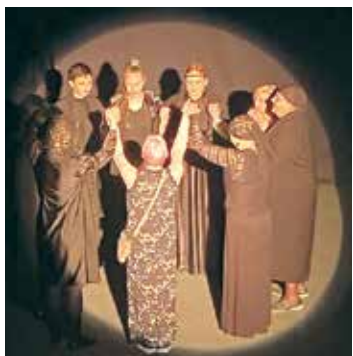
“Salaspils teātra” kolektīvs.

Vraca – pilsēta ar devīzi “Pilsēta kā Balkāni – sena un jauna”, salaspilī-