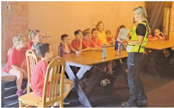
Nodarbības laikā bērni tika informēti arī par drošību uz ceļa.

Lai bērni vasarā justos droši un būtu ziņoši, nodarbībā viņi tika iepazīstināti ar policijas darbu, ekipējumu, kā arī informēti par drošību uz ceļa. Nodarbības laikā bērni tika informēti par gājēju un velosipēdistu pienākumiem, elektro-