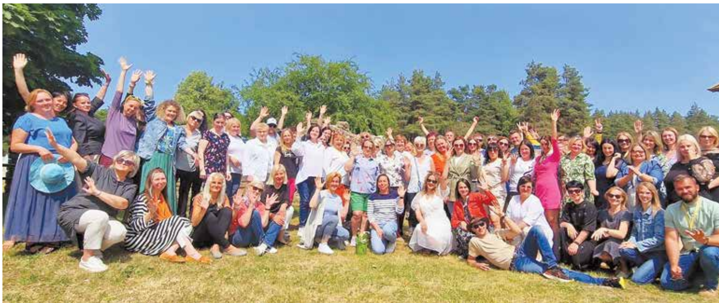
Salaspils 1. vidusskolas kolektīvs izbraukuma seminārā.

Salaspils 1.vidusskolas kolektīvs ir spējis saskatīt un izmantot atšķirības, pārmaiņu izaicinājumus un pretrunas kā attīstības pamatu savai tālākai izaugsmei. Neskatoties uz izglītības sistēmas reformas nepilnībām, negācijām par pedagogu darba kvalitāti, kas šobrīd izskan sabiedriskajā telpā, varam apgalvot, ka Salaspils 1.vidusskolā strādā labi, ļoti labi un izcili pedagogi! Šo informāciju apstiprina arī dati, kas iegūti 2022./2023. mācību gadā vērojot visu pedagogu vadītās mācību stundas (vadības komanda stundu vērošanu veica pēc noteiktas metodikas, iegūtie dati: 60,29% pedagogu profesionālā darbība mācību stundās ir optimālā līmenī - "labi"; 30,88% pedagogu profes-