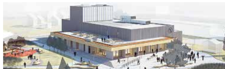
Būvprojekta autors: PS “Arhitekti Edijs Levins, Agnese Stasūne, Iveta Lūse”.

zāle, gan citas telpas. Būve tiks paplašināta vēl par vienu zāli, ēkas funkcionālie papildinājumi paredz mazās zāles telpu ar brīvi modelējamo sēdvietu un aprīkojuma izkārtojumu. Turpat arī baleta zāle un nodarbību zāle, kurām ierīkota atsevišķa ieeja un gērbtuves. Arī aktieru un administrācijas telpas paredzēts veidot ar savu ieeju un palīgtelpām. Izstrādājot pārbūves projektu, īpaši piedomāts par ener-