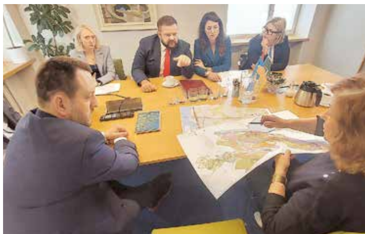
Tikšanās Salaspils novada pašvaldībā.

11. augustā Salaspils kultūras namā “Rīgava” norisinājās arī Rīgas plānošanas reģiona Attīstības padomes sēde, kurā, lai kopīgi pārrunātu reģiona sabiedriskā transporta attīstības virzienus, bija ieradies arī satiksmes ministrs. Ministrs norādīja, ka satiksmes tīklojums reģionā šobrīd mainās līdz ar “Rail Baltica” vērienīgā projekta īstenošanu un vairākās Pierīgas pašvaldībās – Salaspilī, Ķekavā, Ropažos jaunā dzelzceļa trase sadalīs teritoriju vairākās daļās un jāplāno, kā veidot savienojumus,