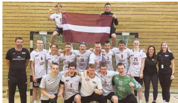
U17 izlase European Open.