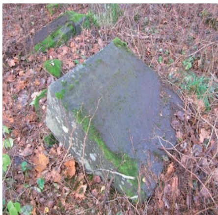
Поваленная надгробная плита на могиле Яновских. 2012 год