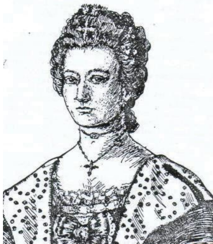
Konstance Benislavska (1746 -1806)

Konstance Benislavska tiek pamatoti uzskatīta par vienu no zināmākajām 18. gadsimta poļu dzejniecēm.