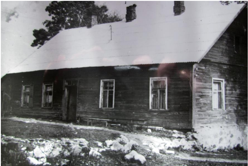
Tā izskatījās kungu nams 1980.-o gadu sākumā.

Maltas muiža bija diezgan bagāta. 1890. gados tās ansmblis bija veidots no sešām koka ēkām. Tā kā muižas saimnieki pārsvarā dzīvoja Varšavā, kungu nams viņiem kalpoja kā vasaras rezidence, tā bija neuzkrītoša vienstāvu ēku. Vēlāk tai klāt tika piebūvēts neliels ķieģeļu spārns. Piebūvei bija balkons, no kura pavērās gleznaini skati uz Maltas upes ieleju un ezeriem.