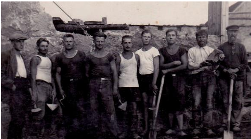
1936 год. Бригада строителей из деревень Чулки и Даниловка на заработках в Мадонском крае.

С обретением Латвией независимости закрылась граница с Россией, и стало меньше возможностей для «хождения в бурлаки», т.е. дополнительного заработка. Перемещаться теперь можно было только в пределах Латвийского государства. Однако при расселении сельского населения на хутора появилась большая потребность в строительных работах. Правительство в эти годы выделяло крестьянам субсидии на строительство хозпостроек (сараяв, хлевов, амбаров) из полевого камня, поэтому каменщики (мурники) были в цене. Мужчины из окрестных деревень собирались в строительные бригады и подражались на работы в других краях Латгалии.