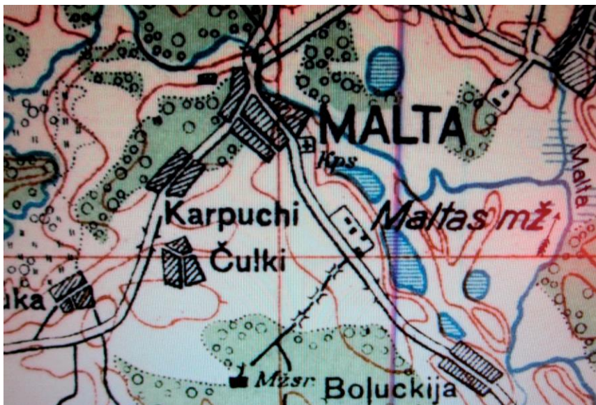
Местечко Малта и усадьба имения на топографической карте 1930-х годов. Квадратиками обозначены дома хозяев хуторских наделов

Некоторые крестьяне подряжались подвозить из Резекне и станции Антонополь различные товары в еврейские магазины и лавки в Малте и Боровой. Женщины нанимались в богатые еврейские семьи прислужкой.