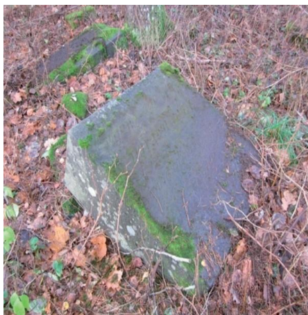
Apgāztais kapakmens uz Janovsku kapenēm. 2012.gads

2021. gadā Silmalas pagasta valdes vadībā izdevās notīrīt un uzstādīt šis kapakmens, bet krusts nebija saglabājies. Plāksnes otrajā pusē lasāma pagara epitāfija (uzraksts) poliski.