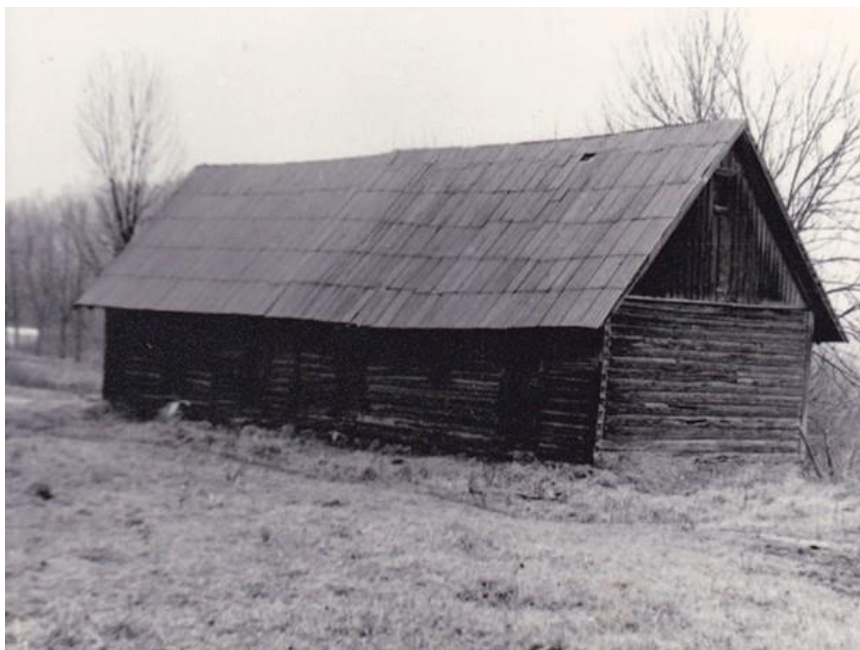
Деревянный амбар, в котором хранили зерно. Фото конца 1970-х годов.

Кое-что от бывшей усадьбы сохранилось и до настоящего времени.