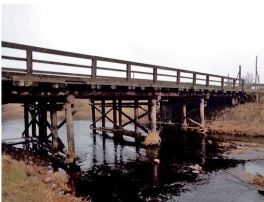
Примерно так выглядел мост через реку Малта при местечке Малта

После отмены в России крепостного права (пригона) в 1861 – 63 годах в имении Малта от крепостной зависимости подлежали освобождению 68 крестьян. В это время все уезды Витебской губернии были распределены на участки, каждый участок на волости, а волости на сельские общества. Имение Малта располагалось на территории Розентовской волости