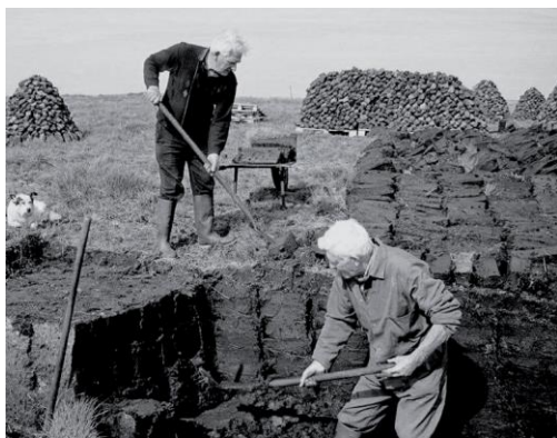
Так производилась ручная резка и сушка торфа

Чтобы обеспечить, разрушенное войной народное хозяйство, хоть каким-то топливом, Правительством республики было принято решение начать добычу торфа. Это решение коснулось и нашей местности. Для добычи кускового топливного торфа на небольших торфяных болотах, уже в 1946 году, был образован Силмалский торфозавод, дирекция которого находилась в Силмале