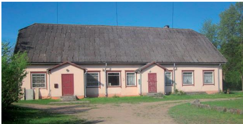
Здание бывшего заводоуправления Силмалского торфозавода, (немного перестроенное в 1980-е – 90-е годы).

В середине 1950-х годов в Силмале было построено новое здание, где размещалась дирекция торфозавода и семейное общежитие для работников торфозавода.