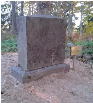
Восстановленная плита. 2021 год

В 2021 году, при содействии руководства правления Силмалской волости, удалось очистить и установить на постамент поваленную плиту, к сожалению, с уже поломанным крестом. На обратной стороне плиты сохранилась большая эпитафия на польском языке, прочесть которую пока не удалось.