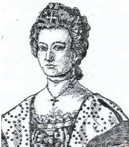
Констанция Бениславская (1746 -1806)

Констанция Бениславская считается одной из выдающихся польских поэтесс 18-го века. Издано 3 сборника её стихов. Первый сборник «Песни, напетые для себя» был издан в Вильно в 1776 году. Стихи Бениславской переиздаются и в современной