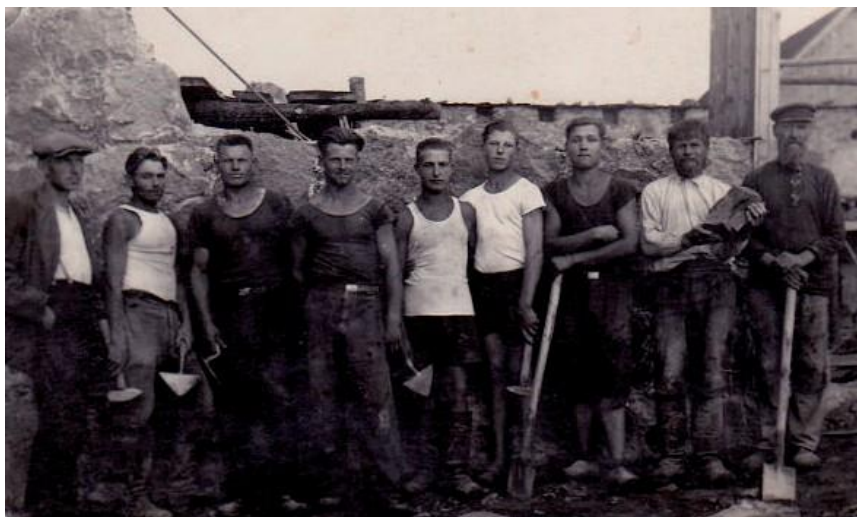
1936. gads. Celtnieku brigāde no Čulku un Danilovkas ciemata Madonas novadā

Pēc Latvijas neatkarības iegūšanas tika slēgta robeža ar Krieviju, un nevarēja “iet burlakos”, tas ir, gūt Krievijā papildus peļņu. Tagad pārvietoties varēja tikai Latvijas valsts robežās. Tomēr, izmītinot lauku iedzīvotājus viensētās, radās liela vajadzība pēc būvdarbiem. Valdība šajos gados piešķīra zemniekiem subsīdijas lauksaimniecības ēku (šķūņu, klēšu) celtniecībai no laukakmens, tāpēc mūrnieki bija pieprasīti. Vīrieši no apkārtnējiem ciematiem pulcējās būvbrigādēs un ar savām prasmēm bija pieprasīti arī citos Latgales apriņķos.