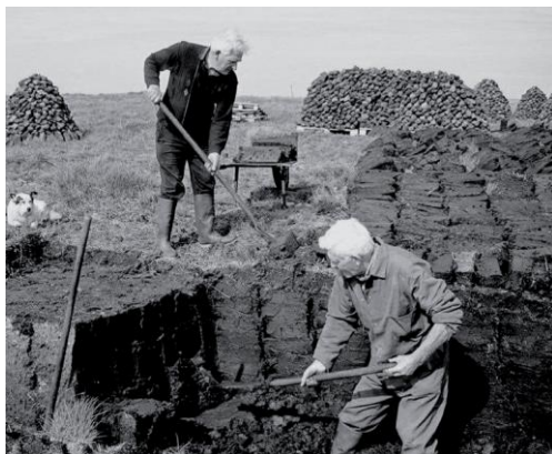
Tā notika kūdras rakšana un žāvēšana

Atkal dzīve Silmalā viesa cerības. Tika darīts viss, lai atjauno-