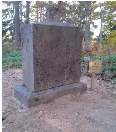
Atjaunotais kapakmens. 2021. gads.