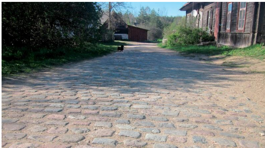
Часть сохранившейся брусчатки в теперешней Силмале

Чтобы в осенне-весеннюю распутицу можно было без проблем подвозить товары к магазинам и лавкам дорога, проходящая через местечко, от школы и до моста через реку Малта, была вымощена брусчаткой.