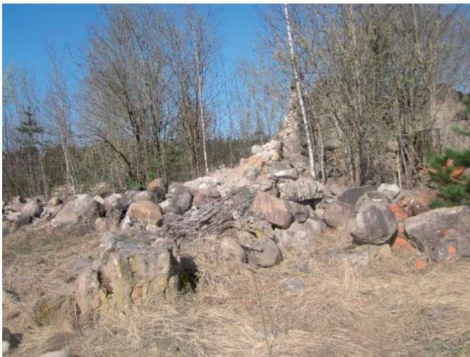
Viss, kas palicis pāri no dzirnavām Silmalā

dzirnavas tika pielāgotas tehnikas remonta darbnīcām, bet, no 1990. gadiem, tām nebija īpašnieka un darbnīcas pakāpeniski aizgāja bojā, protams, ne bez vietējo iedzīvotāju " palīdzības".