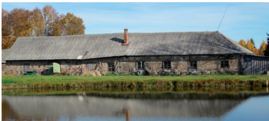
Скотный двор, сохранившийся до наших дней

Вдоль дороги был высокий забор со столбами из красного кирпича и красивые кованые ворота. В парке, возле дороги, находилась небольшая круглая каплица. Возле дома был устроен большой погреб-ледник, где хранились продукты. На берегу Глухого озера была построена большая оранжерея, где выращивали ранние овощи и цветы. За озером, на краю заливных лугов, долгое время, до 1970-х годов, стоял большой сарай, в котором хранили скошенное сено. В народе этот сарай называли “панская пуня”.