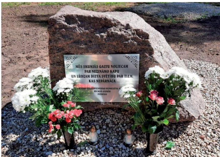
Tiem, kas nepārnāca... (represētajiem un bojā gājušajiem Silmalas pagasta iedzīvotājiem (1940 - 1949 gadā))