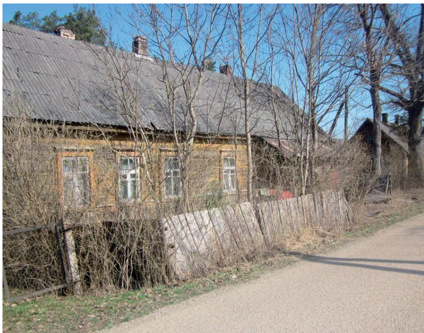
Еврейские дома сохранившиеся до наших дней