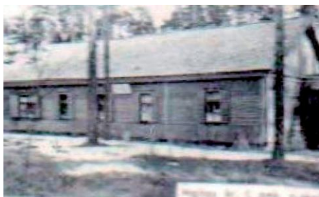
Так выглядела школа в те годы

В 1907 году, в деревне Чулки была открыта 3-х годичная народная школа, где обучались грамоте дети крестьян близлежащих деревень. Первоначально школа размещалась в двух комнатах крестьянской избы. Со временем школа в Чулках уже не вмещала всех учеников и в 1918 году её перевели в местечко Малта, разместив в здании, принадлежавшем