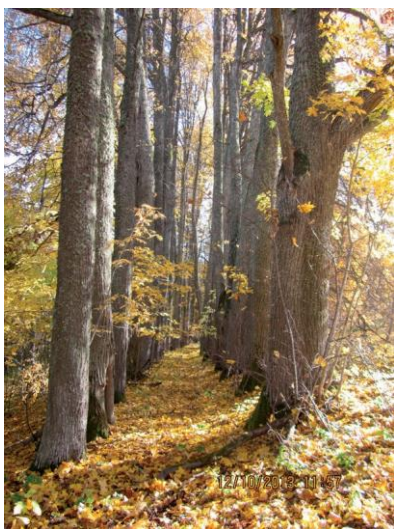
Липовая аллея, существующая в наши дни. Возраст деревьев – более ста лет

В усадьбе проживали: прислуга, садовник, кучер с семьёй, кухарка, няня и другие работники. В отдельных строениях проживало несколько семей безземельных крестьян – староверов. Всего в усадьбе в это время проживали 31 мужчина и 38 женщин.