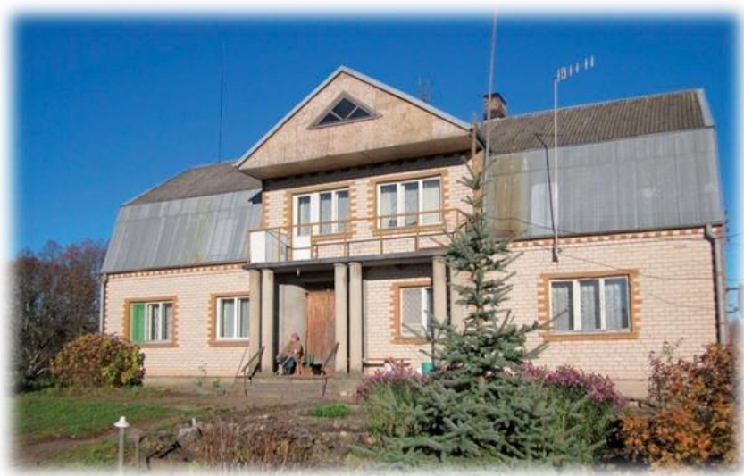
Māja, kas būvēta vecās muižas vietā