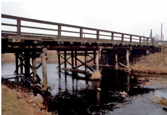
Tāds pavērās skats uz Maltas upes tiltu

Pagasta tiesai tika izvēlēti divi pārstāvji no katras lauku sabiedrības, tā Rozentovas pagasta tiesā darbojās 6 cilvēki un pagasta vecākais.