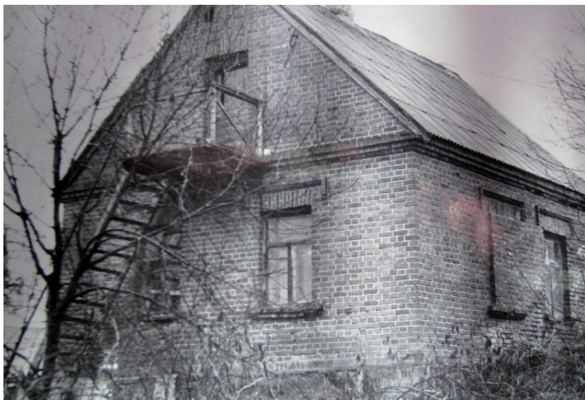
Вид кирпичной пристройки в 1980-е годы