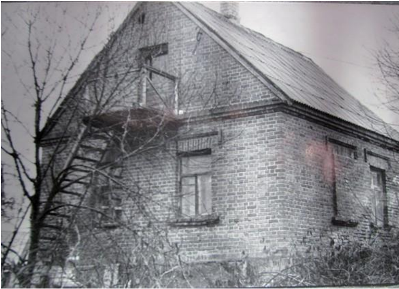
Ķieģeļu piebūve 1980. gadā