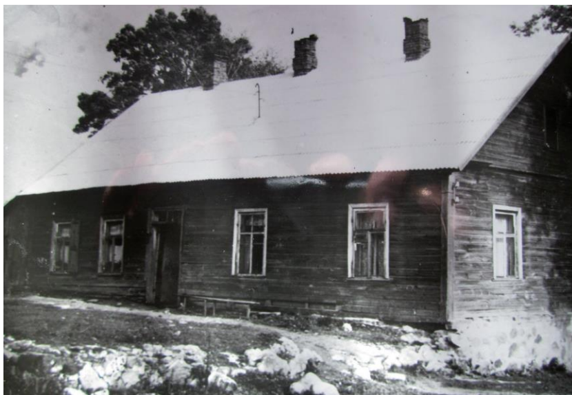
Так выглядели остатки барского дома в начале 1980-х годов