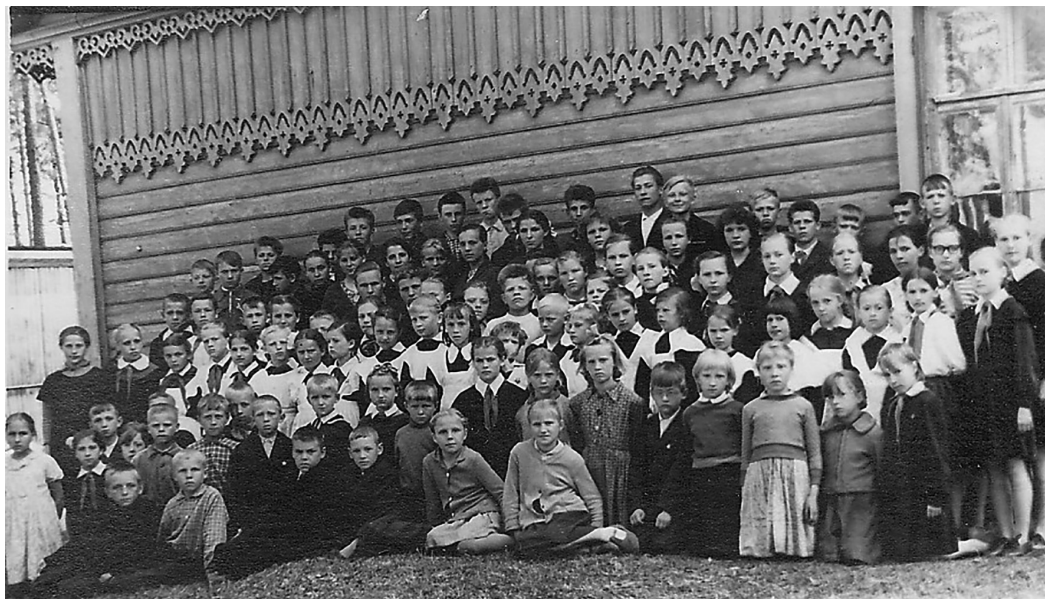
1963. gads. Sīlmalas 8-gadīgās skolas audzēkņi pie vecās skolas ēkas

Brīnišķīgi vārdi! Daudzi zem tiem varētu parakstīties.