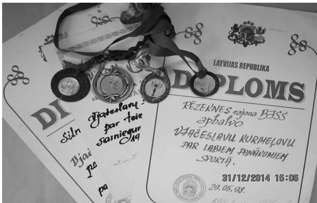
Заслуженные спортивные награды