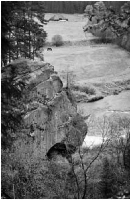
На переднем плане расположен утес «Звартес иезис». На заднем плане – лужайка, где стояли палатки участников туристического слета.

Республиканский туристический слет, в котором участвовала команда Силмалской школы, проводился в Цесисском районе, на живописном берегу реки Амата, у знаменитого утеса «Звартес иезис».