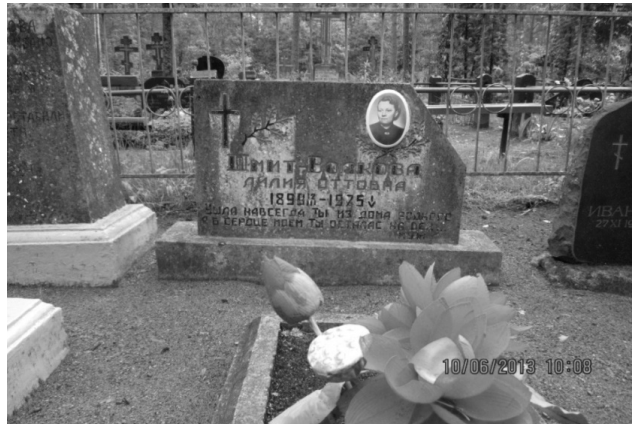
Надгробие на могиле Л. О. Шмит