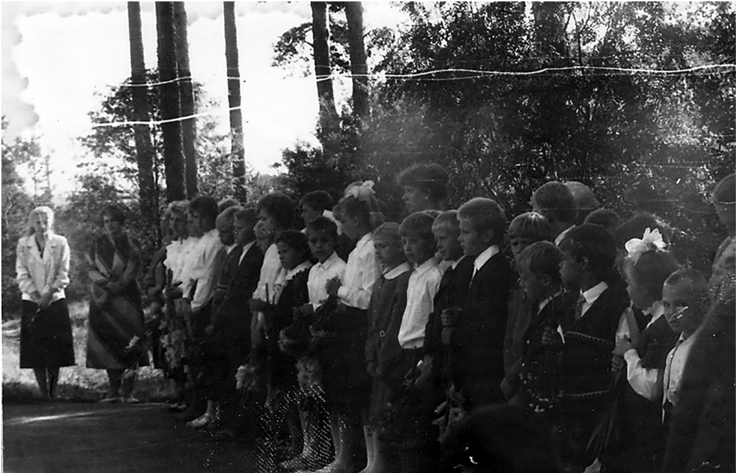
1991. gada 1. septembris. Pēdējais mācību gads vecajā Silmalas skolā Silmalas pamatskola

Tā kā šajos gados skolā mācījās 50–60 skolēnu, pēc skolas direktores H. Demčukas uzstājīgā un pamatotā lūguma Silmalas pagasta vadība pieņēma lēmumu pārcelt skolu uz Gorņicu, uz jaunā bērnu dārza ēku. Šim nolūkam tika veikti lieli sagatavošanās darbi – pārbūvētas un aprīkotas telpas klasēm.