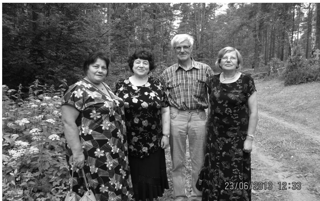
2013 год. С одноклассниками, 52 года спустя после окончания Силмалской школы

Родился в 1947 году в деревне Балюцкие, в то время Презменского сельсовета Малтского района, в многодетной семье. В 1954 году, в неполные семь лет, начал учиться в Силмалской 7-летней школе. О школе остались хорошие и светлые воспоминания, хотя в учебе слегка не догонял, как говорит теперешняя молодежь, т.е. отличником не был. В 1961 году школу переводили на 8-летнее образование и нужно было продолжать учёбу в восьмом классе. Но местному Силмалскому торфозаводу нужны были специалисты и меня, как сына работника этого завода, после седьмого класса направили на учебу в Рижский индустриальный политехникум, где пришлось сдавать вступительные экзамены. К своему удивлению экзамены выдержал и, в 1965 году получив диплом об окончании техникума, начал работать на торфозаводе. С 1966 года по 1969 год служба в Советской Армии, а затем снова работа на торфозаводе. В 1970-м году в Резекне открылся филиал Рижского политехнического института, куда и поспешил поступить на заочное отделение. С 1971 года жил и работал в Риге. По окончании института, в 1977 году, работал инженером на заводе торфяного машиностроения, а с 1980 года служащим в различных управленческих учреждениях. В 1992 году, вместе с семьёй, вернулся в родную деревню, в родительский дом. С 1994 по 2017 годы работал на местных деревообрабатывающих предприятиях. Сейчас на пенсии и, чтобы не скучать, изучаю историю родного края. Женат, имею двух сыновей, трех внуков и правнука.