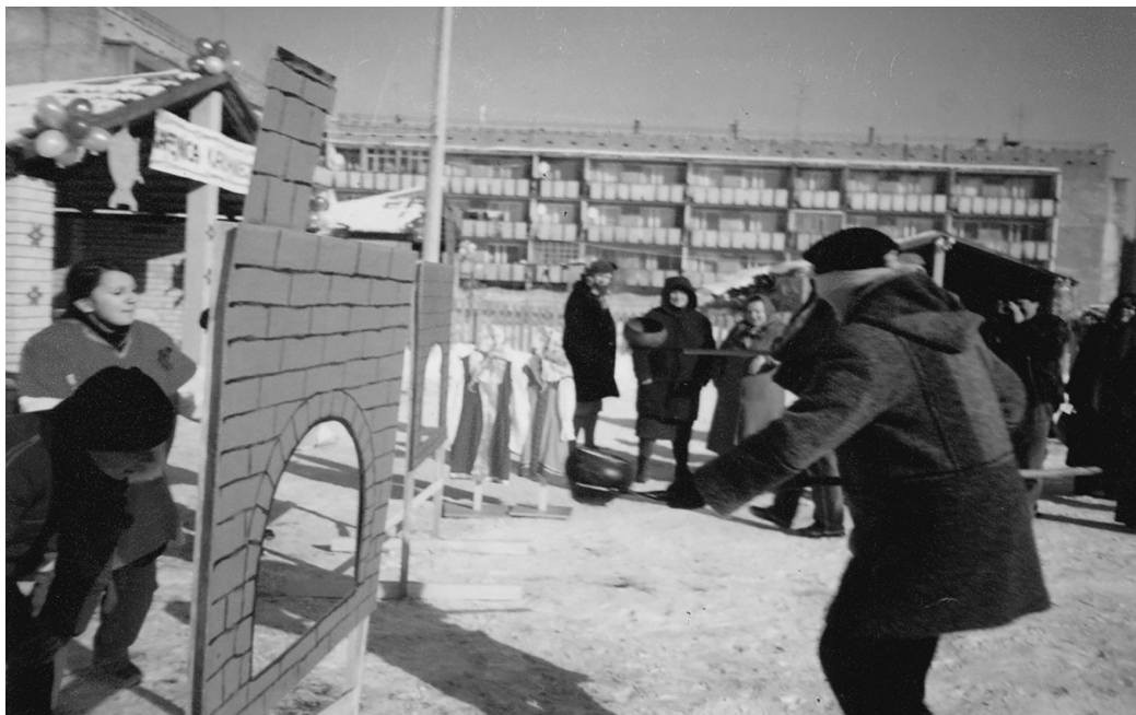
Projekts „Kopīgi svētki – dažādu tautu kultūru vienojošais spēks”. Masļeņicas svinības Silmalas pamatskolas pagalmā