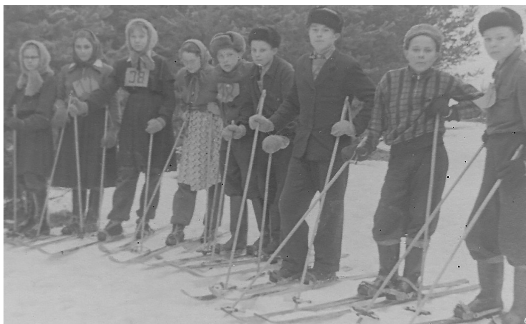
Зима 1959 года. 6-й класс на уроке физкультуры.