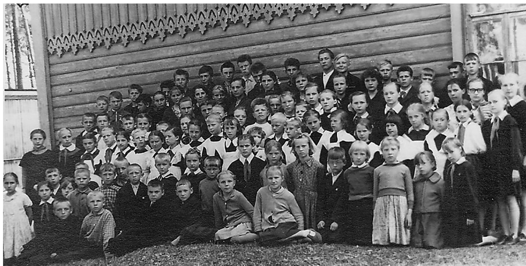
1963 год. Ученики Силмалской восьмилетней школы у старого здания школы.