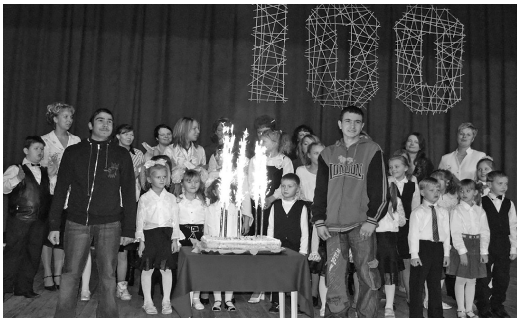
Sveiciens skolai no skolēniem