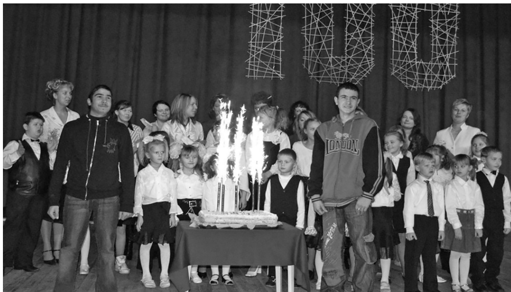
Поздравление от учеников школы.