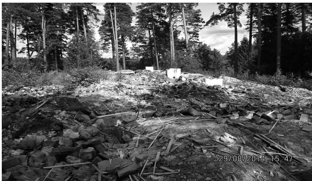
2014 год. Здесь когда-то стояло двухэтажное здание школы.

Задумайтесь – сколько же бывших учеников Силмалской школы стали труженниками заводов и фабрик, учителями и врачами, колхозниками и строителями, бухгалтерами и продавцами, музыкантами, лесоразработчиками, работниками культуры и т. д. Многие из них, как и школа, пережили войну, смену трех общественно-экономических формаций. Знания же, полученные в школе, помогли им достойно идти по жизни.