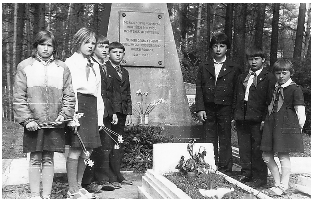
9. maijā, Uzvaras dienā, Silmalas skolas pionieri Garkalnos pie padomju karavīru kapa obeliska, kuri krituši nevienlīdzīgā cīņā ar fašistu uzbrucējiem 1941. gada jūnija beigās