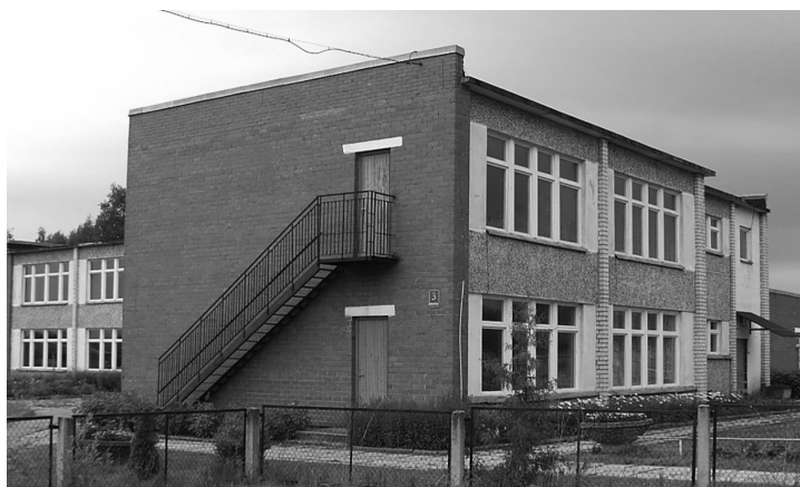
Новое здание школы в Горнице