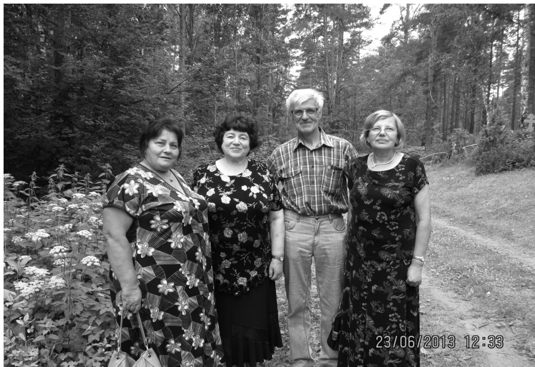
2013. gadā kopā ar klasesbiedrenēm 52 gadus pēc Silmalas skolas absolvēšanas

Esmu dzimis 1947. gadā Baļucku ciemā, tolaik Maltas rajona Prezmas ciema padomē, daudzbērnu ģimenē. 1954. gadā, nepilnu septiņu gadu vecumā, uzsāku mācības Silmalas septiņgadīgajā skolā. Par skolu man palikušas gaišas atmiņas, kaut gan mācībās dažkārt “ nerubīju ”, kā mēdz teikt mūsdienu jaunieši, t.i., nebiju teicamnieks. 1961. gadā skolā ieviesa astoņu gadu izglītību, un bija jāturpina gaitas 8. klasē. Taču Silmalas kūdras fabrikai bija vajadzīgi speciālisti un mani kā šīs ražotnes darbinieka dēlu pēc 7. klases norīkoja studēt Rīgas Industriālajā politehnikumā, kur bija jākārtoti iestājesāmenī. Pašam par izbrīnu, iestājārbaudījumus izturēju, un 1965. gadā, iegūstot diplomu par tehnikuma absolvēšanu, sāku strādāt kūdras fabrikā. No 1966. līdz 1969. gadam pildīju obligāto militāro dienestu Padomju armijā, pēc tam atgriezos darbā kūdras rūpnīcā. 1970. gadā Rēzeknē atvēra Rīgas Politehniskā institūta filiāli, kurā pasteidzoties iestāties neklātienas nodaļā. No 1971. gada dzīvoju un strādāju Rīgā. Pēc institūta absolvēšanas 1977. gadā sāku strādāt par inženieri Kūdras mašīnbūves rūpnīcā, no 1980. gada biju dažādu pārvaldes iestāžu darbinieks. 1992. gadā kopā ar ģimeni atgriezoties dzimtajā ciemā, vecāku mājā. No 1994. līdz 2017. gadam strādāju vietējos kokapstrādes uzņēmumos. Pašlaik esmu pensionārs un, lai negarlaikotos, pētū dzimtajā novada vēsturi. Esmu precējies, ir divi dēli, trīs mazbērni un mazmazdēls.