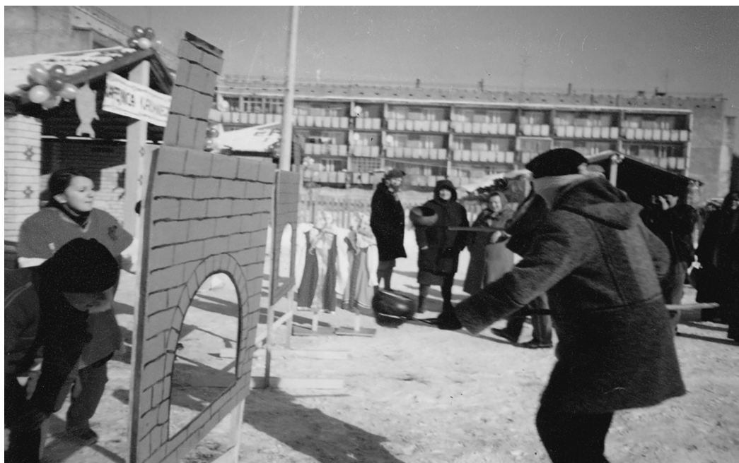
Проект «Общие праздники – объединяющая сила народов разных культур». Проведение Масленицы во дворе Силмалской основной школы.