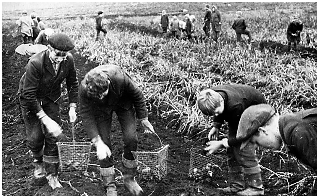
1983 год. Школьники на уборке картофеля с колхозных полей.

Летом школьники работали на прополке и прореживании свеклы, а осенью оказывали помощь в уборке картофеля.