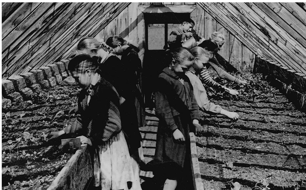
Школьники за работой в теплице.

Сначала весь собранный урожай реализовывался, и школа зарабатывала