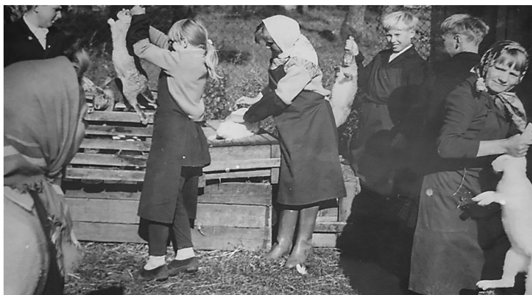
Школьники ухаживают за кроликами.