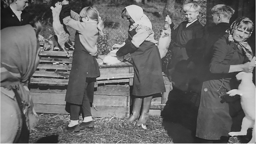
Skolēni apkopj trušus