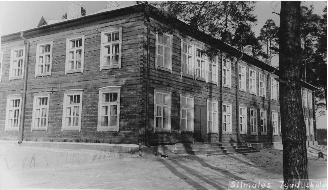
1959. gada 1. septembrī durvis vēra jaunā divstāvu skola

Skolēni aktīvi piedalījās makulatūras un metāllūžņu vākšanā. Protams, mājās makulatūras skolēniem tolaik bija maz, bet metāllūžņus no apkārtējiem laukiem un saimniecībām savāca daudz. Nesa visu, ko varēja pacelt un atvilkt līdz skolas pagalam. Vienreiz atrada un atnesa uz skolu ne-