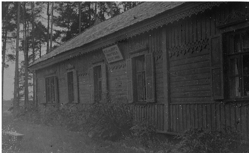
Такой была старая школа

Со временем количество учеников увеличивалось - школа в Чулках уже не вмещала всех учащихся, и в 1918 году ее перевели в деревню Малта (современное название - Силмала). Деревня Малта в те времена была типич-