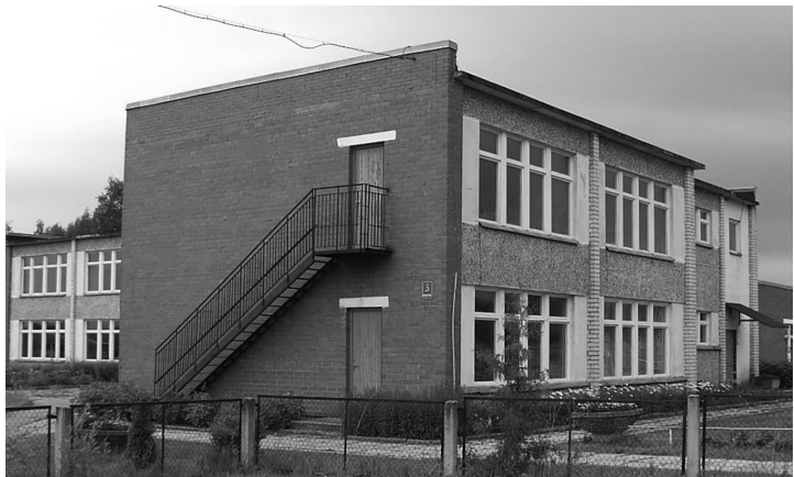
Jaunā skolas ēka Gorņicā

Šajā laikā skolā ievērojami uzlabojās mācību procesa tehniskais aprīkojums. Parādījās daudz dažādu mācību palīgīdzekļu, projektoru un kodoskopu, kas palīdzēja skolotājiem efektīvāk un interesantāk vadīt mācību stundu. Uz skolu nāca