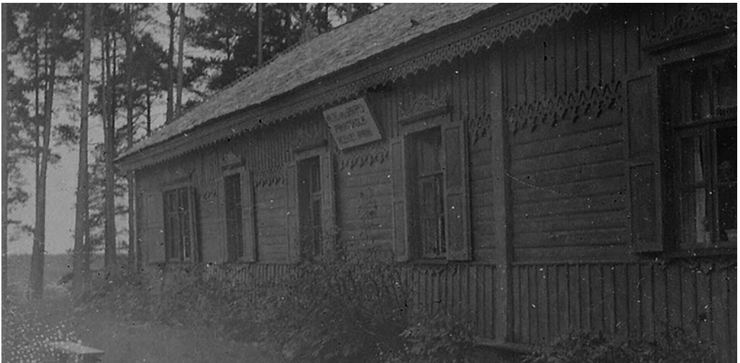
Tāda izskatījās vecā skola