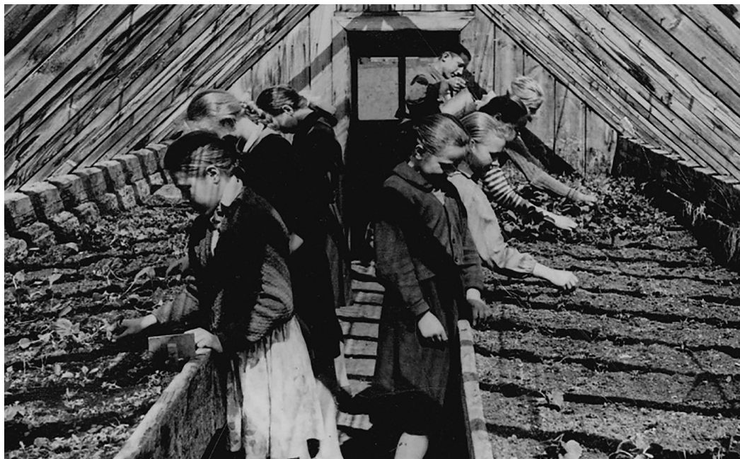
Skolēni darbā siltumnīcā

Darbi skolas lauciņā nebeidzās arī vasaras brīvdienu laikā. Katram skolēnam brīvdienu laikā, ievērojot grafiku, tajā bija jānostrādā noteikts dienu skaits, kas, protams, ne vienmēr tika izpildīts. (Ne visiem taču gribējās vasarā, karstumā iet uz skolu, turklāt vēl arī strādāt.)