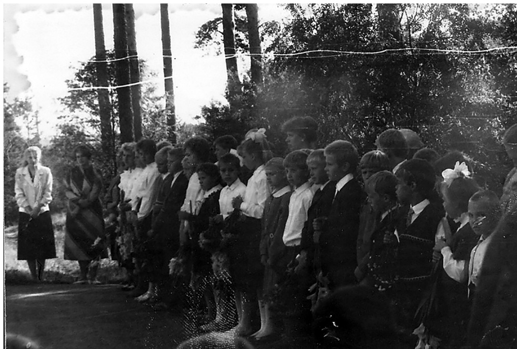
1 сентября 1991 года. Начало последнего учебного года в старой Силмалской школе.

В конце 80-х годов колхоз «Силмала» построил большое современное здание для колхозного детского сада. Но в связи с политическими и экономическими изменениями, произошедшими в стране в начале 1990-х годов, это здание полностью не использовалось. Колхоз распался, средств на содержание детского сада у него не было, да и детей в садик родители не хотели отдавать, так как не все могли за него заплатить.