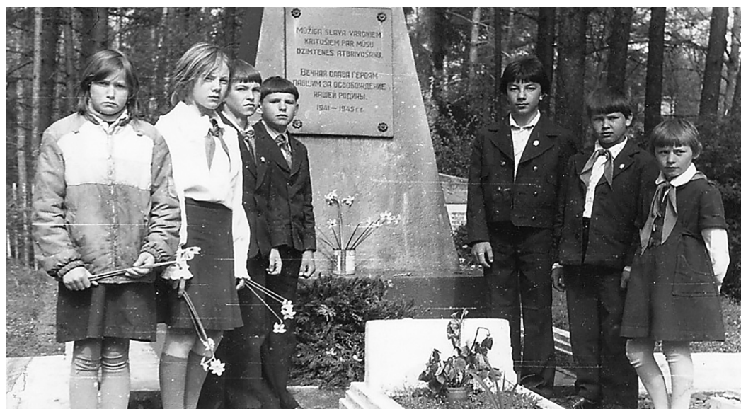
В День Победы - 9 мая. Пионеры Силмалской школы в Гаркалны, у обелиска на могиле советских бойцов, павших в неравном бою с фашистскими захватчиками, в конце июня 1941 года