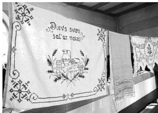
Dievnama sānu jomā iekārtota rokdarbu izstāde.