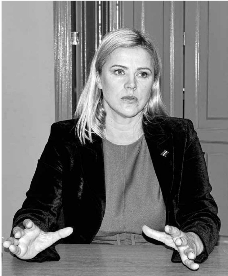
„Kuldīgā jums ir tāds fantastisks Latvijas minimodelis, kurā daudzi gribētu dzīvot. Tāpēc te var vilkt paralēles ar valdības darba nostādņēm,” secina Ministru prezidente Evika Siliņa.

Salīdzinot ar iepriekšējo, kad biju labklājības ministre, varu teikt, ka ir koleģiālāka izpratne vienam par otru un par darbu, ir vēlme darīt. Tas ir liels pluss atšķirībā no iepriekšējā Ministru