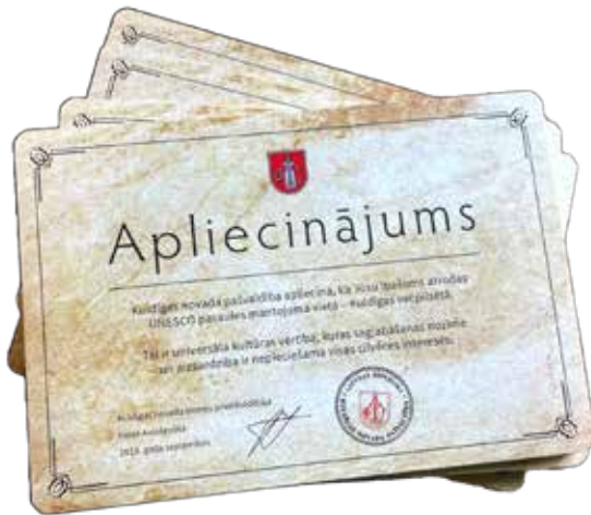
Kuldīgas novada pašvaldības apliecinājums vecpilsētas īpašumu unikālajai nozīmei.