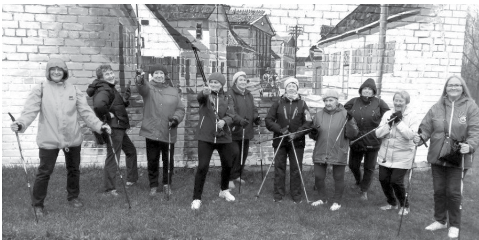
Kuldīgas senioru skolas dalībnieces izmanto iespēju mācīties un kustēties un savā attīstībā neapstājas.