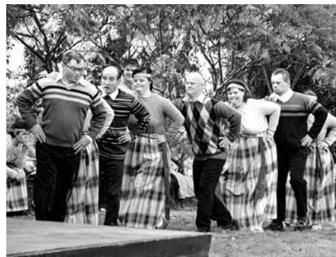
Uzstājas Gudenieku sociālās aprūpes centra deju kolektīvs Dzirkstelīte .