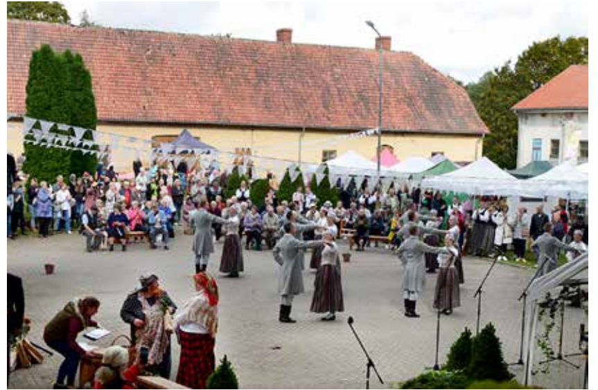
Alsungas pils pagalmā sestdienas rīta pusē valdīja tirgošanās, uzstājās dziedātāji un dejojāji. Attēlā – Jaunmārupes vidējās paaudzes deju kolektīvs Krustu šķērsu .