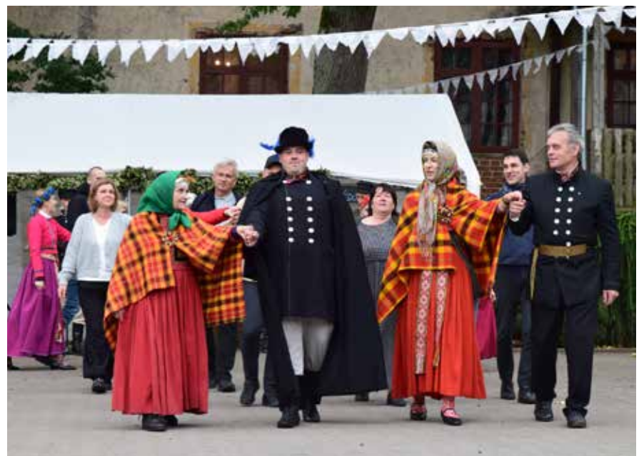
Pasākumu atklāja polonēze. Tajā piedalīties varēja visi, kas bija sanākuši un gribēja būt daļa no senā galma.

Mises laikā arī tika iesvētīts Alsungas baznīcas jaunais zvans.