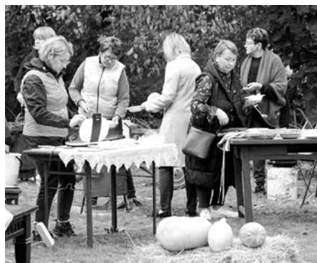
Lauka virtuvē pie kočas katla un pankūku pannas rosās Kuldīgas Sv. Annas draudzes saimnieces.