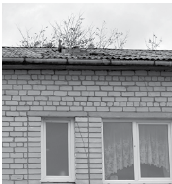
Skurstenis nojaukts līdz jumtam.

„Ar apsaimniekotāju bija runa par skursteņa remontu. Saprotu, ka rinda ir gara un remontētāju trūkst. Pirms trim nedēļām atveda četru kubikmetru konteineru, kurā glabājas līdz jumtam nojauktā skursteņa būvgruži. Iedzīvotājiem tika teikts, ka skurstenis ir lietojams, es gan to apšaubu. Konteinerā glabājas labi ja kubikmetrs ar ķieģeļiem, un tā tas pie mājas stāv. Pēc nedēļas tika uzlikta stalažas, un ar to viss beidzās. Pagājušonedēļ nenotika nekas. Konteiners gan jau tiek noņemts no Kuldīgas komunālajiem pakalpojumiem (KPP). Tas maksā 161 eiro uz piecām dienām.