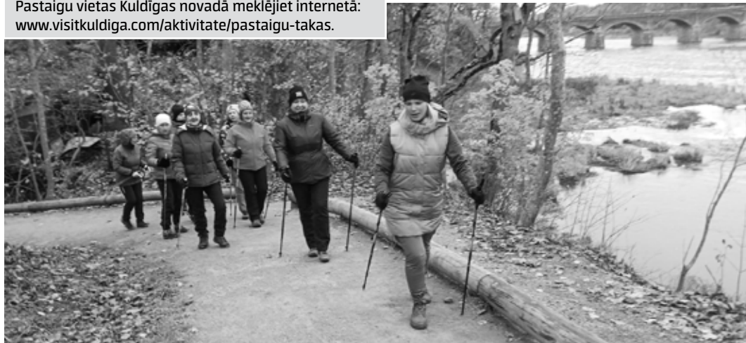
Nūjotāju grupa Kuldīgas pastaigu taku pie Ventas izmanto nodarbībām ziemā un vasarā gan gaišā, gan tumšā laikā.

Pastaigu vietas Kuldīgas novadā meklējiet internetā: www.visitkuldiga.com/aktivitate/pastaigu-takas .