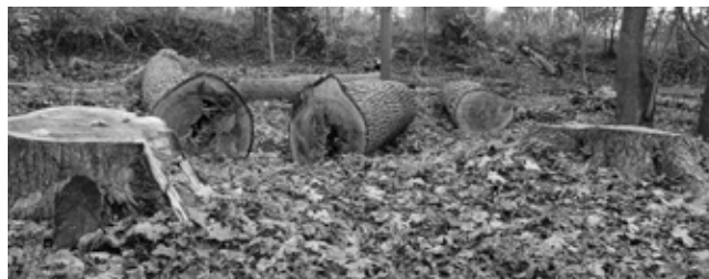
Nozāģēti pāraugušie koki.

To mums jau ir jautājuši, un pārvietojamo tualeti esam novietojusi takas vidū pie Vienības ielas, kur ir arī stāvlaukums. Tā tiek uzturēta kārtībā, un to var izmantot. Garāmejojot to var redzēt un pamanīt. Par norādēm varam padomāt.