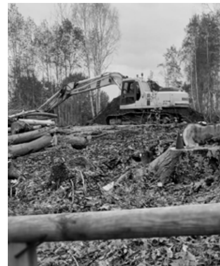
Darbs vēl turpinās.

Top novērošanas tornis otrā Ventas krastā. Tiek projektēta taka no Mākslas dienu parka (Akmens un Kaļķu ielas krustojumā) līdz Melnajai kolkai pilskalnā.