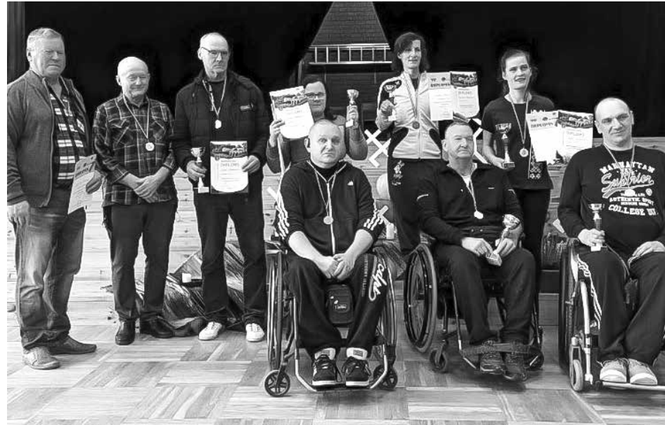
Novusa sacensību uzvarētāju apbalvošana Alsungā.

No 17 dalībniekiem bez mājiniekiem startēja arī novusisti no Tukuma un Jelgavas.