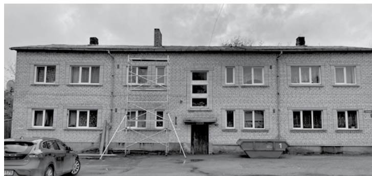
Rumbas pagastā pie daudzdzīvokļu mājas Abavas ielā 2 stāv konteiners ar nojauktā skursteņa būvgružiem, kā arī stalažas.

Rēķinu, ka tas stāv par 30 eiro dienā. Domāju, ka to nemaksās ne apsaimniekotājs, ne skursteņa remontētāji, – gan jau nāks no mūsu naudas. Kad apsaimniekotāju vēl varēju sazvanīt, viņš teica, ka tas ir „tāmē iekšā”. Ko tas nozīmē, ja konteiners izmantots tikai vienu