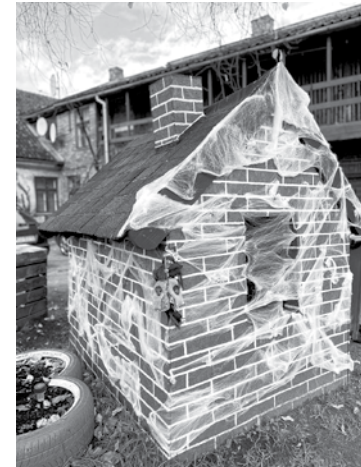
Pērnā gada rotājumus papildina mājiņa zirnekļu tīklos un lidojoša raganiņa.