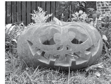
Helovīnam Liepkalnu ģimene sētu otro gadu rotā ar pašu grebtiem ķirbjiem, kuros ieliktas lampiņas.

Pie ieejas ķirbis ar konfektēm – Visu svēto naktī atnākušie bērni var cienāties.