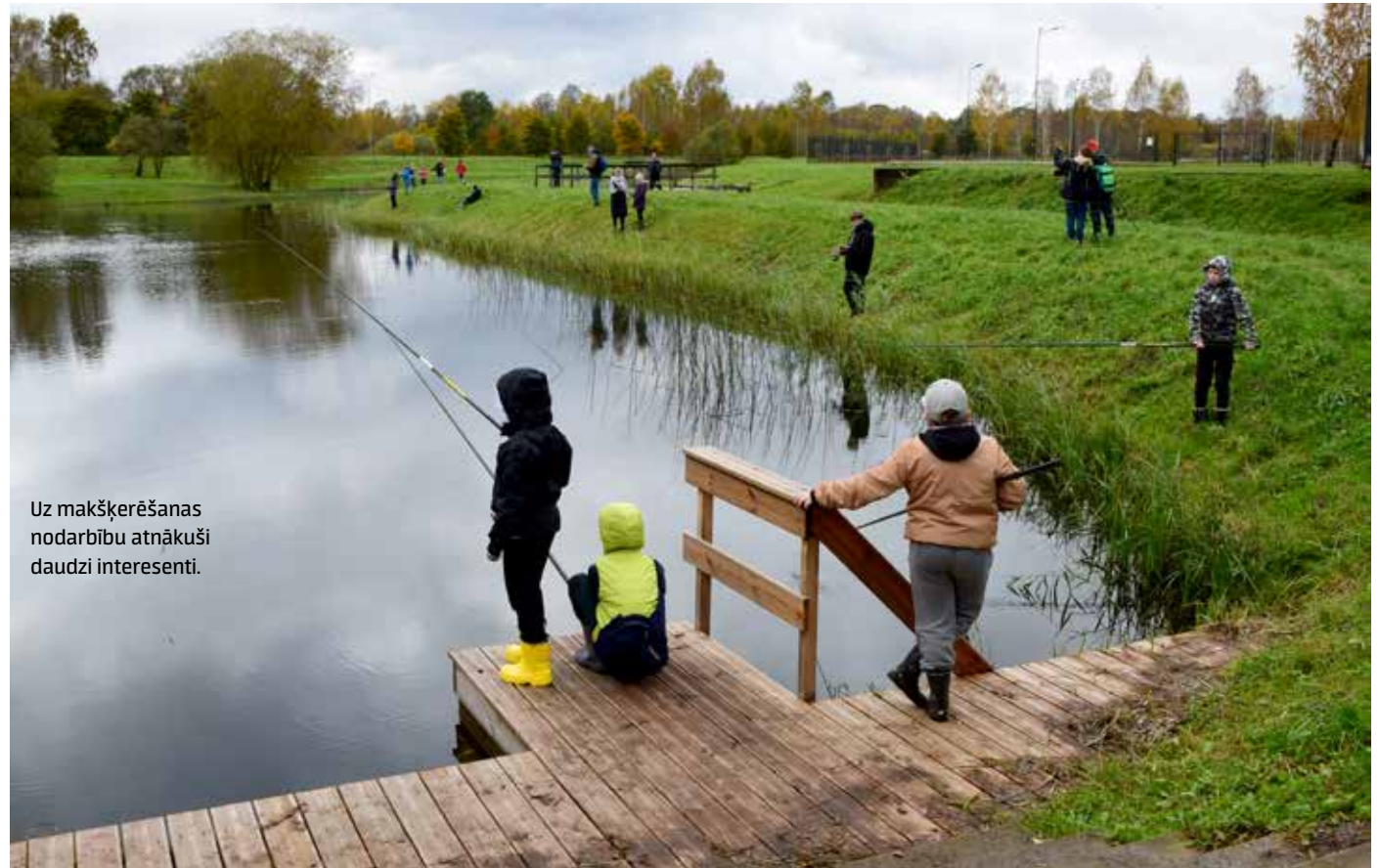
Uz maksšķerēšanas nodarbību atnākuši daudzi interesenti.