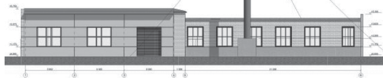
Katlumāja tiek pārbūvēta pēc SIA Efekta projekta.

Rudbāržu katlumājā, kurā līdz šim izmantota dabasgāze, notiks vērienīga pārbūve. Pēc tam varēs lietot kā šķeldu, tā gāzi, izvēloties to, kam izdevīgāka cena. Būvniecība tūlīt sāksies, taču apkures katls turpinās darboties, lai nodrošinātu siltumu tām ēkām, kas centrālajai apkurei pieslēgtas.