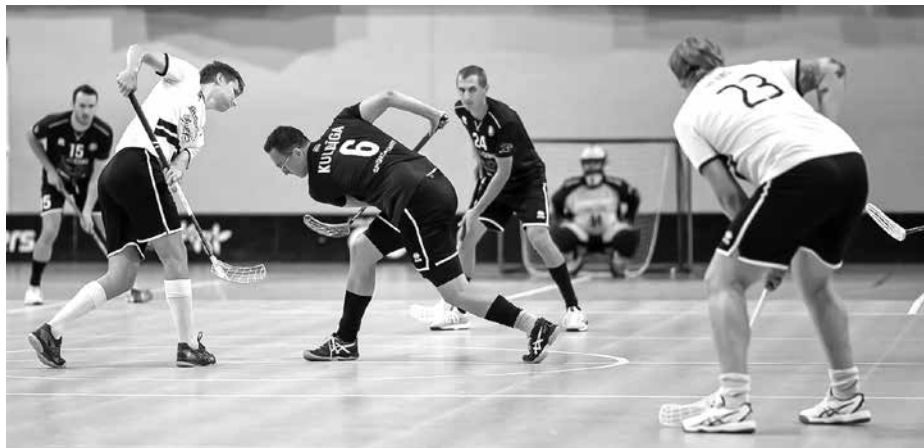
Kuldīdznieki cīnās Latvijas florbola čempionāta 1. līgā.