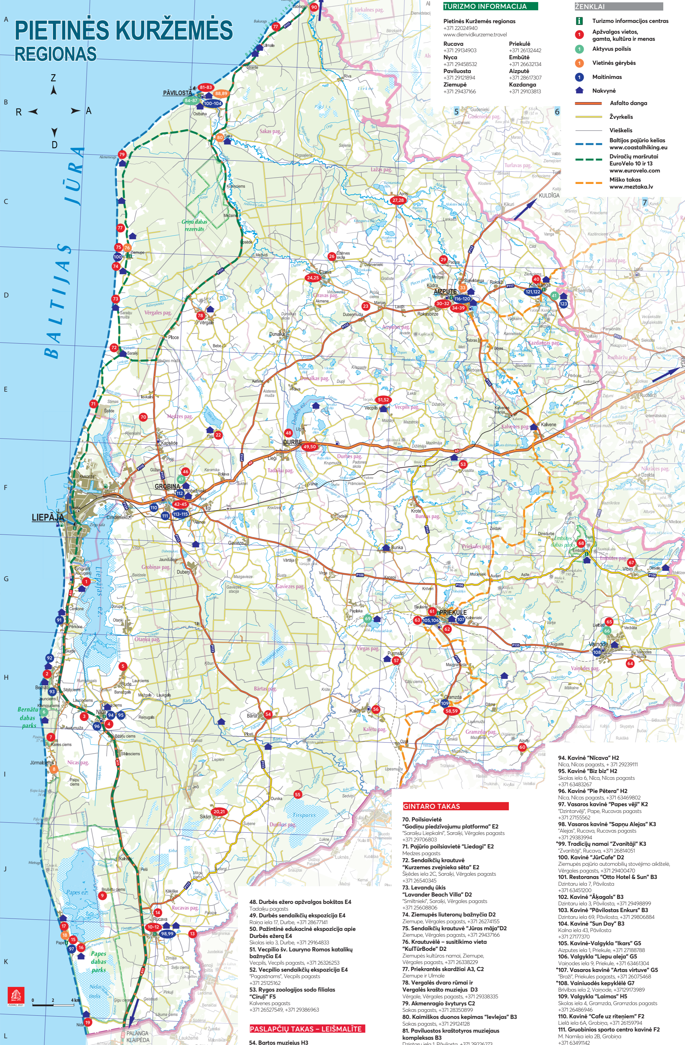
0 2 4 km