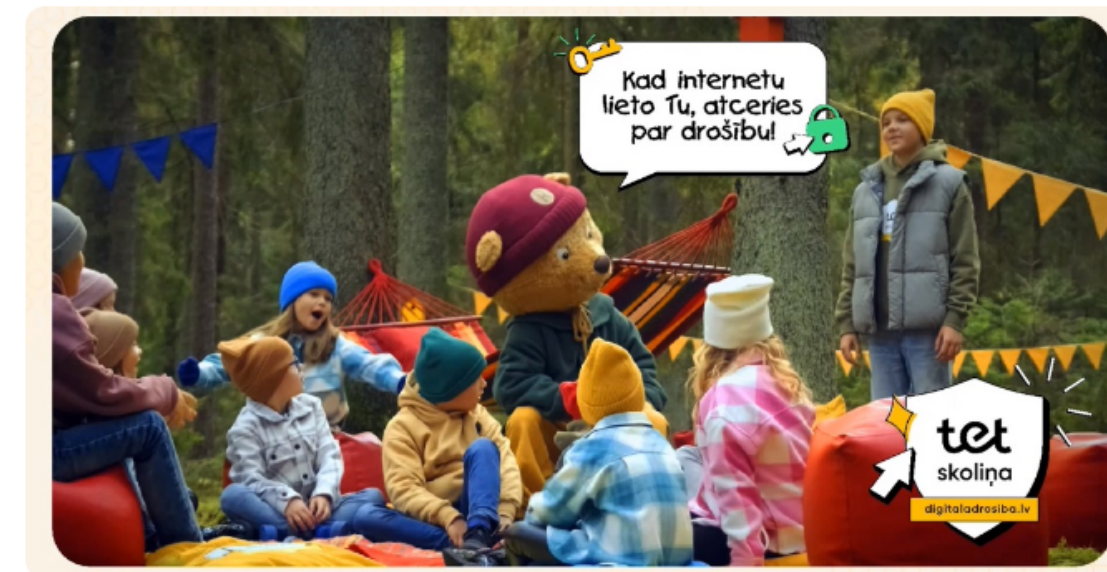
Tet skoliņas publicitātes plakāts