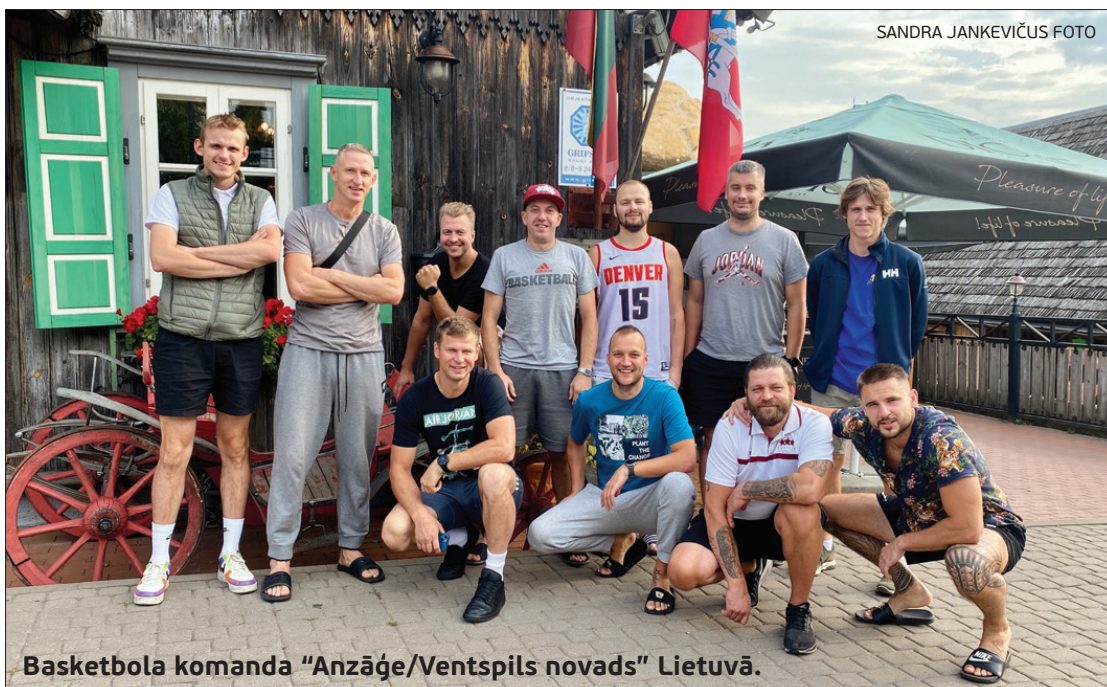
Basketbola komanda "Anzāģe/Ventspils novads" Lietuvā.

Lietuvas pilsētā Traķos, Olimpisko sporta veidu bāzē, 23. un 24. septembrī norisinājās divu kaimiņvalstu basketbola turnīrs.