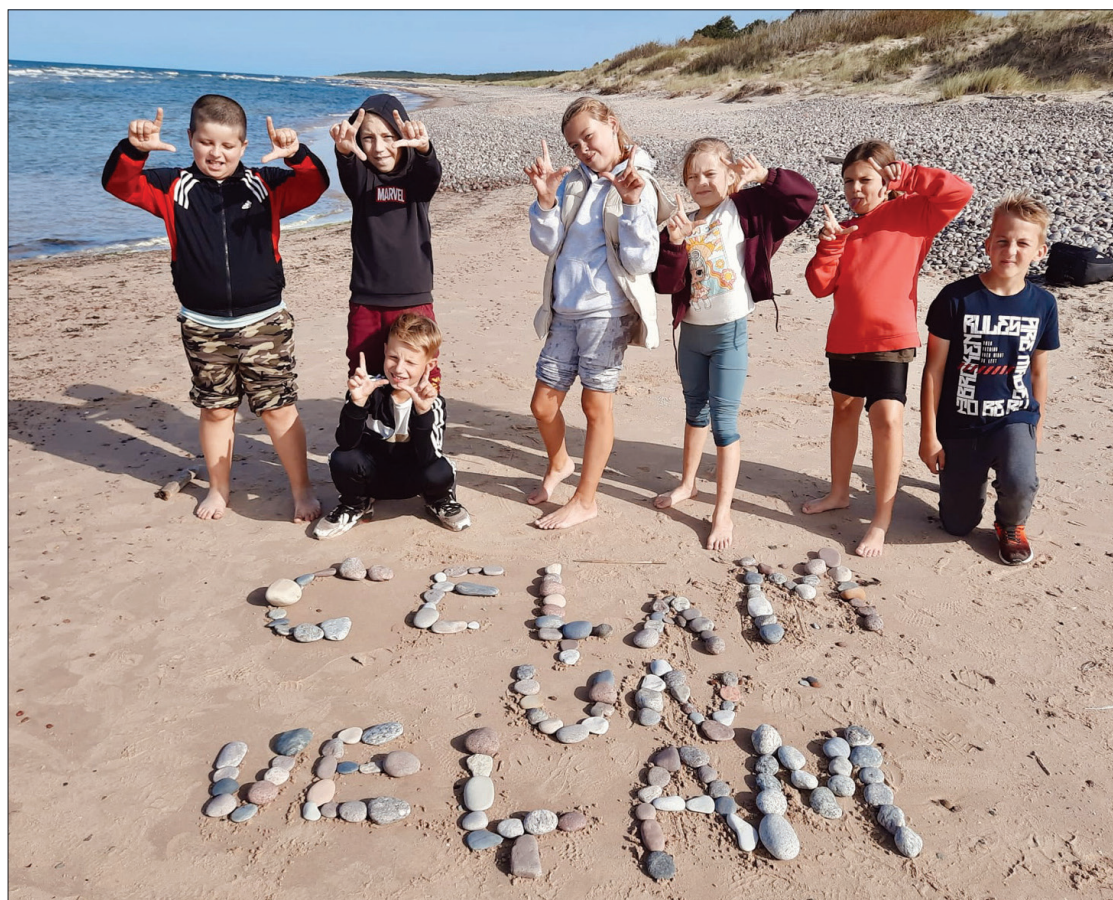
4. klase pārgājienā pie izveidotās devīzes no dabas materiāliem.

6. klase un daži 5. klases skolēni piedalījās "Latvijas valsts mežu" rīkotajā meža ekspedīcijā. Pasākumā skolēni, veicot praktiskus un radošus uzdevumus, uzzināja, ko nozīmē pilns meža apsaimniekošanas cikls. Skolēni noskaidroja, kā aprēķināt koku skaitu jaunaudzē, kā kopt mežu, kā noteikt koku garumu, iemācījās būtēt tiltu bez skrūvēm un naglām u. c. noderīgas lietas.