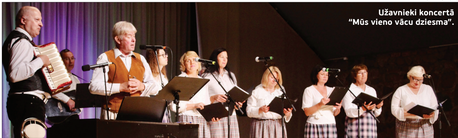
Užavnieki koncertā "Mūs vieno vācu dziesma".

Koncertā piedalījās dalībnieki no Rīgas, Ventspils, Liepājas un Dobeles, no Talsu, Tukuma un Vents-