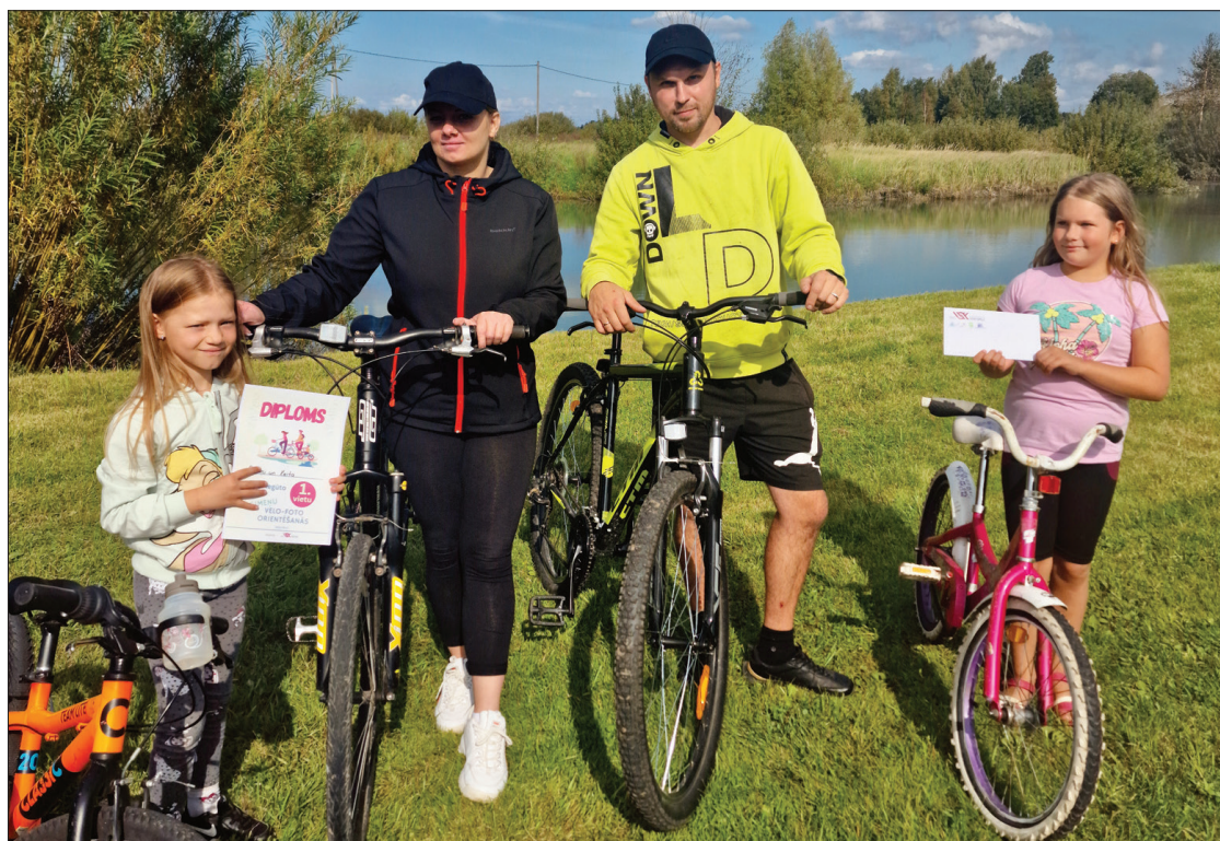
Pirmās vietas ieguvēji. Viņi bez maksas varēs apmeklēt ūdens piedzīvojumu parku Ventspilī.