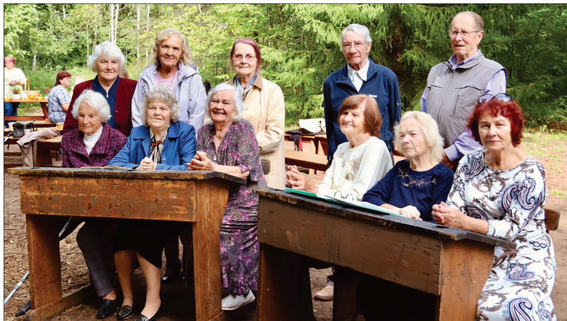
Šīs dāmas un kungi reiz mācījās Ameles skolā, kas dēvēta arī par Puzes II pamatskolu un Pumpuru skolu.

Pirmajā mācību gadā Ameles skolu apmeklēja 12 skolēni, gadu gaitā viņu skaits mainījās, līdz 1956. gadā iestādi slēdza. Skola bija atvērta 93 gadus, un tajā atradās pat cietums, kurā pārdomāt nodarīto varēja vietējie likumpārkāpēji. Ameles skolas jubilejā bieži pieminēja skolotājus Frici un Zentu Pumpurus, jo dzīvesbiedri mācību iestādē nostrādāja 32 gadus. 1891. gadā