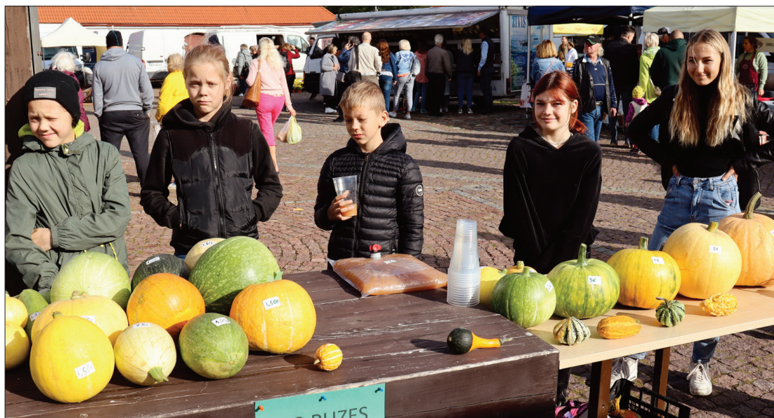
Čaklie mazpulcēni, kad daļa no piedāvājuma jau pārdota.

Ne mazāk iespaidīgs bija novada ļaužu sniegums ķirbju svēšanas sacensībās. Lielākais ķirbis bija Rudais Janka, audzis Ugālē, tā svars sniedzās krietni pāri 70 kg (precīzi neiegaumēju, un zīnu tikai to, ka to audzējis ugālnieks