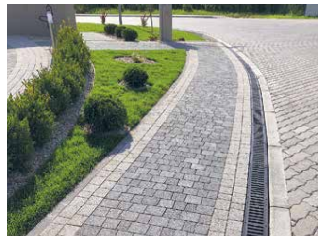
Ar pašvaldības finansiālu atbalstu gadu gaitā daudzi pagalmi kļuvuši ērtāki un sakoptāki.

Par Salaspils novada pašvaldības līdzfinansējuma apjomu un tā piešķiršanas kārtību dzīvojamās mājas teritorijas labiekārtošanas darbu veikšanai vairāk iespējams lasīt saistošajos noteikumos: https://salaspils.lv/lv/node/193 .