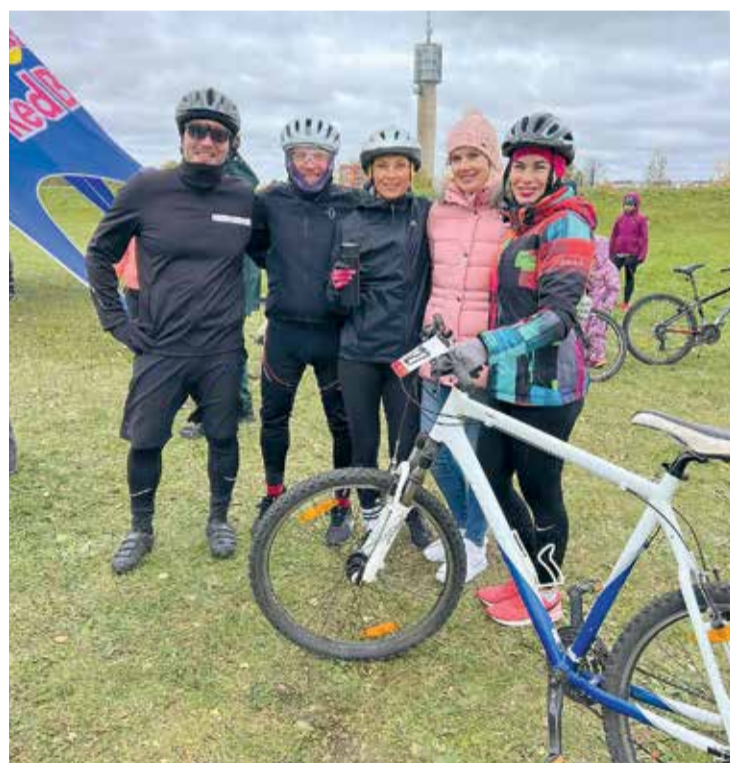
Vairums sportistu, kuri piedalījās Salaspils daudzciņņā, ir aktīvi dalībnieki arī citās Salaspils sporta nama organizētajās sacensībās.

Konkurence bija spraiga, taču labākie daudzciņņieki tika noskaidroti. 23. oktobrī Salaspils sporta namā notika apbalvošanas ceremonija, kurā tika apbalvoti katras vecuma grupas 1.-3. vietas ieguvēji sieviešu un vīriešu kategorijā.