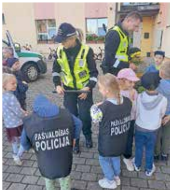
Nodarība PII "Daugaviņa" audzēkņiem.