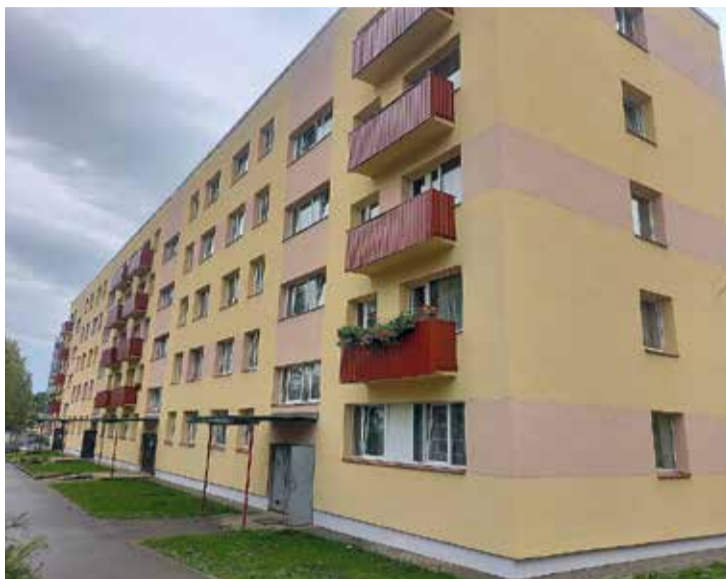
Daudzdzīvokļu māja Daugavmalas ielā 36, Saulkalnē.

Salaspils novada domes sēdē 2023. gada 28. septembrī nolemts piešķirt pašvaldības līdzfinansējumu 30 000,00 eiro apmērā energoefektivitātes paaugstināšanas pasākumu veikšanai daudzdzīvokļu dzīvojamai mājai Meža ielā 9A, Salaspilī. Tikpat lielu pašvaldības līdzfinansējumu – 30 000,00 eiro apmērā – energoefektivitātes paaugstināšanas pasākumu veikšanai nolemts piešķirt arī daudzdzīvokļu dzīvojamai mājai Daugavmalas ielā 36, Saulkalnē, Salaspils novadā. Abu minēto daudzdzīvokļu dzīvojamo māju apsaimniekotājs ir SIA "Namu pārvaldīšana".