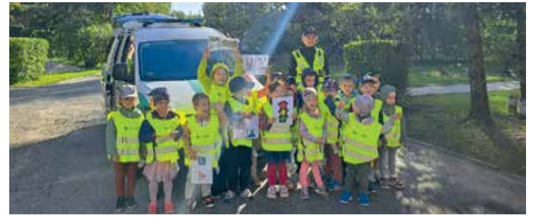
Nodarība PII "Atvasīte".

tika informēti par drošības pasākumiem, kas jāievēro pārvietojoties no mājām uz izglītības iestādi un atpakaļ, kā arī par gājēju un velosipēdista, pienākumiem, elektroskrejriteņa izmantošanas tiesībām, par drošību dzelzceļa tuvumā, par atpūtu ūdenstilpņu tuvumā, par drošības pasākumiem, pārvietojoties transportlīdzeklī, iepazīstināti ar policijas darbu