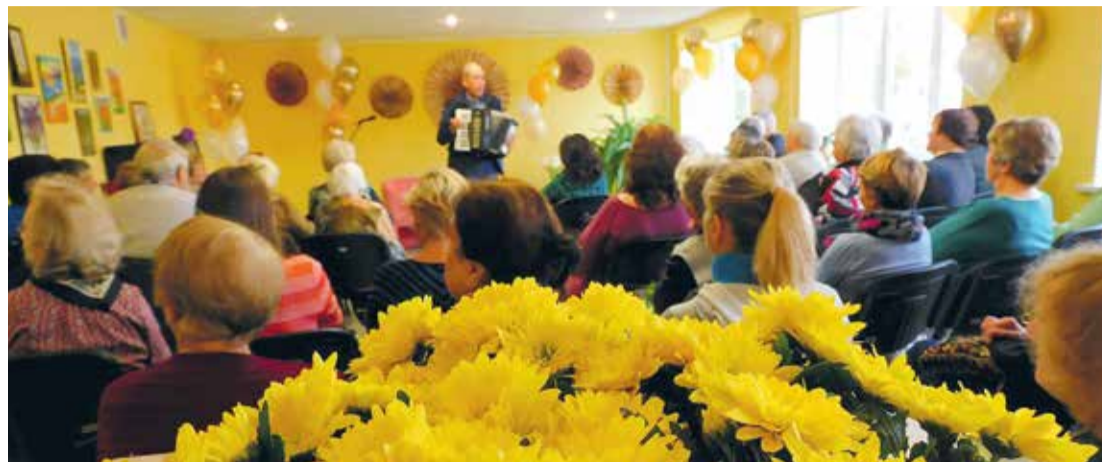
Svētki Salaspils Sociālajā centrā.

astotais darbības gads un jau pašsaprotami liekas, ka nav jābrauc uz Salaspili, lai piedalītos dažādās nodarbībās, pasākumos un saņemtu konsultācijas par sociālo palīdzību. Pateicoties ieguldītajam darbam un sadarbībai starp Salaspils novada pašvaldību un Sociālā dienesta vadību, šāds projekts tika īstenots un Saulkalnes apkaimes iedzīvotājiem tapa pašiem savs centrs un vieta, kur pulcēties!