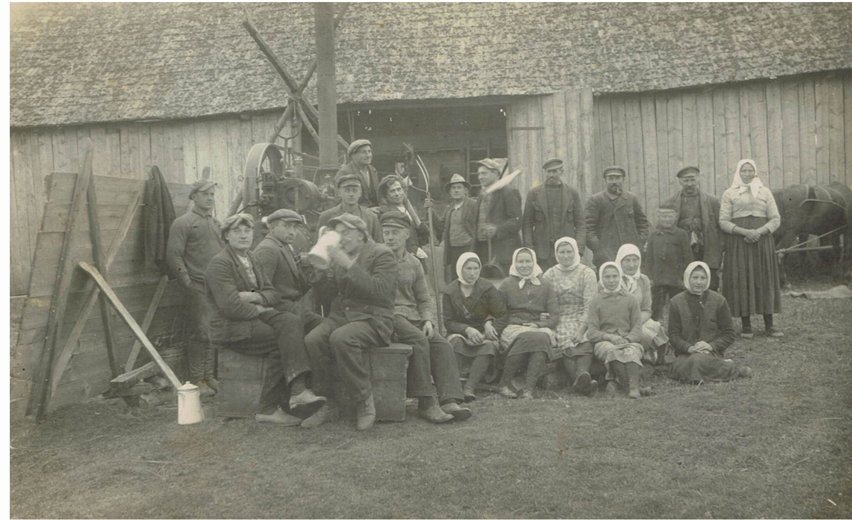
Fotogrāfs nav zināms. (1953). Labības kulšana "Guļās" 1953. gadā. [Izdošanas vieta nav zināma] : [izdevējs nav zināms]

Bibliotekāra loma vietējās kopienas atmiņu vākšanā, glabāšanā, sargāšanā