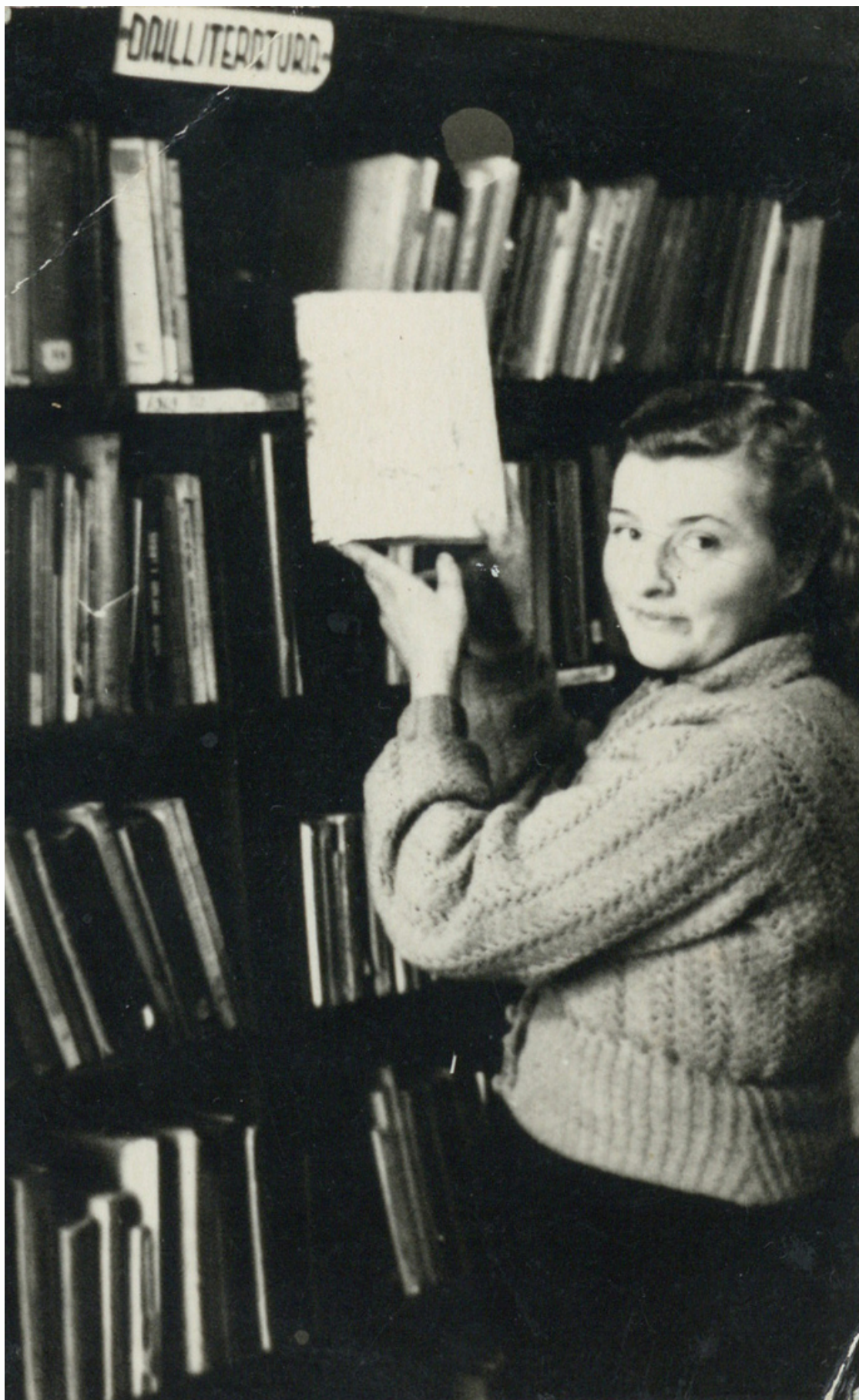
Fotogrāfs nav zināms. (1956). Marta iepazīstina lasītājus ar grāmatām 1956. gads. [Izdošanas vieta nav zināma] : [izdevējs nav zināms]