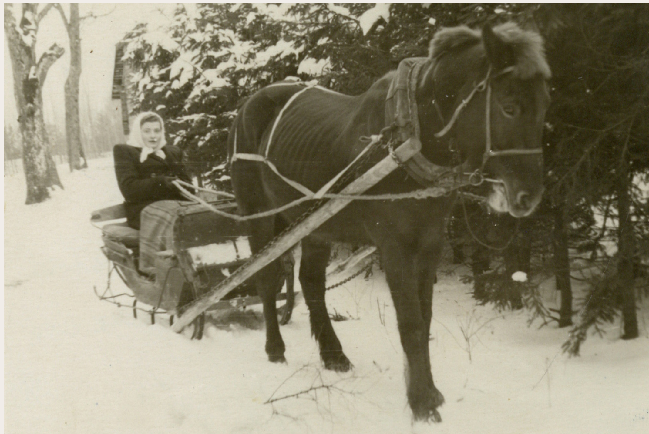
Fotogrāfs nav zināms. (1956). Marta ved grāmatas. [Izdošanas vieta nav zināma] : [izdevējs nav zināms]