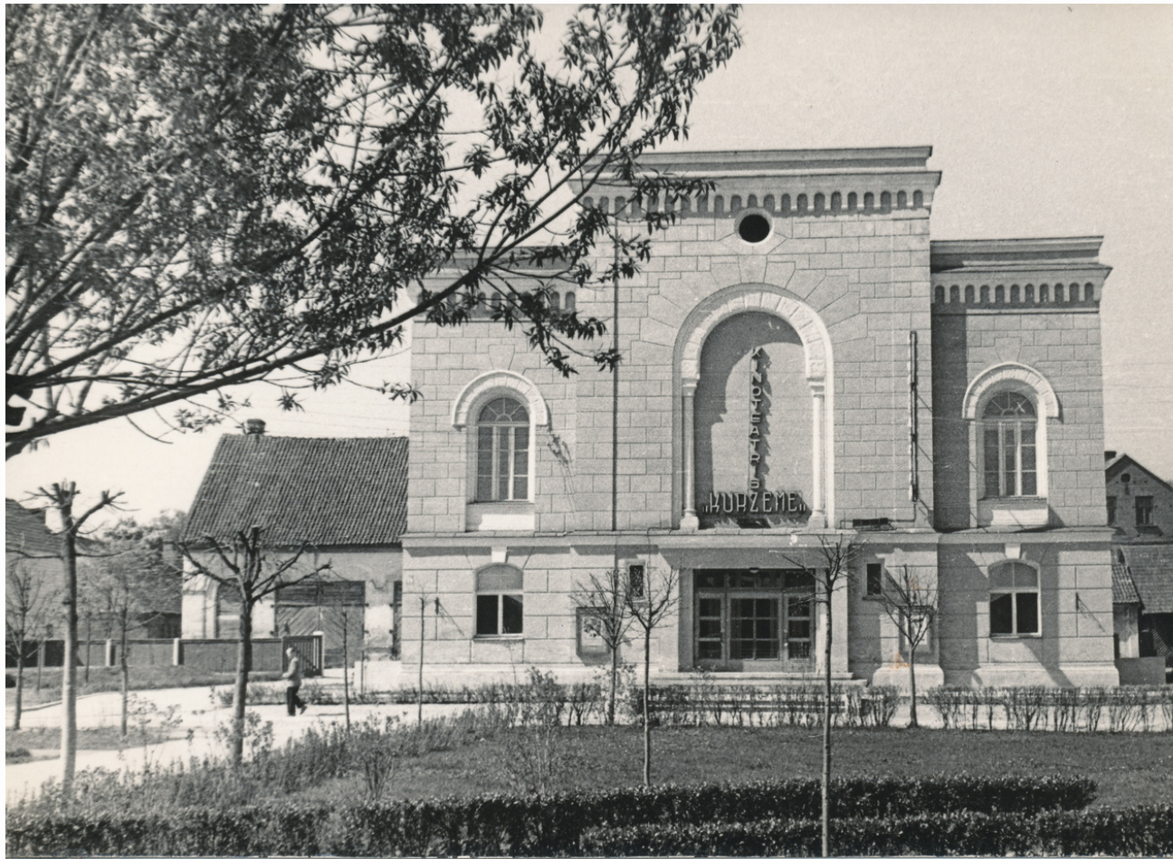
Šķipsna, I. (195?). Kinoteātris "Kurzeme" neilgi pēc atklāšanas. [Kuldīga] : [izdevējs nav zināms]