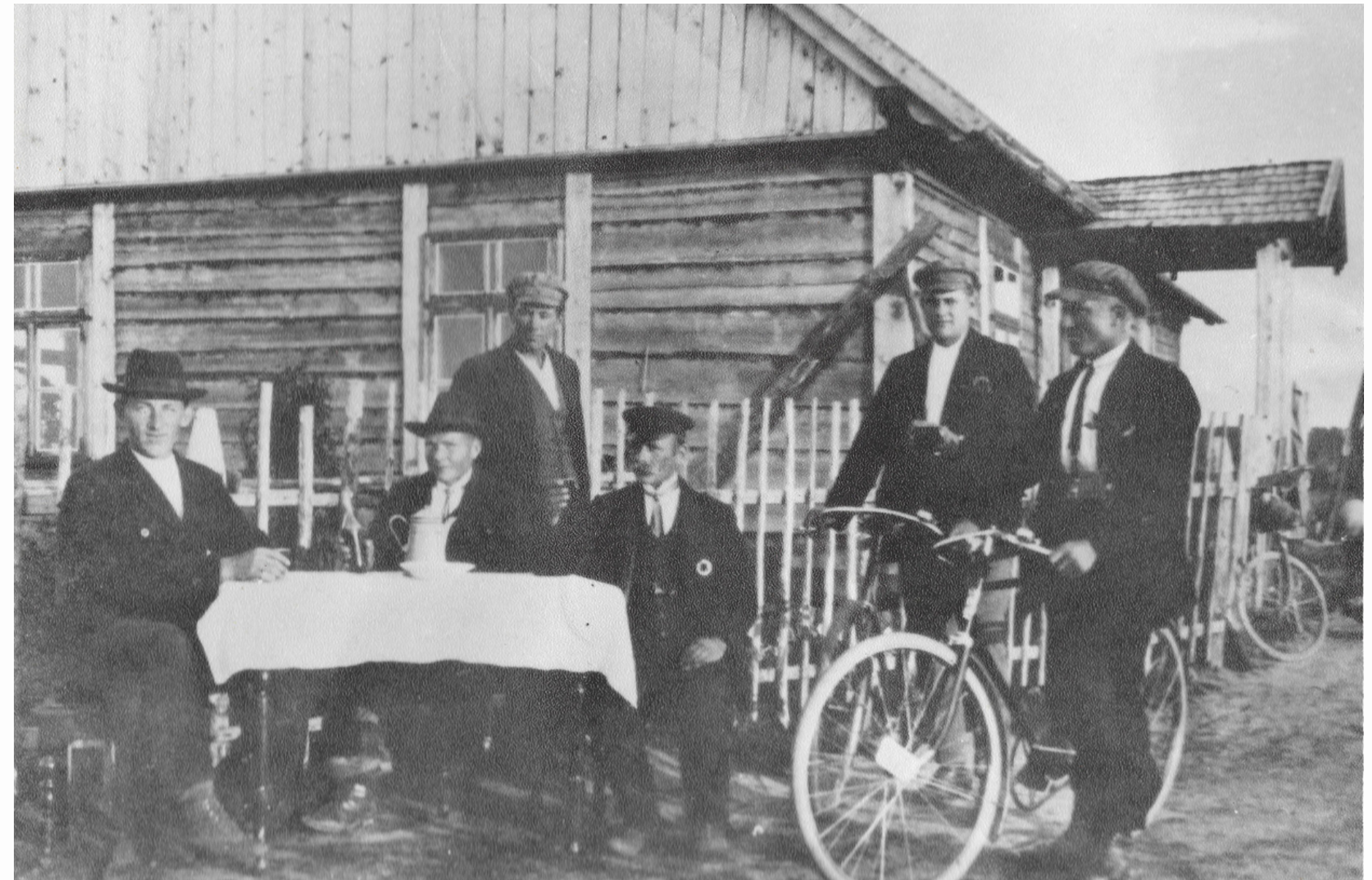
Fotogrāfs nav zināms. (1948). Kolhoza dibināšana . [Izdošanas vieta nav zināma] : [izdevējs nav zināms]