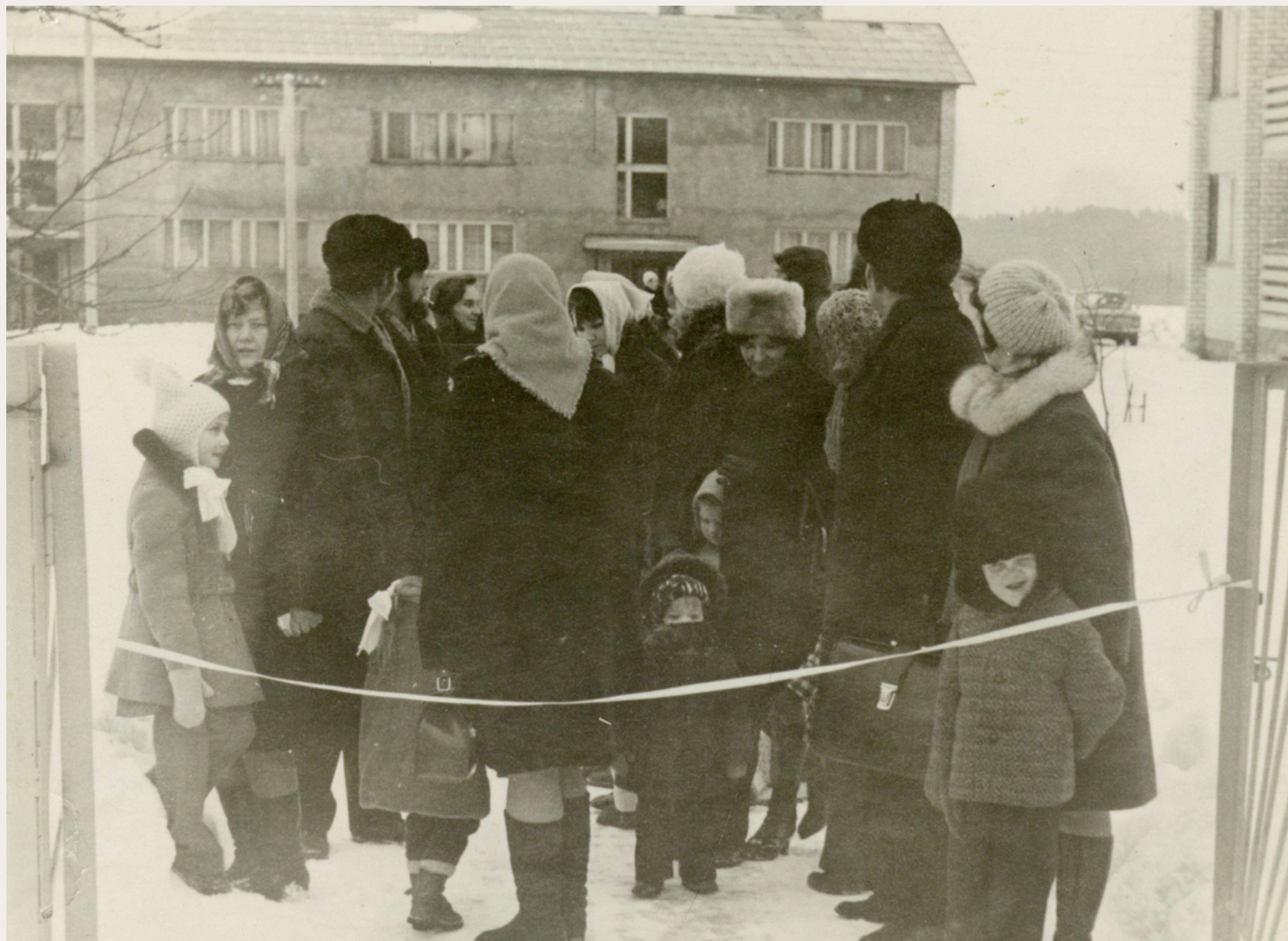
Fotogrāfs nav zināms. (1977). Pirms bērnudārza "Bitīte" atklāšanas. [Izdošanas vieta nav zināma] : [izdevējs nav zināms]