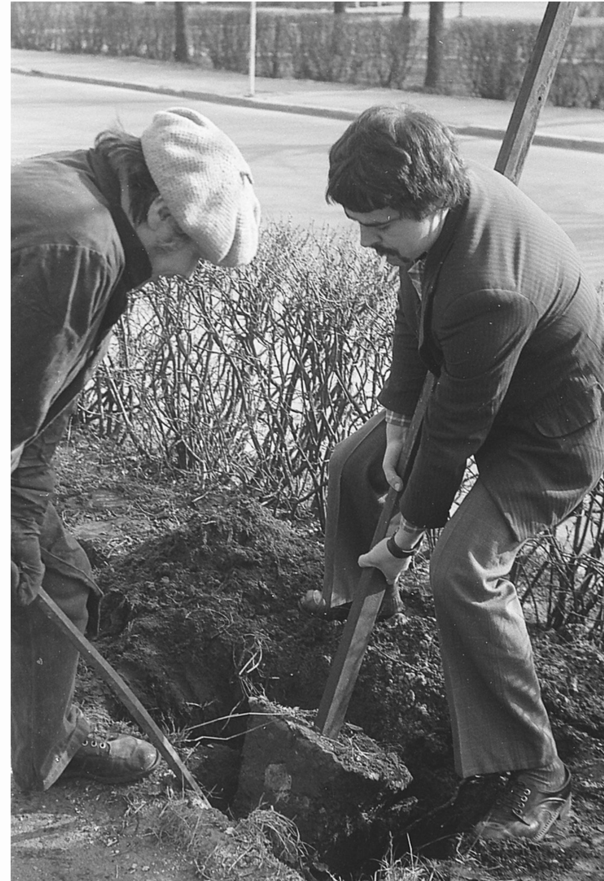
Fotogrāfs nav zināms. (1981). Kinoteātra apkārtnes labiekārtošanas darbi. Kuldīga : [izdevējs nav zināms]