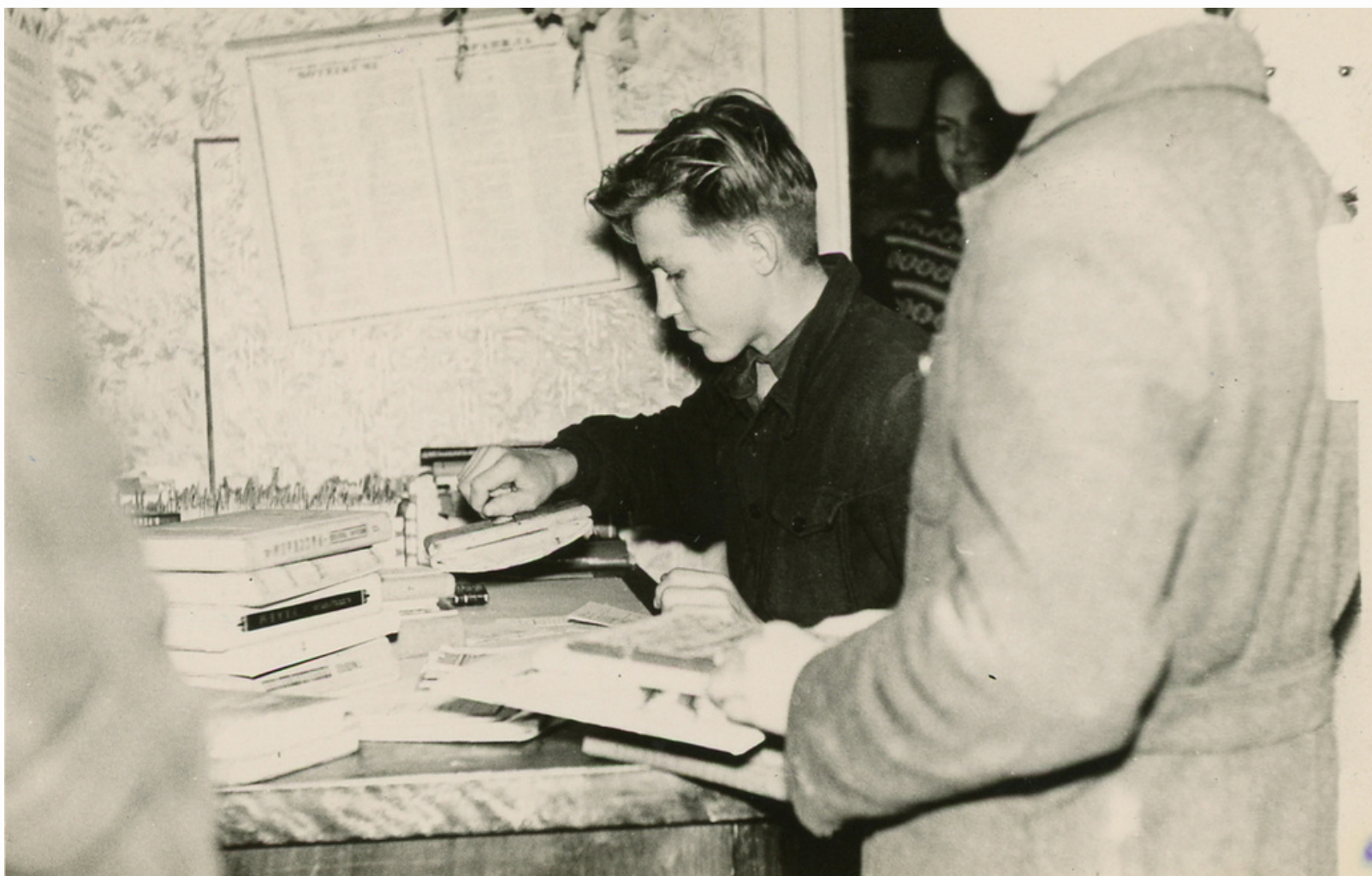
(1954). Bērnu bibliotēka 1954. g. "Čaklie lasītāji". Kuldīga : [izdevējs nav zināms]

Grāmatas, seriālizdevumi, analītiskie izraksti