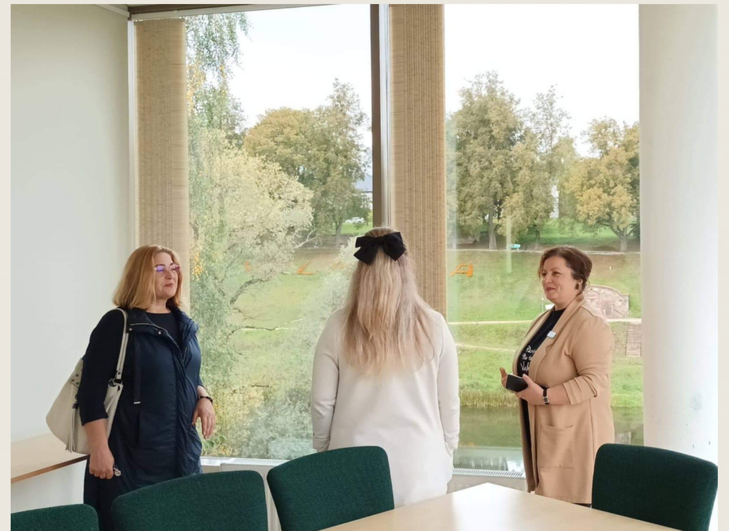
Valmieras integrētajā bibliotēkā