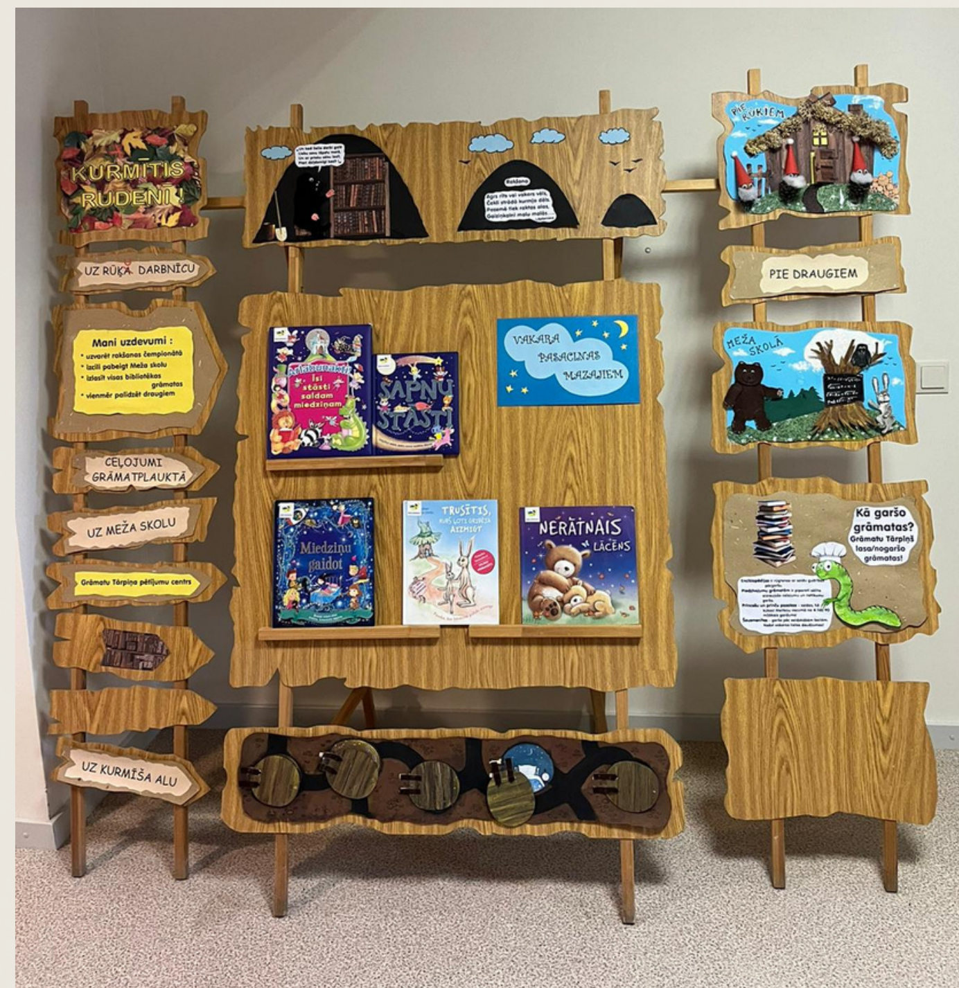
Aizkraukles novada centrālā bibliotēka