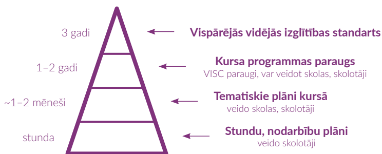
2. attēls. Mācību satura plānošanas līmeņi