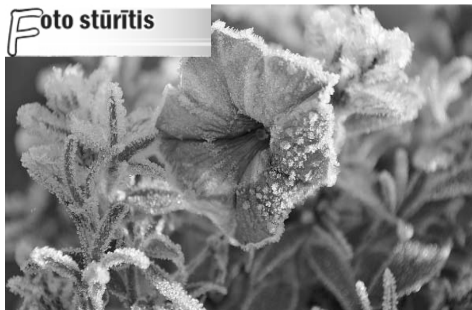
10. oktobra rīts Valkā.