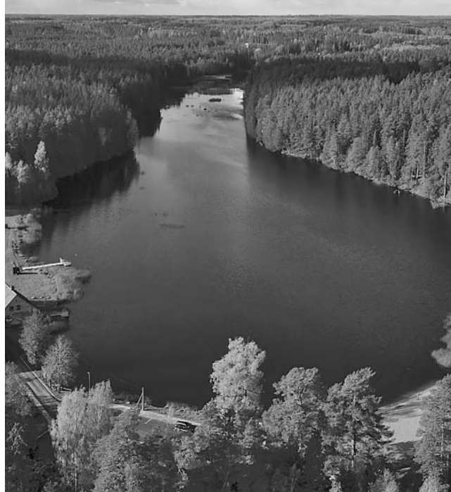
Zāģezers Valkā, foto Dace Pūce