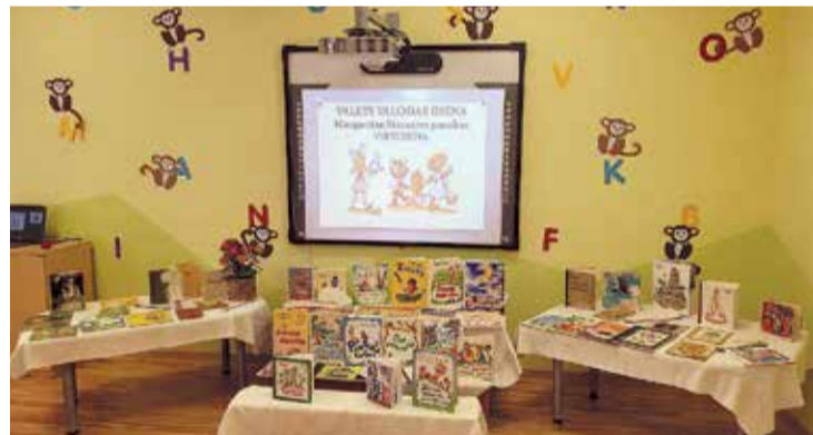
PII "Salaspils 2. pirmsskola" 12. oktobrī atzīmēja Valsts valodas dienu.

Salaspils novada PII "Salaspils 2. pirmsskola" kolēktīvs