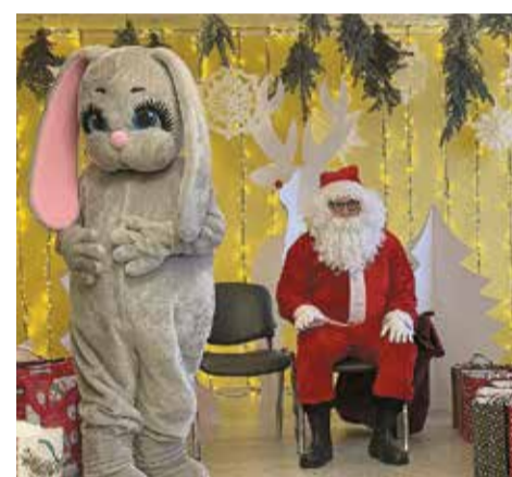
"Zelta atslēdziņas" Ziemassvētki.