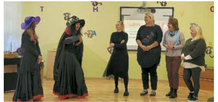
Pieredzes apmaiņas pasākums "Kas notiek dižmežā".

Tāpat, lai īpaši godātu latviešu valodu kā vienīgo valsts valodu Latvijā, Salaspils novada PII