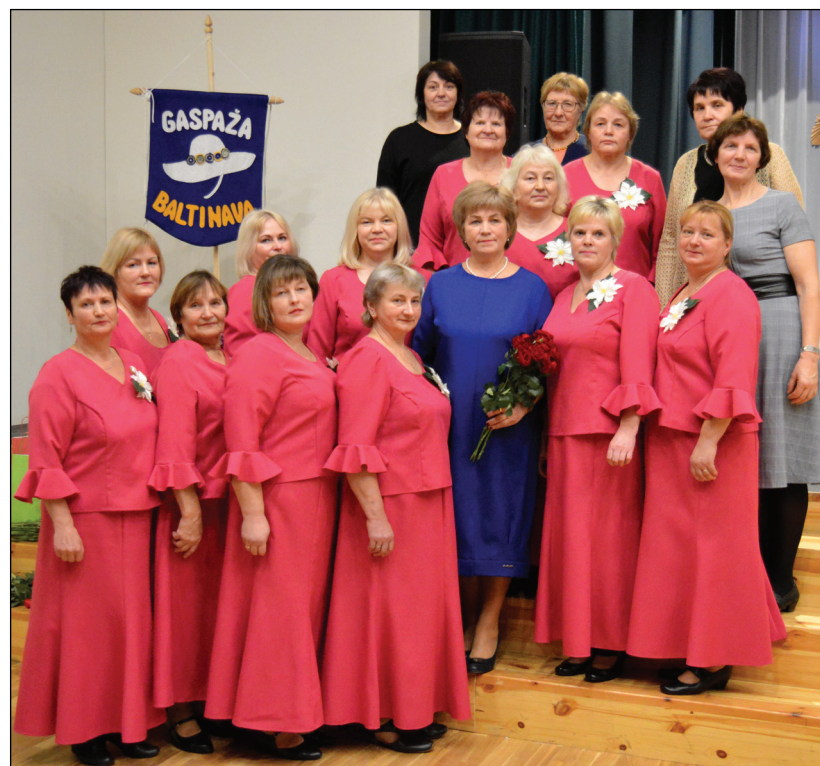
Paldies par nerimstošu mīlestību uz deju, dzīvesprieku un pašizaugsmes apliecināšanu! "Gaspāžas" ir kā sniega rozes, kas spēj uzziedēt neatkarīgi no laika apstākļiem.