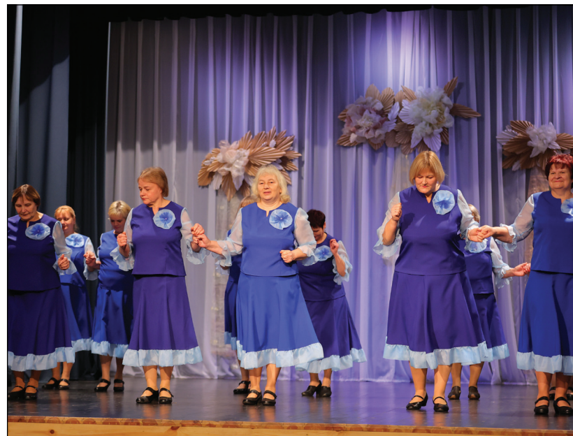
Deju kolektīvi pārsteidza skatītājus ar lielu deju bagātību un dažādību, parādot, ka katrs dalībnieks ir kā zieds, kurš var ziedēt jebkurā vecumā.