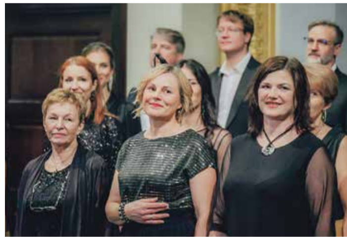
Jauktais koris „Sēja” jubilejas koncertā.

Kopš 1978. gada kolektīvs, prasmiņi apgūstot deju svētku obligāto repertuāru un piedaloties atlases skatēs, ir ieguvis tiesības un piedalījies visos Rīgas rajona, Vidzemes novada un Latvijas Dziesmu un deju svētkos. Saulkrastos tika radīti Latvijas senioru deju svētki, kas, mainot nosaukumus, joprojām