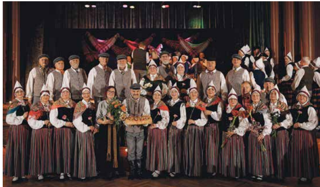
Saulkrastu deju kolektīvs „Saulgrieži”. 45 gadu jubilejas koncerts „Saulgriežu laiks”.

Novembris un decembra sākums ir laiks, kad vairāki Saulkrastu novada tautas mākslas kolektīvi varēja lepni pacelt galvas un skaistos koncertos svinēt savu kolektīvu dzimšanas dienas.