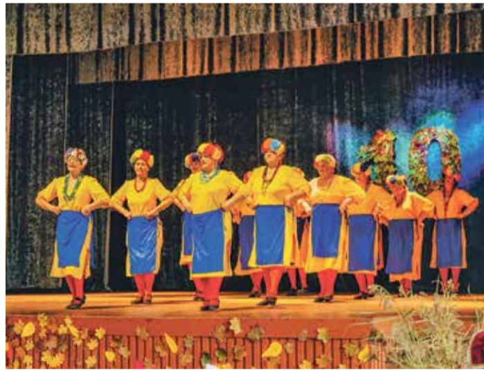
Tautas mākslas kolektīvs „Sandras kundzītes”.

Latvijā noris. Saulkrastos, „Saulgriežiem” līdzdarbojoties to rīkošanā, šo gadu laikā ir notikuši divi senioru deju svētku lielkoncerti. Savukārt „Sadancošana ziemas saulgriežos” ir kolektīva veidota ikgadēja draugu kolektīvu tikšanās katru gadu decembra sākumā bija dalība Eiropas lielākajā kultūras festivālā „Zvejniekciems”. Kolektīvs ir līdzdalīgs arī Saulkrastu deju festivālā „Sasala jūrīna”.