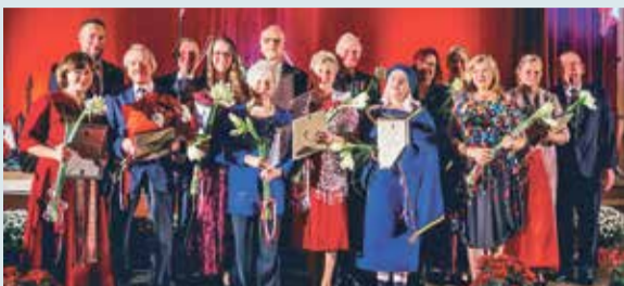
Pasniegti Atzinības un Goda raksti