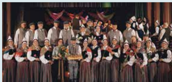
Tautas mākslas kolektīvi svin savus svētkus