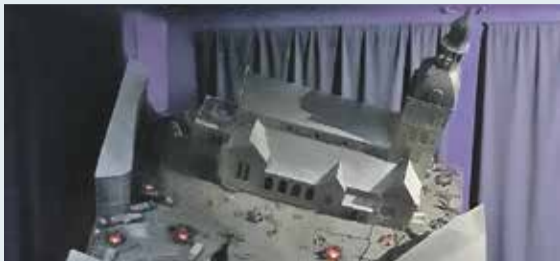
Tie paši „senie latvieši”, ugunskuri un sviestmaizes...