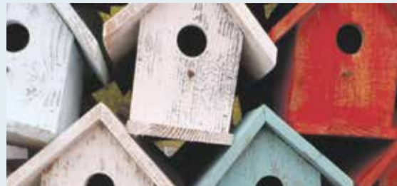
Nemaksā paaugstinātu NĪN par savu ipašumu