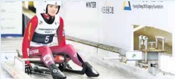
Kamaniņu sporta pamatus liek Saulkrastos