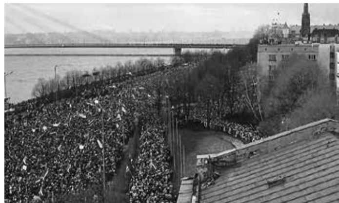
13. janvāris, 11. novembra krastmala, skats no „putna lidojuma”, no „Techniskās universitātes” jumta. Ar skatu uz „Vanšu tiltu”, uz kura ir redzami daudz cilvēku. Attēlota „Tautas demonstrācija”, kura tika organizēta pēc notikumiem Lietuvā, 12. janvāra naktī. Attēls un anotācija no 1991. gada barikāžu muzeja krājuma /Fotoattēls. Negatīva filma. Barikāžu laiks./