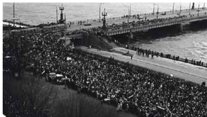
13. janvāris, 11. novembra krastmala, skats no „putna lidojuma”, no „Techniskās universitātes” jumta. Ar skatu uz Akmens tiltu. Redzama „Tautas demonstrācija”, kura tika organizēta pēc notikumiem Lietuvā, 12. janvāra naktī. /Fotoattēls. Negatīva filma. Barikāžu laiks./

ar barikāžu dalībniekiem – toreizējiem vai tagadējiem Saulkrastu novada iedzīvotājiem. Pirmo reizi tās tiks parādītas 2024. gada 20. janvārī plkst. 18.00 gadskārtējās 1991. gada barikāžu dalībnieku tikšanās laikā pie kultūras nama „Zvejniekciems”, bet pēc tam – padarītas pieejamas katram interneta lietotājam.