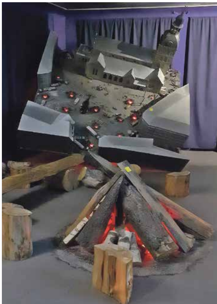
Vecrīgas makets 1991. gada barikāžu muzejā 13.01.2023.

Tautas demonstrācija 13. janvārī Daugavmalā bija spontāna, bet vērienīga. Starppilsētu autobusi un vilcieni, Rīgas sabiedriskais transports bija pārpildīts. Pilsētā pa visiem ceļiem ieplūda vieglās automašīnas, uzņēmumu un organizāciju autobusi. Pārdaugavas iedzīvotāji un no Kurzemes un Zemgales laukiem atbraukušie nāca pāri Daugavai ar sarkanbaltsarkanajiem karogiem, nezdami rokās arī agrākās tautas manifestācijās, kuras pēdējos gados nebija retums, izmantotos, kā arī no jauna zīmētos plakātus. Necik sen, tikai pirms pāris mēnešiem, 11. novembra piemiņu atgūvušajā bijušajā Komjau-natnes krastmalā dēļu vairogam piestiprinātās Ļeņina „galvas” uz Daugavu vērstais skatiens tika aizsegts ar prāvu auduma gabalu. Tribīnes bija pilnas, pilni bija tilti – gan pirms desmit gadiem atklātais Vanšu tilts, gan tilts, kuram sava nosaukuma nomainīju no Oktobra uz Akmens tiltu vēl būs jāgaida vairāk nekā gadu. Skatoties pirms 33 gadiem uzņemtajos,