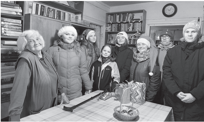
Grundzāles pamatskolas rūķi dodas iepriecināt vietējos seniorus ar gardām piparkūkām.