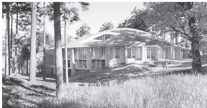
Otrajā vietā ierindojās darbs ar devīzi „PKL45”, autori SIA „MADE arhitekti”.

Smiltenes novada pašvaldības izpilddirektora vietnieks attīstības jautājumos