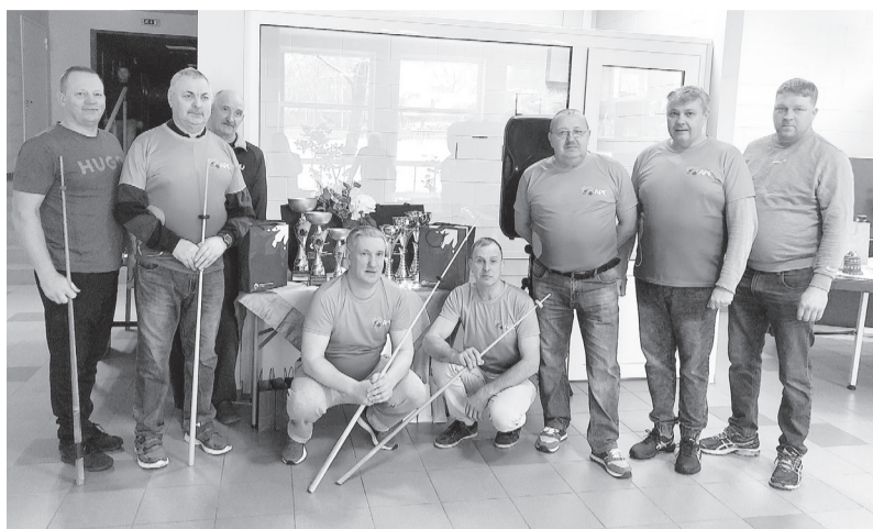
Noslēgušās sacīkstes novusā „Apes kauss 2023”.