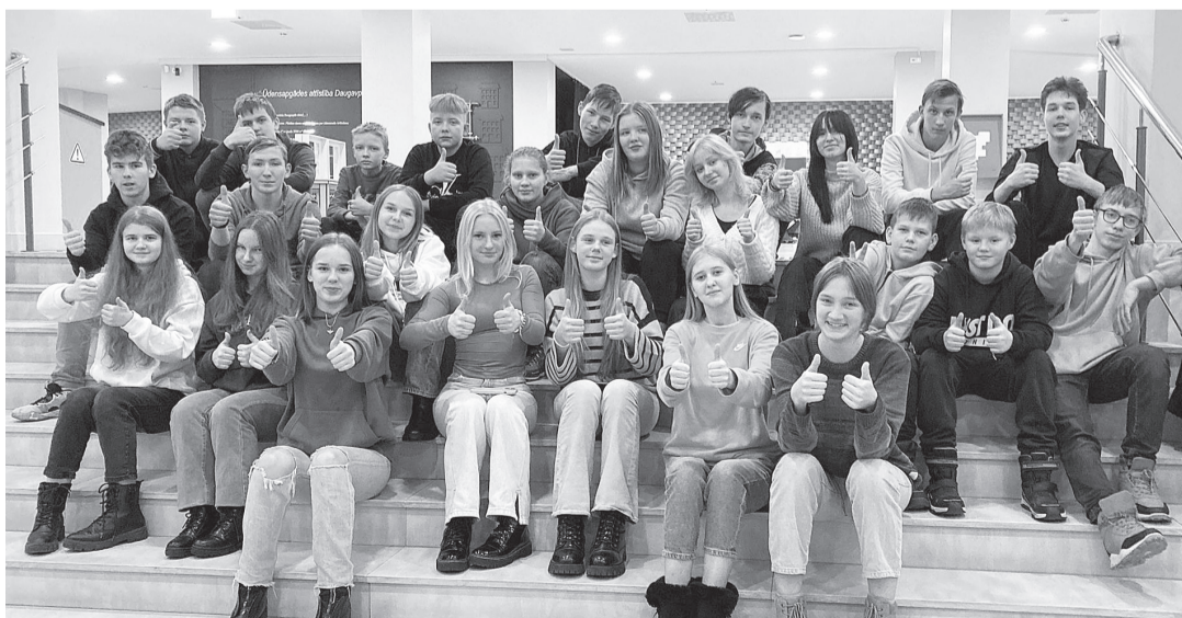
D. O. Apes pamatskolas skolēni viesojas Daugavpils Inovāciju centrā.