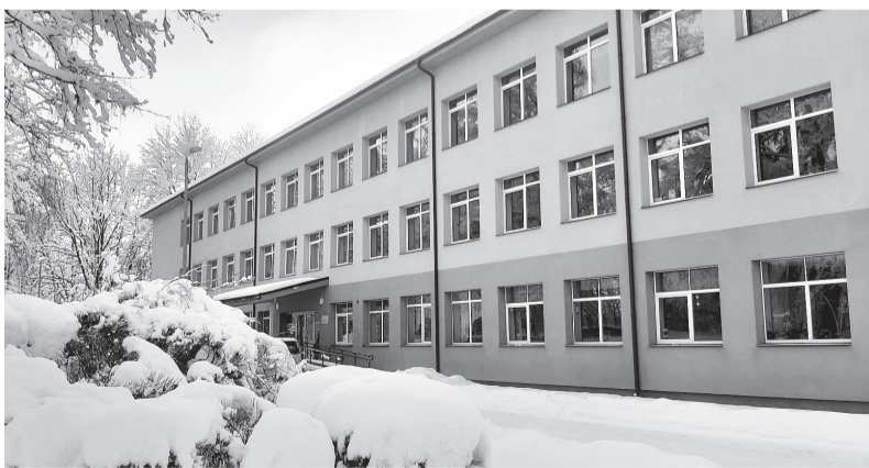
Dabā – ziemas miers, bet tehnikumā – spraigākais darba laiks.

1. viesmīlības pakalpojumu speciālistu kursa audzēkņi kopā