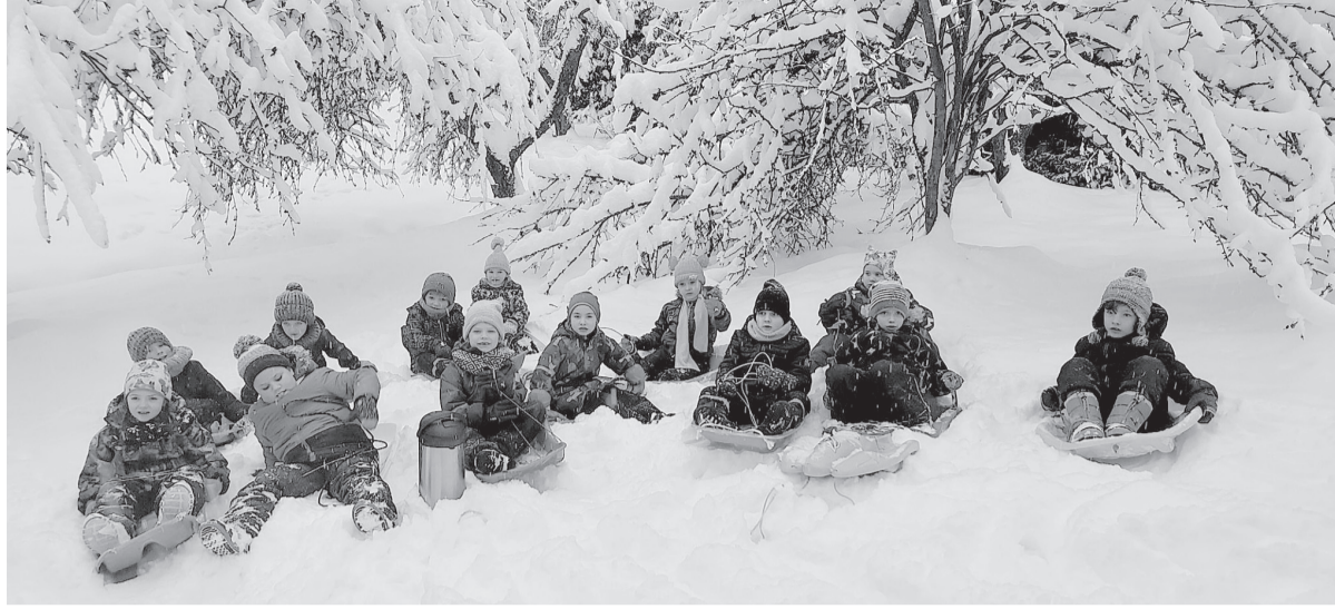
Palsmanes PII audzēkņi bauda ziemas priekus.

Kā skaistā ziemas pasakā, kas bagāta ar dziļiem sniegiem, Palsmanes pirmsskolā aizvadīts decembra mēnesis. Šis laiks iestādē bija bagāts burvīgiem notikumiem un īpašām emocijām. Aktualizējot Ziemassvētku gaidīšanas laiku, katras nedēļas sākumā kopā sanāca visi iestādes bērni un pedagogi, lai iedegtu gaismiņu adventes vainagā, tādējādi uzsverot gaismas, prieka, ģimenes un dāvināšanas prieka nozīmi šajā brīnumu gaidīšanas laikā. Lieliem un maziem kopā darbojoties rūķu darbnīcās, tika gatavotas dāvanas iestādes sadarbības partneriem un telpu svētku rotas, radot siltu un mājīgu svētku noskaņu tajās. Ziemassvētku pasākumi grupiņās bija aizraujoši un pārsteigumiem bagāti. Bērni ar lielu prieku piedalījās dažādās aktivitātēs, gatavojot svētku scenārijus un mīļas dāvanīņas saviem vecākiem.